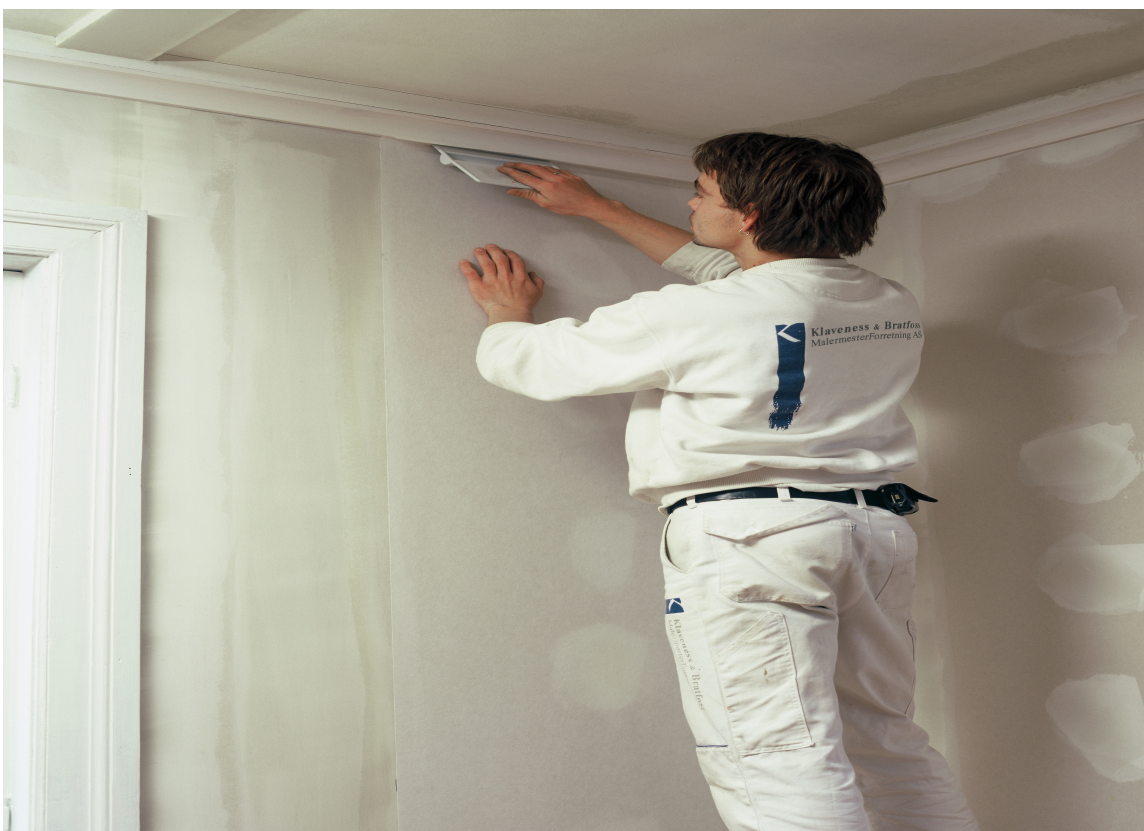
Renskjær tapetet mot tak- og gulvlist.