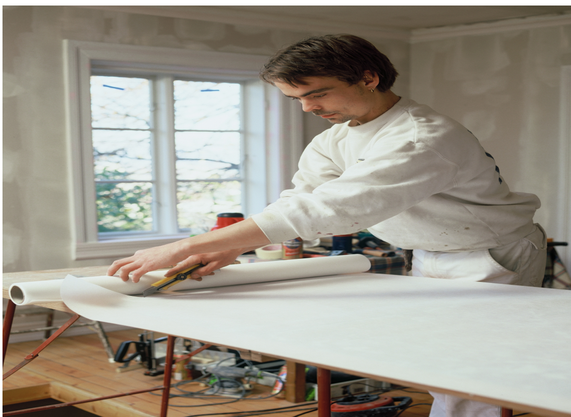
Limet påføres rett på vegg og da brukes en radiatorpensel i hjørnene og langs lister. Den kommer godt til.