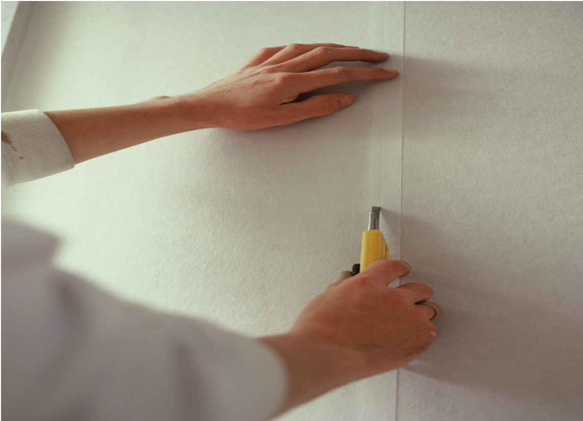
Så fjernes strimlene av overskuddstapet (to lag).