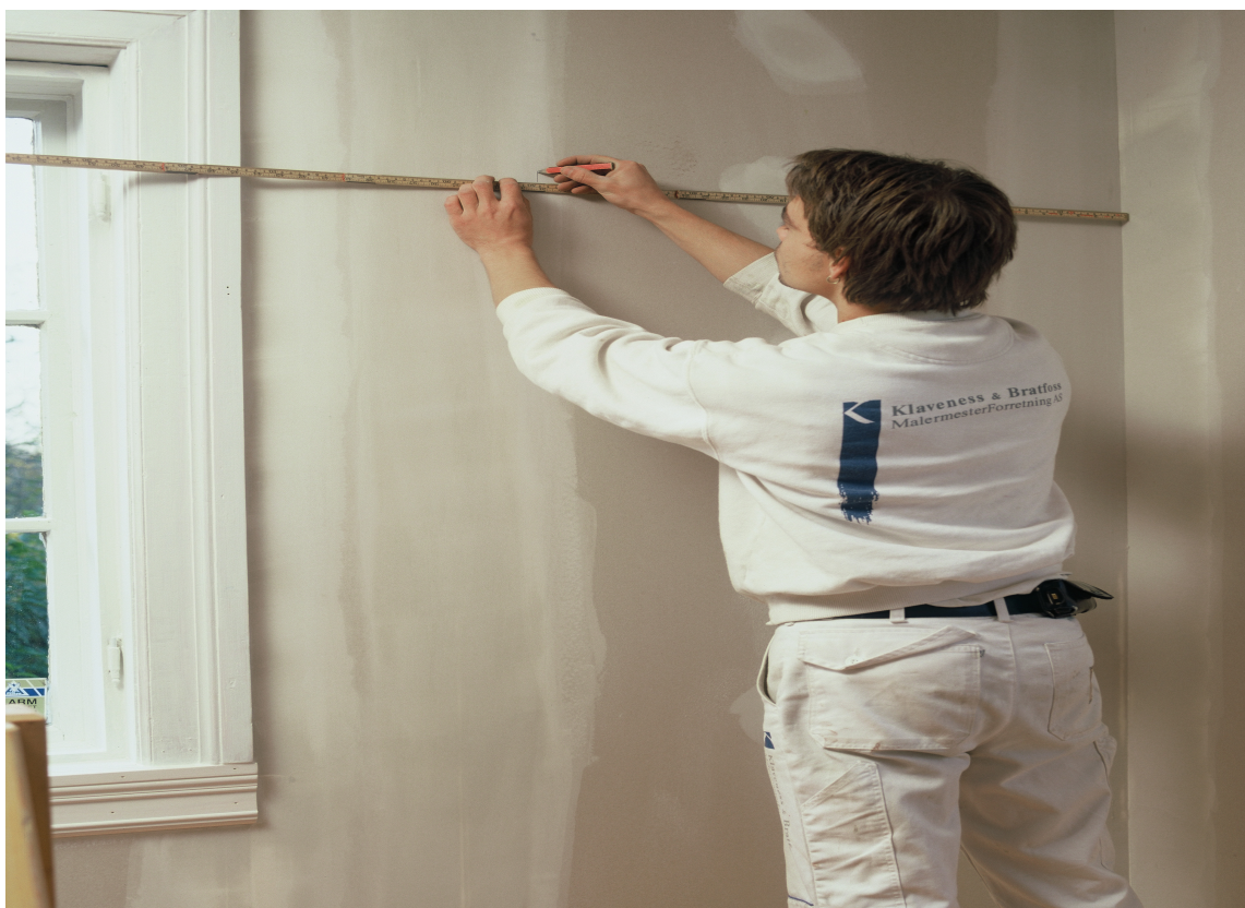
Så kappes lengdene til. Jobb på tapetbord - det gjør arbeidet lettere.