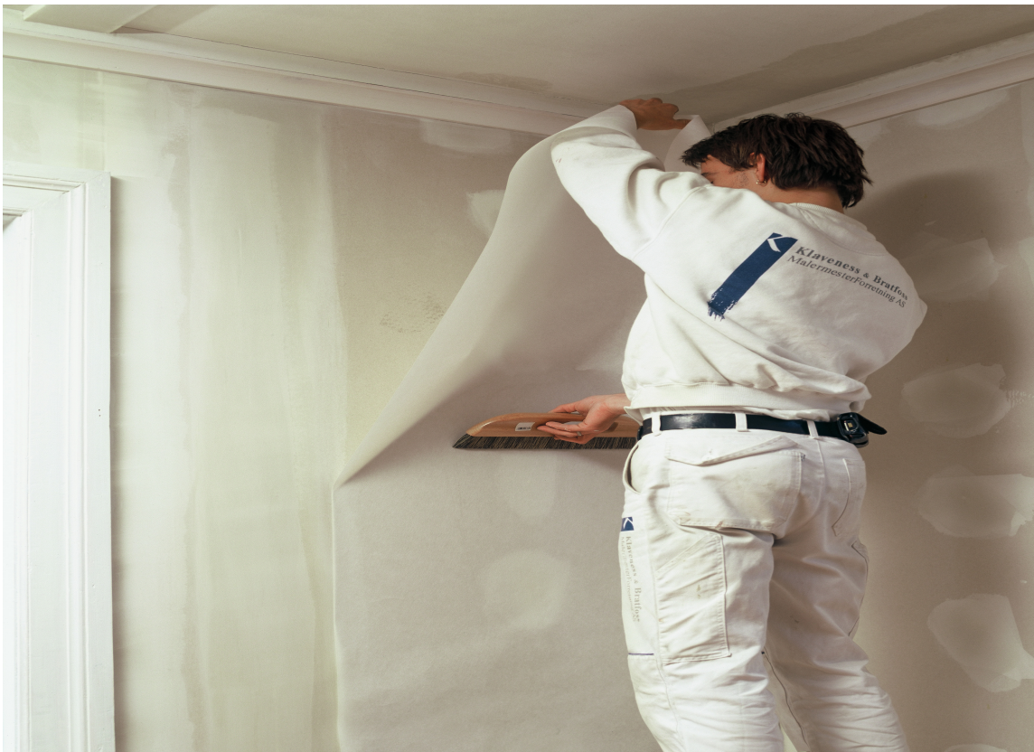
Fest tapetet godt langs listene med en tapetsletter.