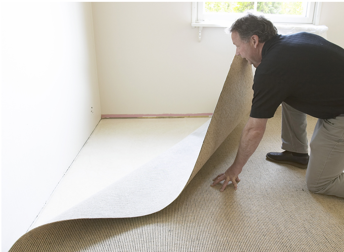
Bruk en skarp kniv og skjær teppet inn mot list/vegg og i hjørnene.