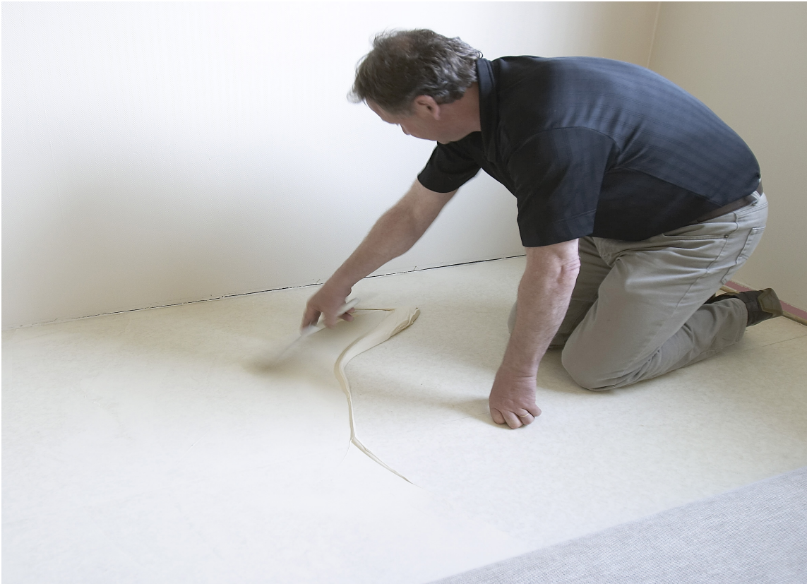
Brett teppet tilbake over limet og stryk godt på plass. Gjenta behandlingen for andre halvdel av teppet.