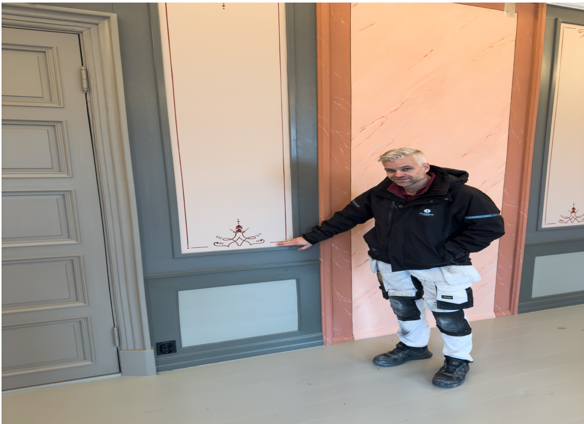
STREKDEKOR: Strekdekor i Kongegården. Brannmuren bak har marmorering malt i eggoljetempera.

Kongegården, også kjent som Wielegården, ble oppført rundt 1820 og er i dag et viktig historisk bygg i Halden. Restaureringen gir et sjeldent innblikk i hvordan farger og dekor har utviklet seg gjennom generasjoner, samtidig som bygget igjen kan brukes i dag.