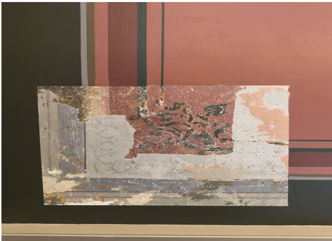
LAG PÅ LAG: Avdekking av original dekor. Rød dekor er frilagt med skalpell og brukt som grunnlag for rekonstruksjon, mens blå dekor stammer fra et nyere lag.