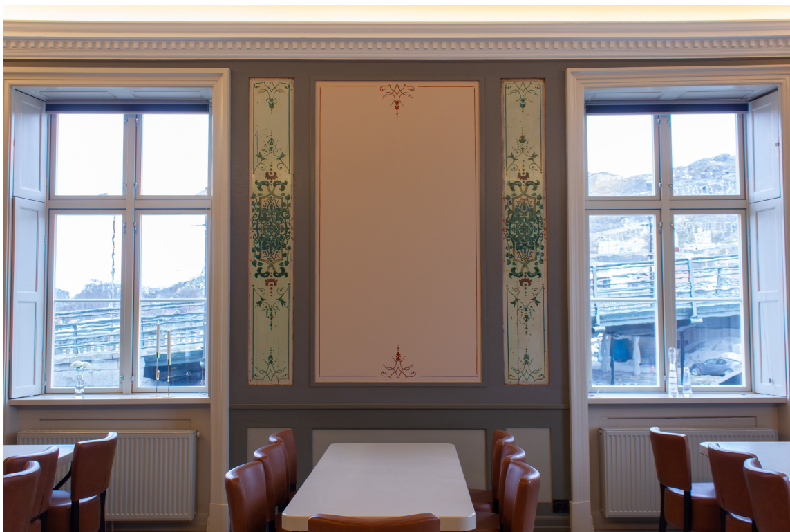
HISTORISK VEGGDEKOR: Restaurert vegg i Kongegården. Sidefeltene er renset frem, mens midtfeltet er rekonstruert med jutestrie, maskinpapir og linoljemaling fra Engwall o. Claesson, med dekor inspirert av de originale feltene.