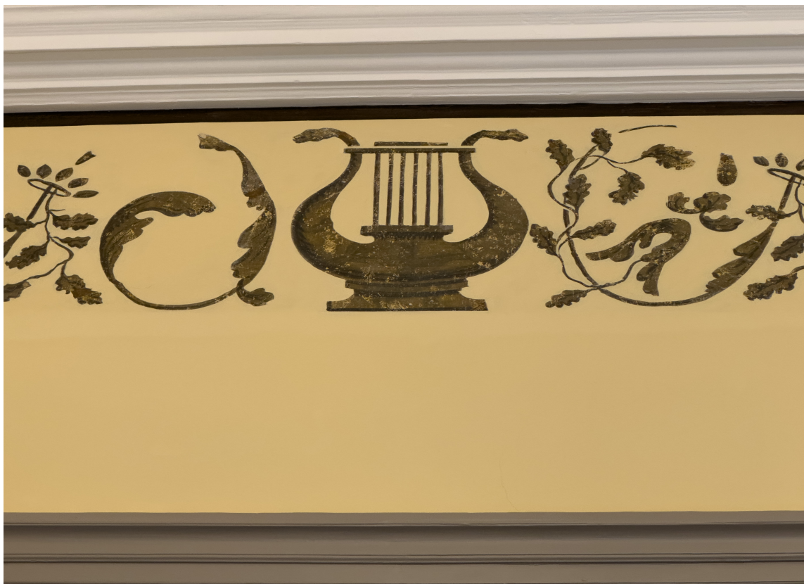
MUSIKKROMMET: Dekor i musikkrommet avdekket under flere lag med plater og tapeter. Motivet er forsiktig skrappt frem og frisket opp med kokt linolje.