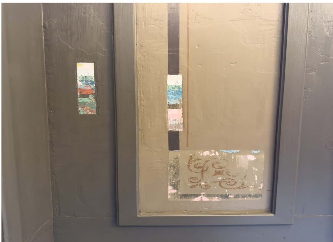
TIDSPERIODER: Fargetrapper viser flere malingslag. Her er et nyere lag valgt som utgangspunkt for videre arbeid for å bevare spor fra flere tidsperioder.