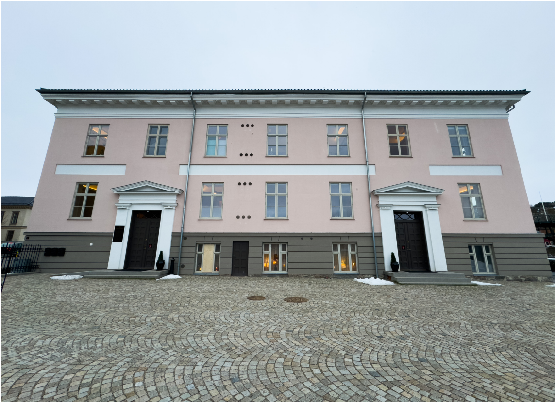
KONGEGÅRDEN: Kongegården, også kjent som Wielegården, er en fredet bygning fra 1820 som ligger sentralt i Halden og er et viktig historisk landemerke i byen.