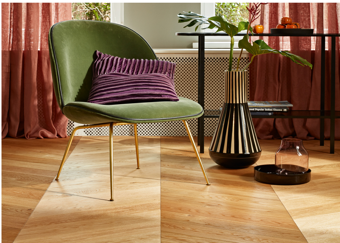
CHEVRON: Dette parkettgulvet med sicksakk-mønster, Chevron, er fra Boen.

Det er lett å forveksle chevron med fiskebensmønster, men forskjellen ligger i hvordan plankene møtes.