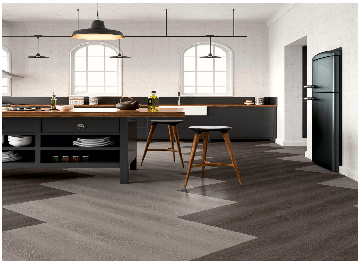
FISKEBEN: Dette vinylgulvet med fiskebensmønster er fra Polyflor.