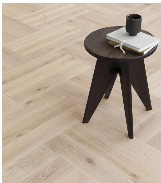
FLEKSIBELT: Fiskebensmønster kan legges med én og én stav, eller med flere sammen, her er det to og tre staver som danner mønsteret.