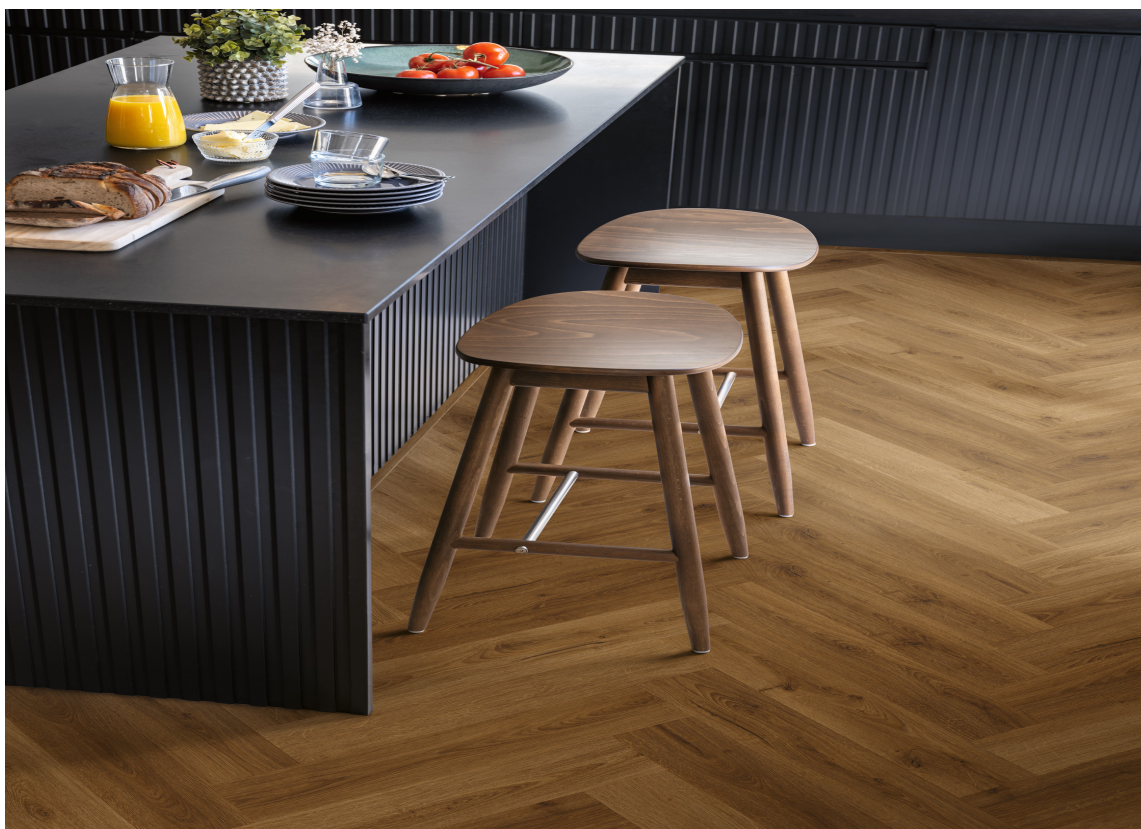
FISKEBEN: Dette mønstergulvet, fiskeben, er et laminatgulv fra Pergo.