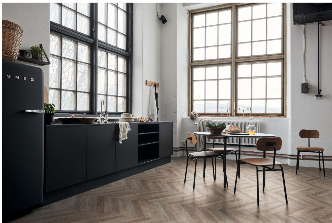
CHEVRON: Dette vinylgulvet i sicksakk-mønster, Chevron, er fra Forbo Flooring.