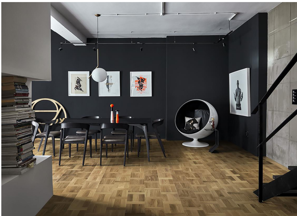
HOLLANDSK MØNSTER: Dette parkettgulv er lagt i Hollandsk mønster og kommer fra Kährs.