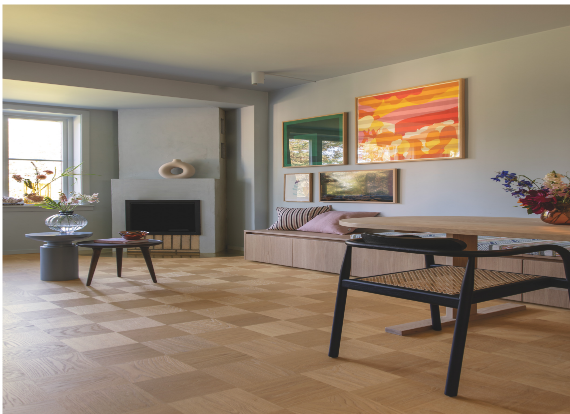
BIG BLOCK: Dette parkettgulvet med sjakkrutete mønster, Big Block, er fra Tarkett.