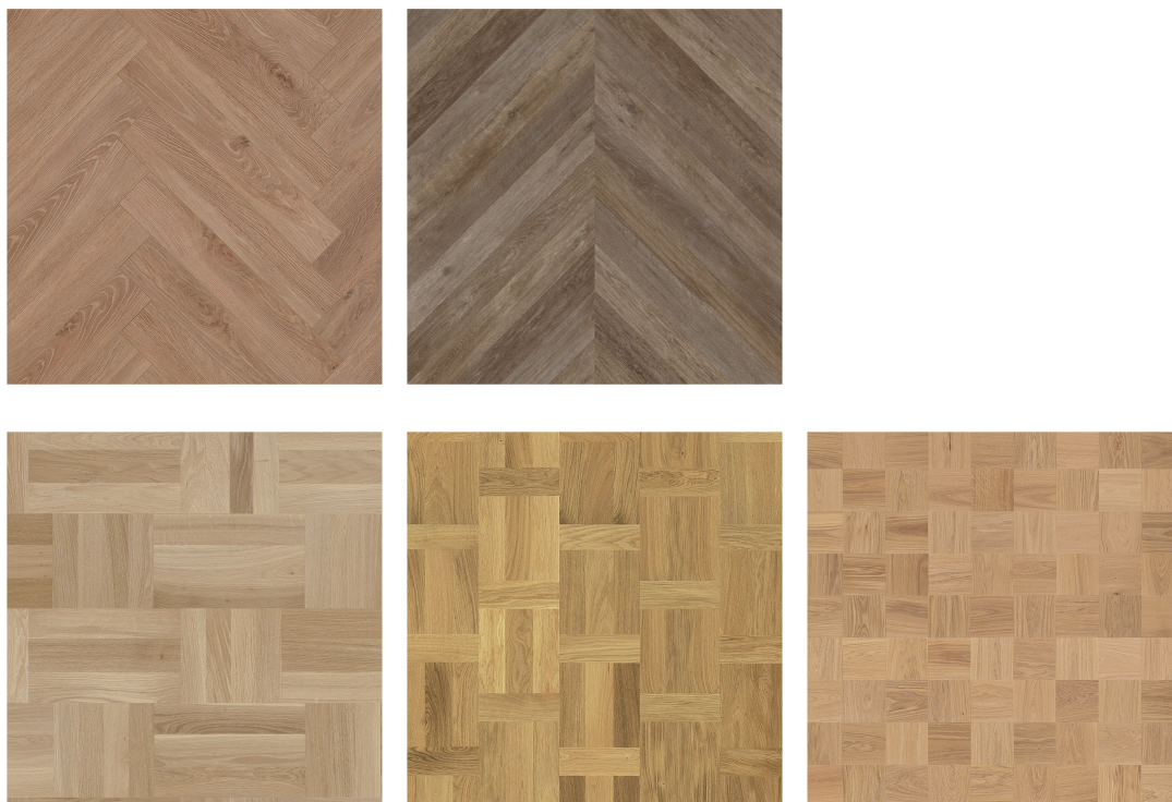
MØNSTEREKSEMPLER: Fiskebensgulv og Chevrongulv på øverste raden fra venstre. To ulike utgaver innen klassisk Hollandsk mønster og Big Block på nedre raden fra venstre.