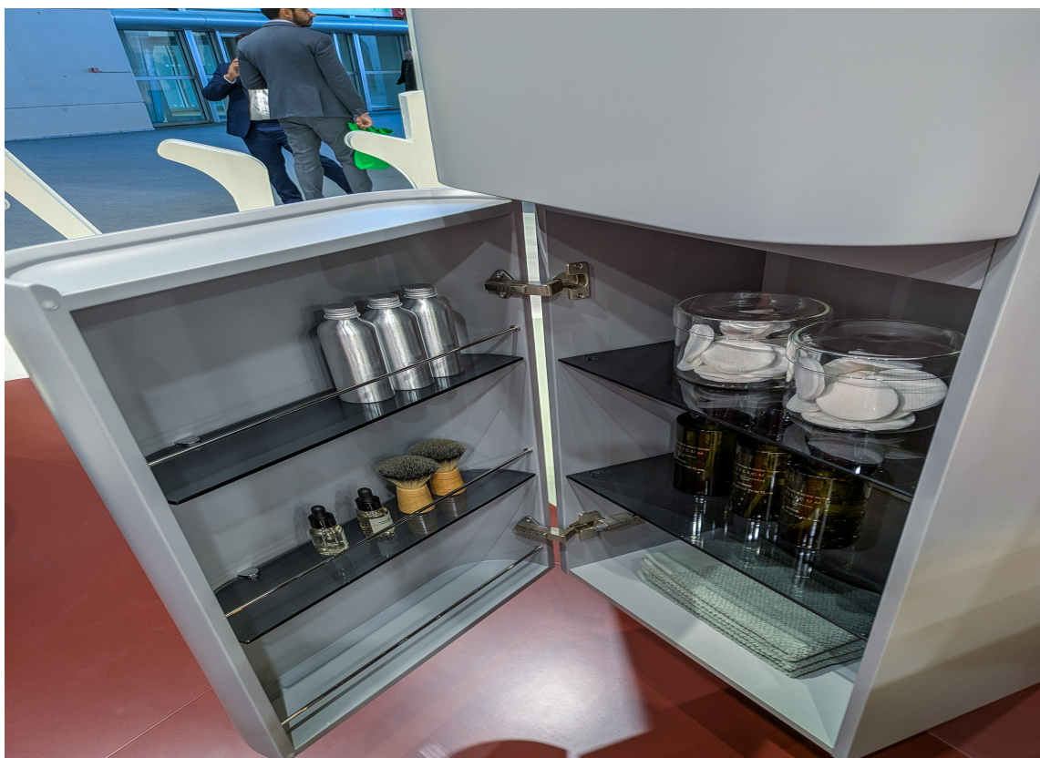
KJØLESKAP?: Dette høyskapet med retro former kunne minne litt om et Smeg-kjøleskap i formspråket.

Når vi tenker på innredning av baderom, er det ofte aktuelt å gjøre mest mulig ut av få og kostbare kvadratmeter. Også for små bad er smarte innredninger, høyskap og integrert lys viktig. Og også små bad innredes nå med farger på møbler, innredninger og tilbehør.