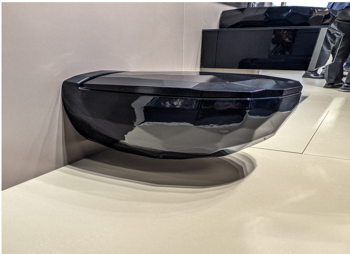
DEN SORTE DIAMANT: Utformingen av det veggengte toalettet Diamas er inspirert av sliping av diamanter. De mange fasettene reflekterer lyset gir et elegant utseende. Produsenten heter Ege Vitrikiye og kommer fra Tyrkia.

Uansett om du planlegger en totalreovering eller bare en liten oppgradering, viser trendene at baderommet i stadig større grad blir en personlig sone for velvære, farger og smarte løsninger. Velvære starter hjemme – og badet spiller en viktig rolle.