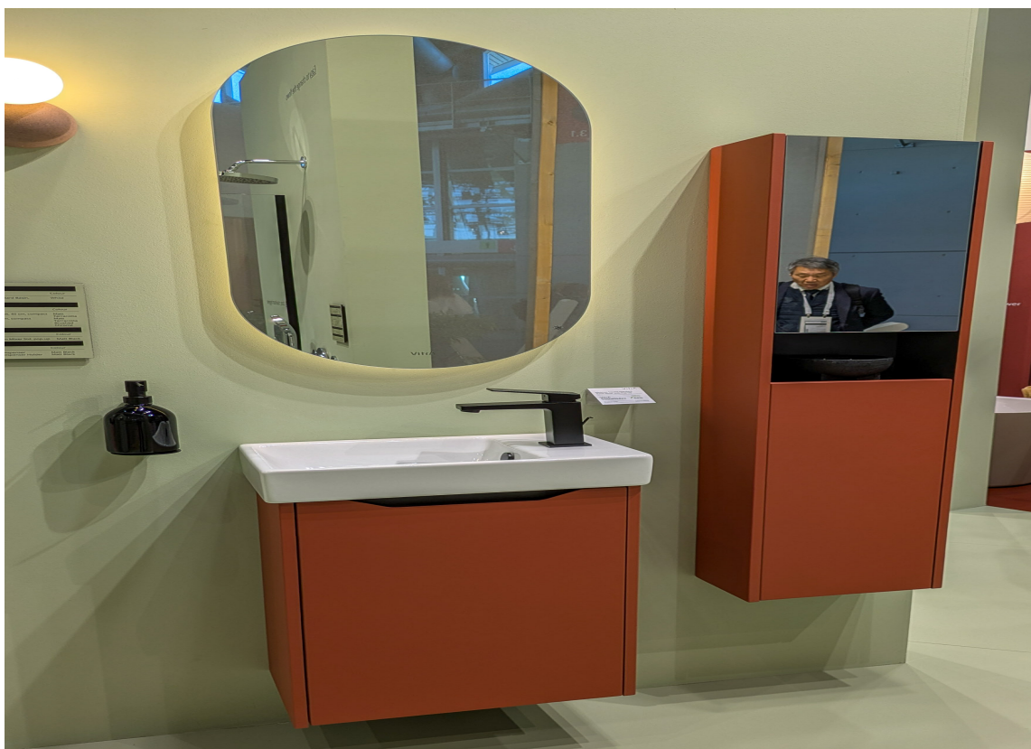
SMÅ BAD kler også farger. Her et smart møbel, Integra Square, fra Vitra i fargen Matt Terracotta.