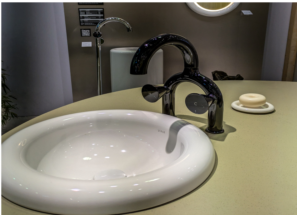
LUBNE, runde former og chunky fasong preger serien Liquid som Tom Dixon har tegnet for Vitra.