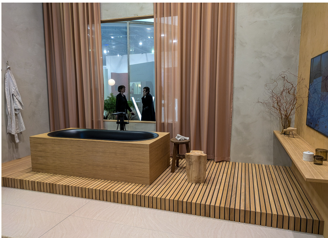
SPILELOOK: Treverk har en naturlig plass i våre hjem. Til og med på badet, som her hos Bette.