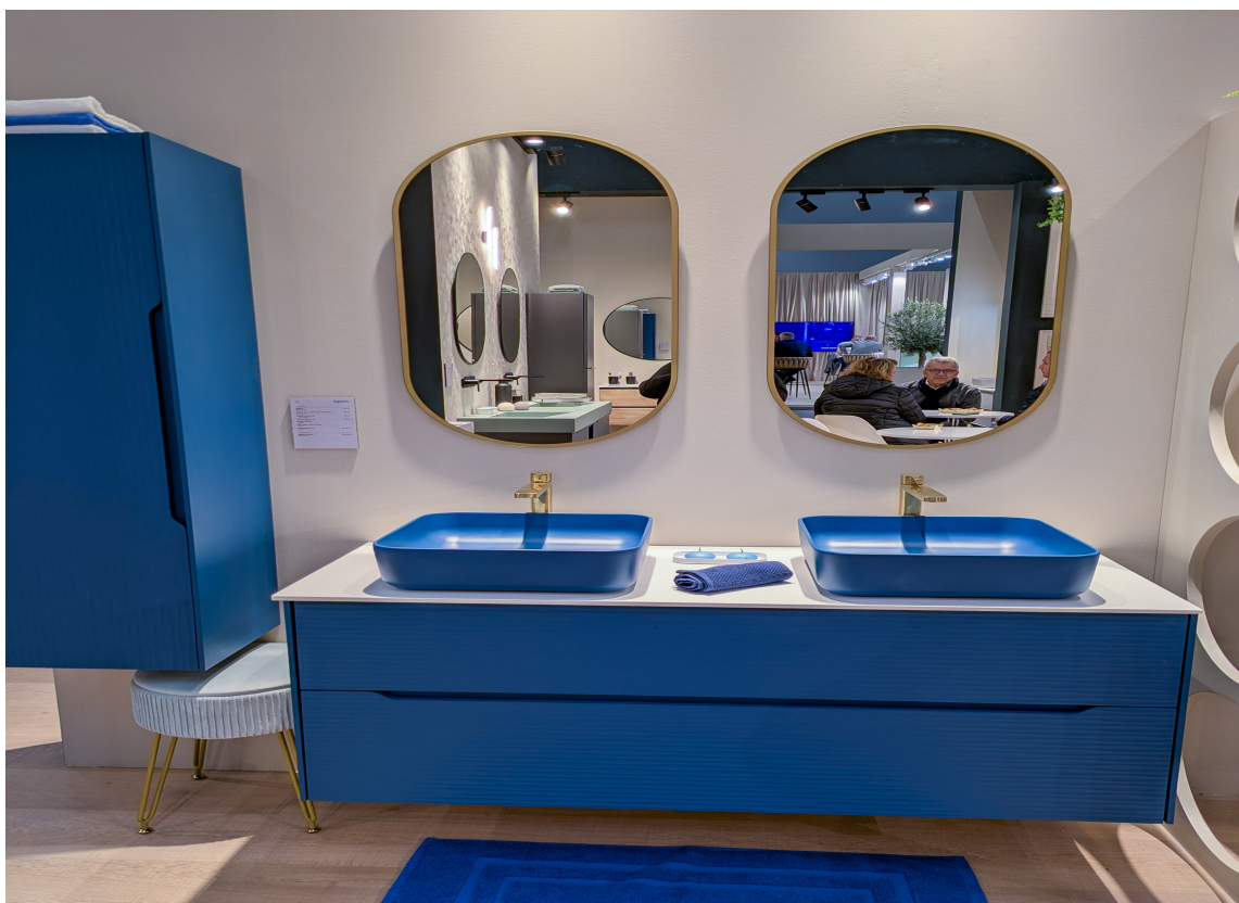
FRISKT: Ovale speil, raust med oppbevaringsplass og en herlig blå farge.