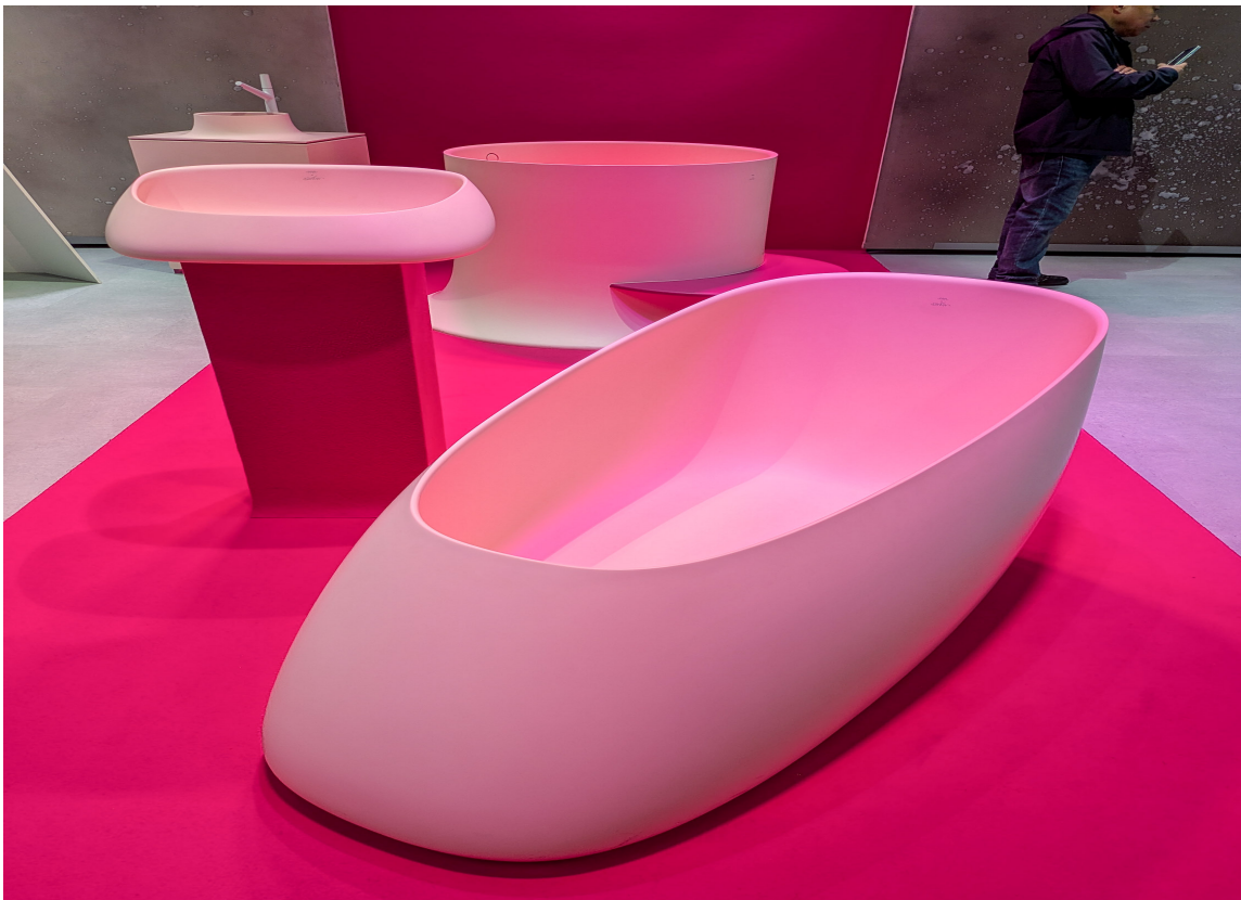
ALIEN-KOKONG: Pointe-serien er tegnet av Karim Rashid for PAA. Dette er et badekar i futuristisk stil, med en kokong-lignende form.

Også i dusjen er et populært med litt albuerom, og her kombineres gjerne en raus takdusj med en hånddusj. Ny teknologi sikrer at vannforbruket holdes lavt selv om dusjopplevelsen føles som et tropisk regnskyll. Noen dusjløsninger resirkulerer til og med vannet ved å filtrere, desinfisere og varme det opp igjen.