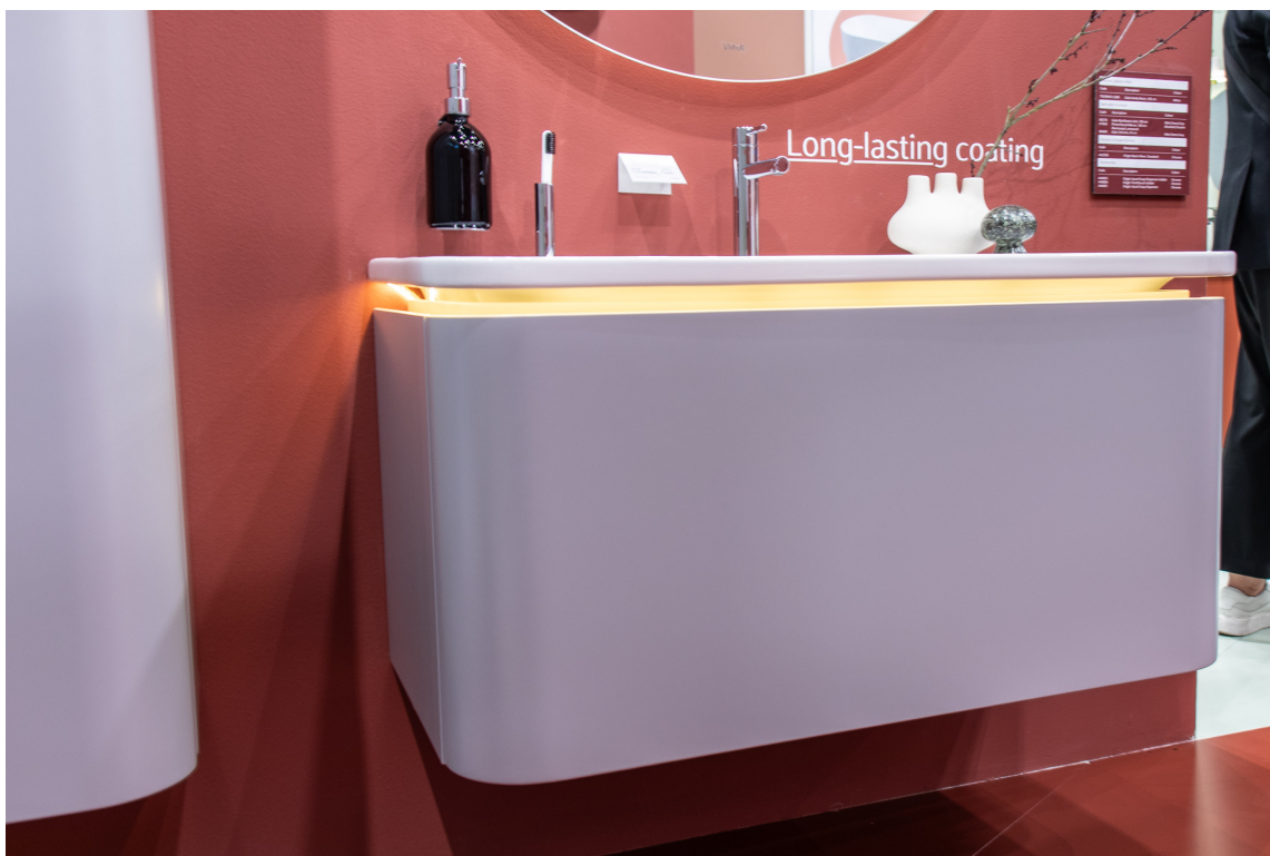
LYS: Belysning overalt! Her i mellomrommet mellom topp og skuff i et møbel fra Vitra.

Der speilene for et par år siden nesten utelukkende var runde, ser vi nå mer rektangulære former – dog med avrundede hjørner, og nærmest oval fasong.