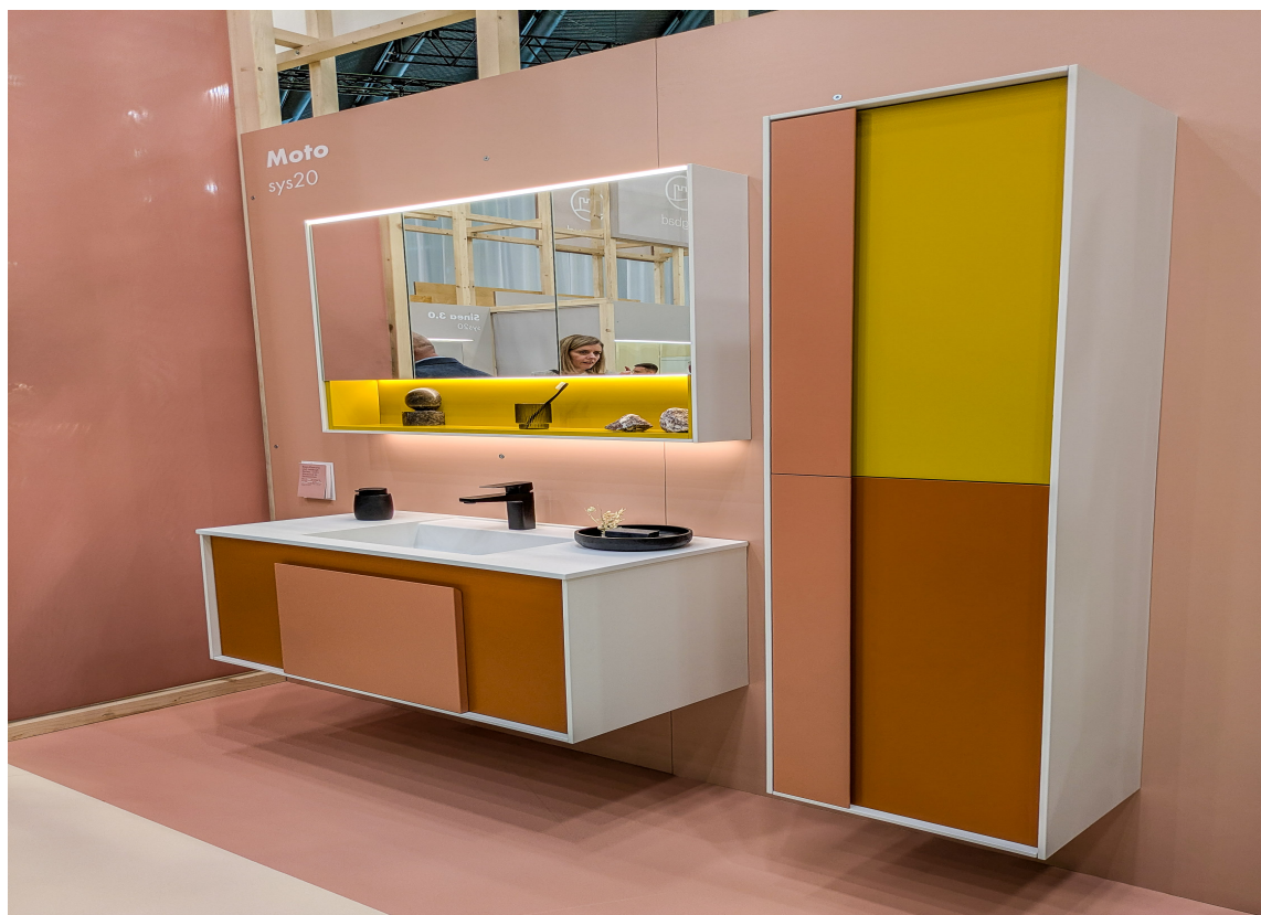
BURGBADS serie Moto kommer som lakkert i en rekke spreke farger, melaminbelagt eller med trefiner og kan tilpasses ulike stiler og ønsker med ti ulike servanter på toppen. Møblene har en ramme i sort eller hvitt.