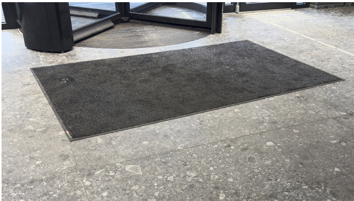
DØRMATTE: En sklisikker dørmatte er et vanlig syn ved kjøpesenter rundt om i landet. De beskytter også noe mot broddetråkk.