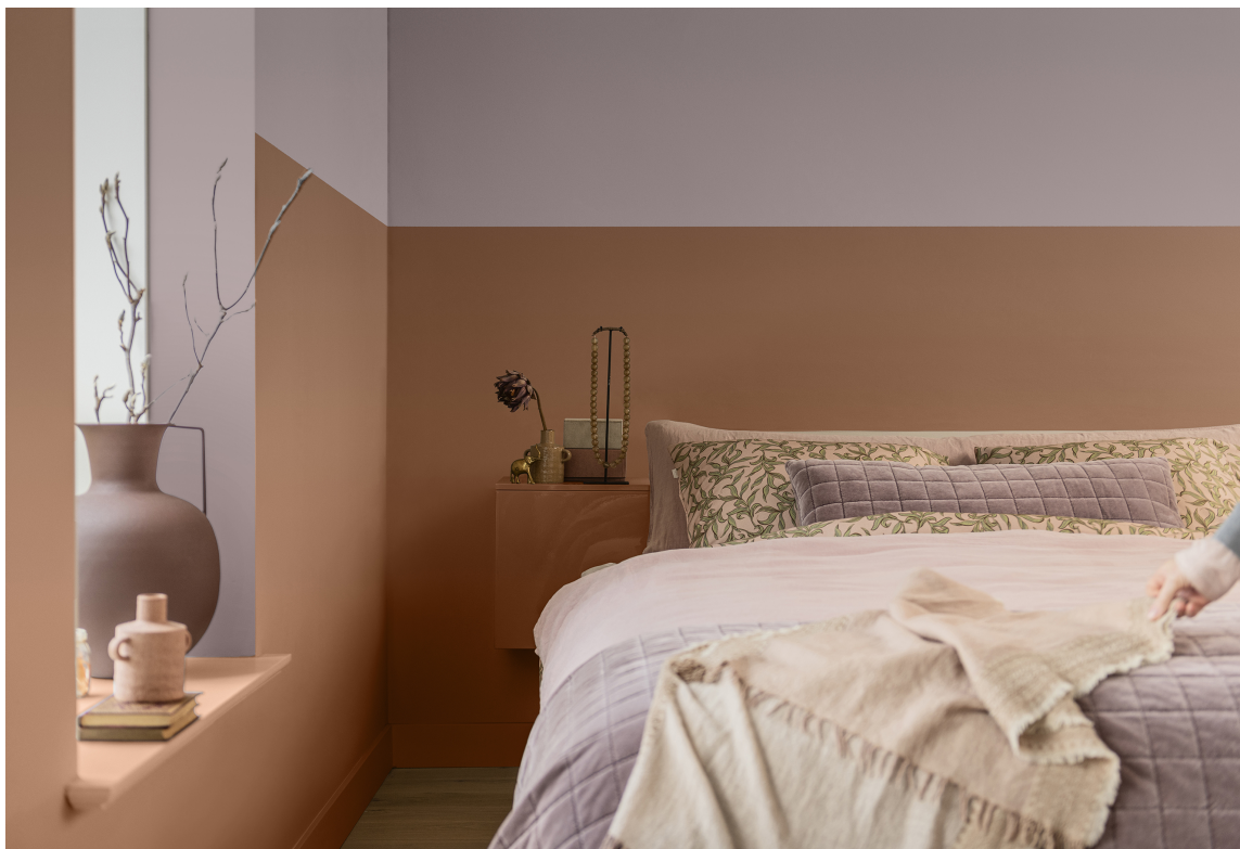
TODELT: Her er en behagelig ferskenfarge kombinert med rosa. Et uvanlig, men gøyalt, fargevalg.