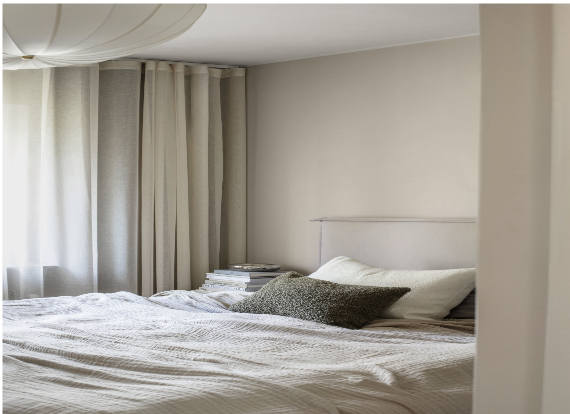
NORDISK: For mange er denne luftige, nordiske fargepaletten drømmefargen på soverommet.