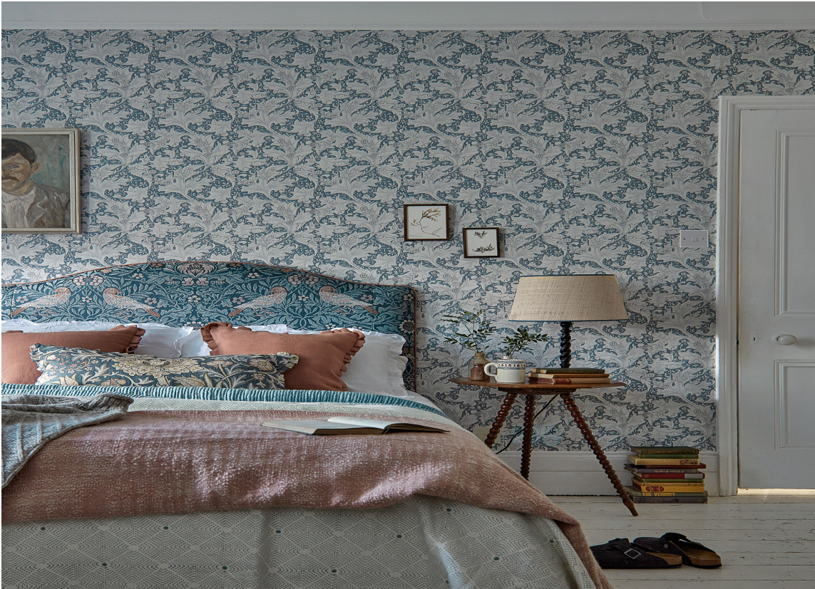
ANTIKT: Dette soverommet kombinerer en klassisk tapet med lyse farger og unike gjenstander.