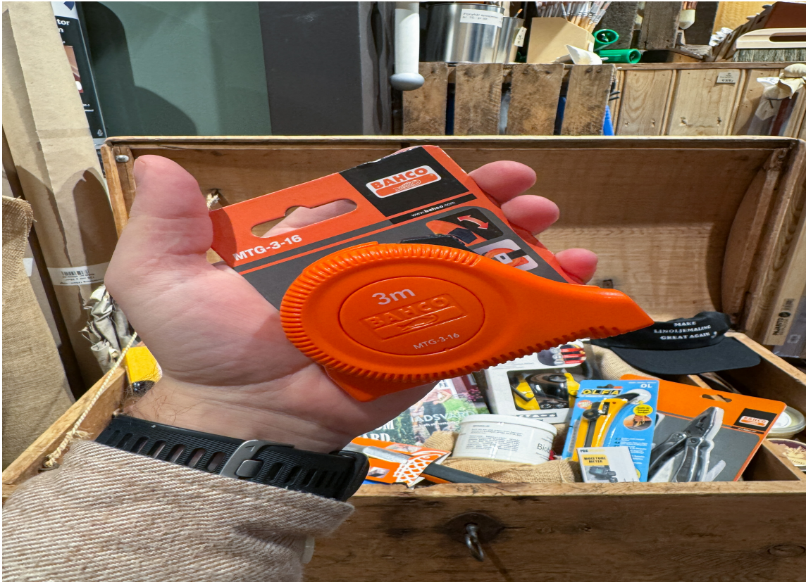
PRESISE MÅL: Et godt målebånd er alltid nyttig å ha liggende hjemme. Det er alltid noe som skal måles.