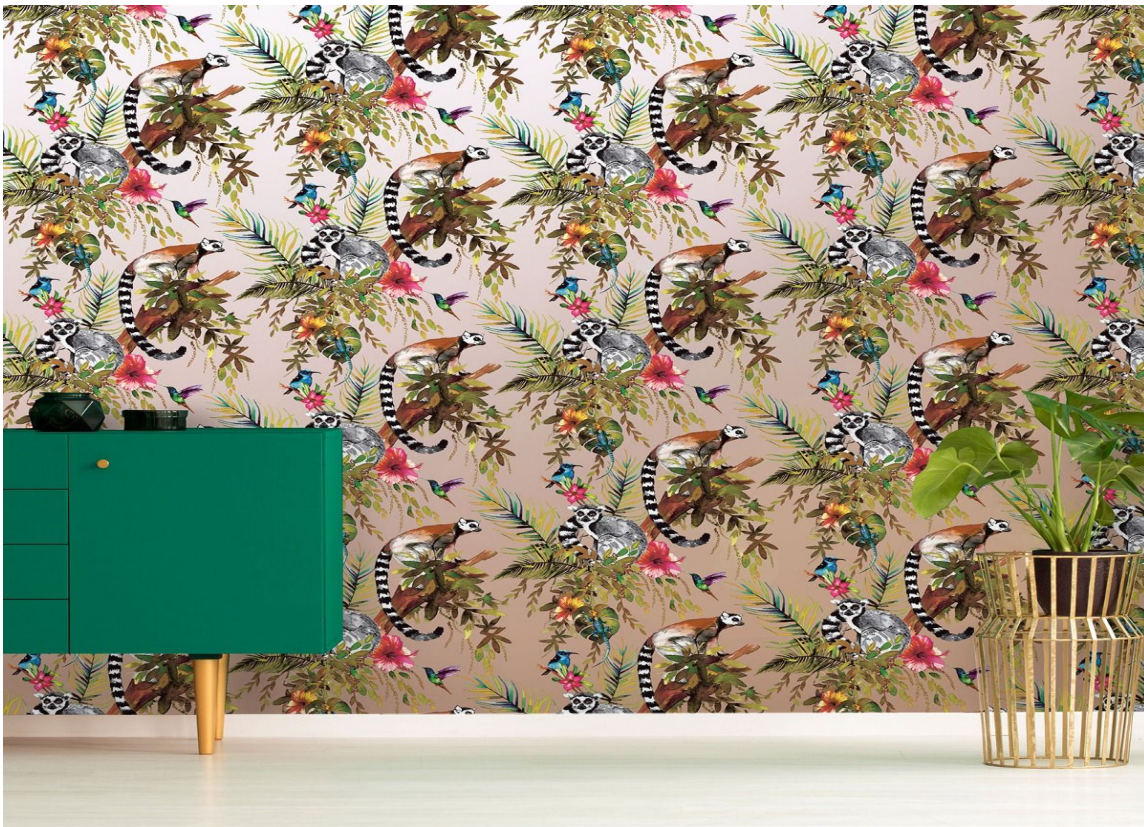
METALLISK TAPET: Holden, Lemur

Tåler ikke vann og må .rengjøres med tørre metoder Ved bruk av mikrofiberklut skal det brukes en type som er beskrevet til denne typen overflater. Følg leverandørens anvisninger.