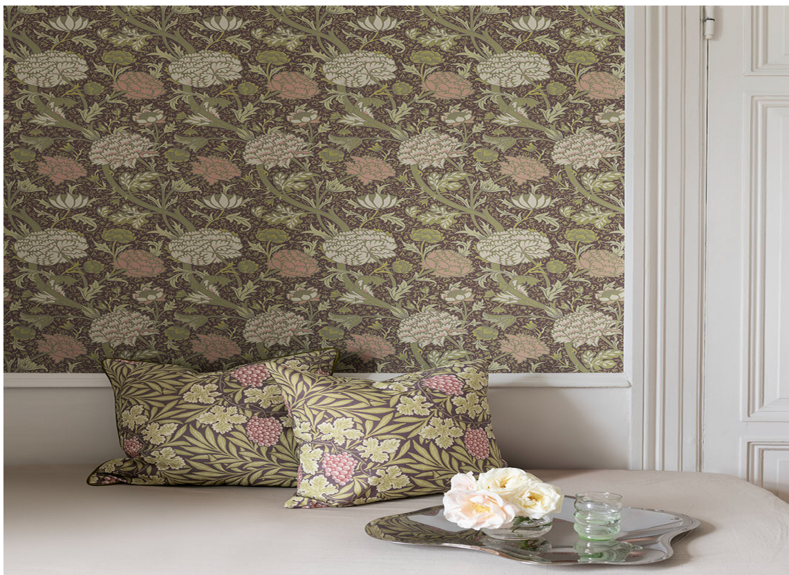
FIBERTAPET: Hidden Treasures .

Vaskbarheten varierer med kvaliteten. De fleste typene er avtørkbare, men kan være ømfintlige for fett.