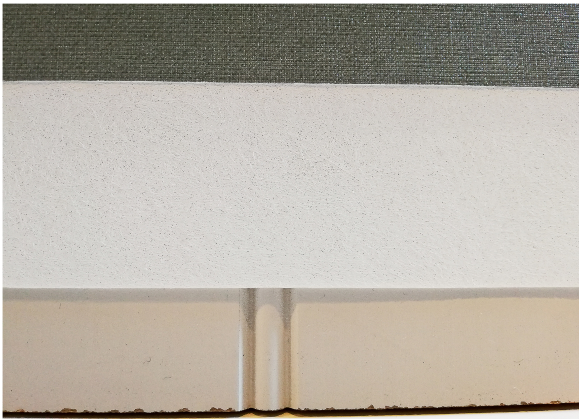
VEGGSLETTER: Roll on Wall