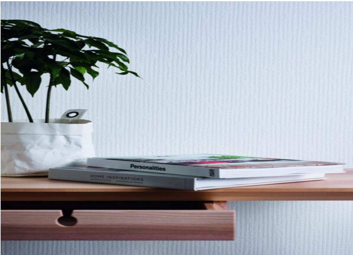
OVERMALBART TAPET: Mal meg, Storeys

Grunning anbefales der lyst tapet settes opp på mørk bakgrunn. Helseparklede vegger skal grunnes for å gi et ensartet underlag med jevnt opptak av lim. Grunningen gjør også at tapetet er lettere å fjerne ved en fremtidig oppussing. Generelt gjelder at produktene skal settes opp kant-i-kant og overmales. Bruk en tapetsletter til å glatte ut og fjerne luftbobler. Overskytende lim tørkes vekk med en fuktig svamp. Følg leverandørens anvisning.