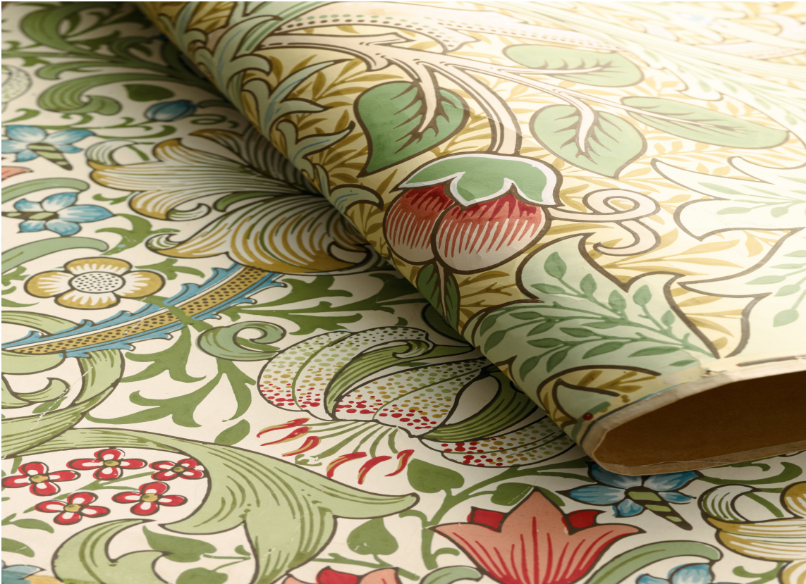
PAPIRTAPET: Morris Golden Lily