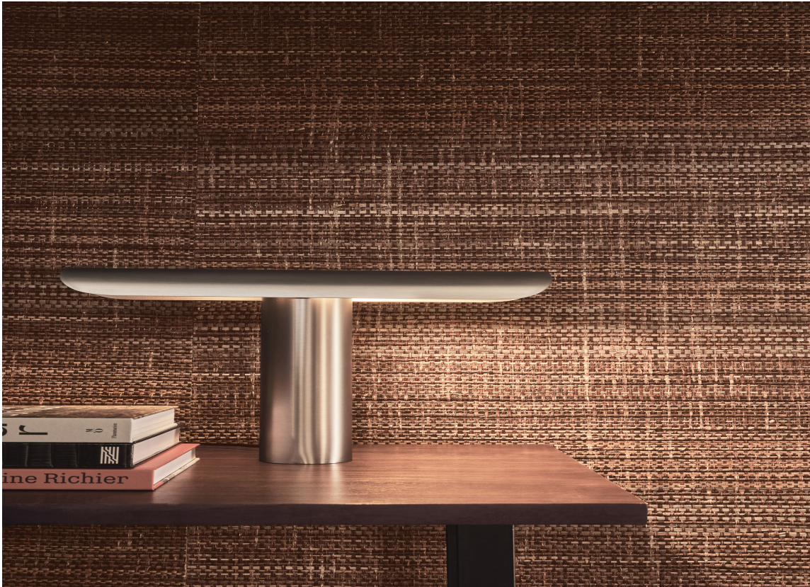
NATURTAPET: Omexco Intuition