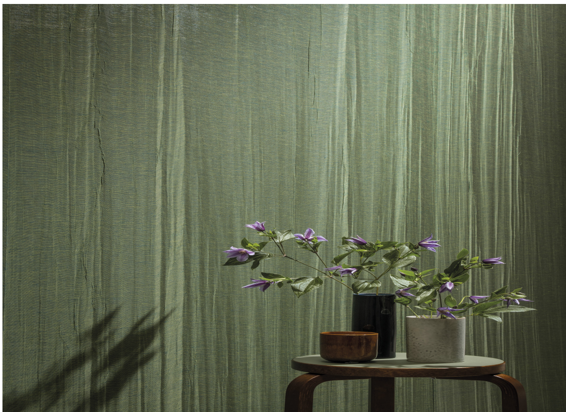
TEKSTILTAPET: Omexco Ode

Det er enkelt å reparere skader i overflaten på tekstiltapet. Bytt hele lengden eller skjær løs en stripe fra tak til gulv der skaden sitter og fell inn en ny stripe. Ta vare på en ekstra tapetrull etter oppsetting.