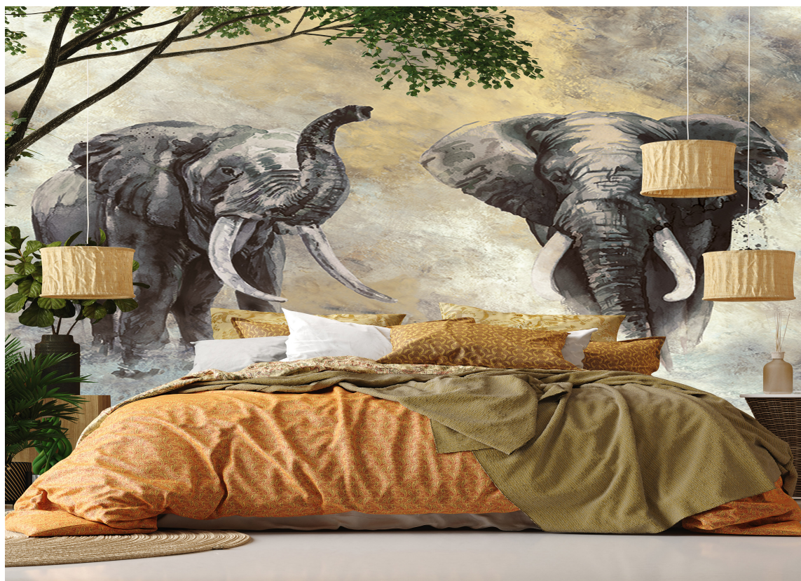
DIGITALT PRINTET/FOTOTAPET: Travertino