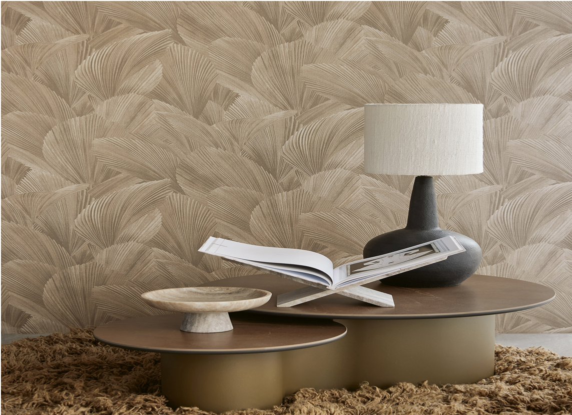
VINYLTAPET: Eijffinger Gilded.