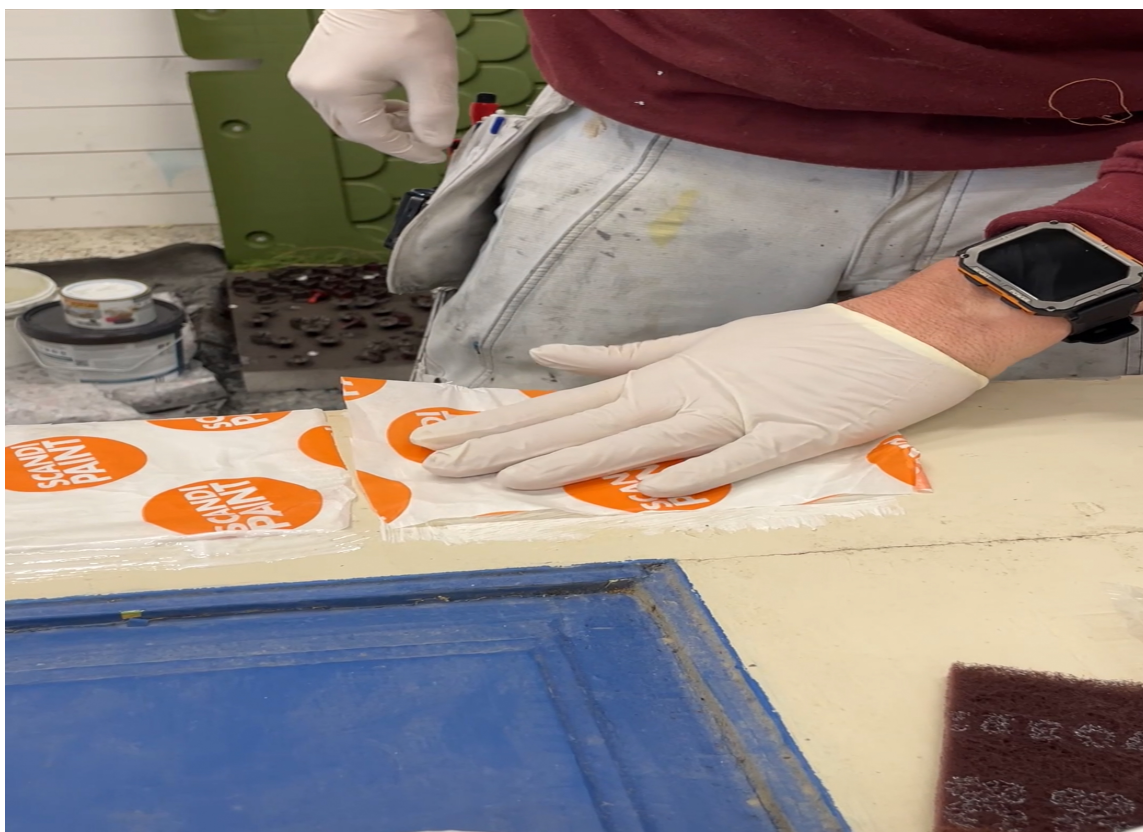
LAMINERT PAPIR: Dette laminerte papirer hjelper å forhindre at malingfjernerer tørker. Om den tørker slutter produktet å virke