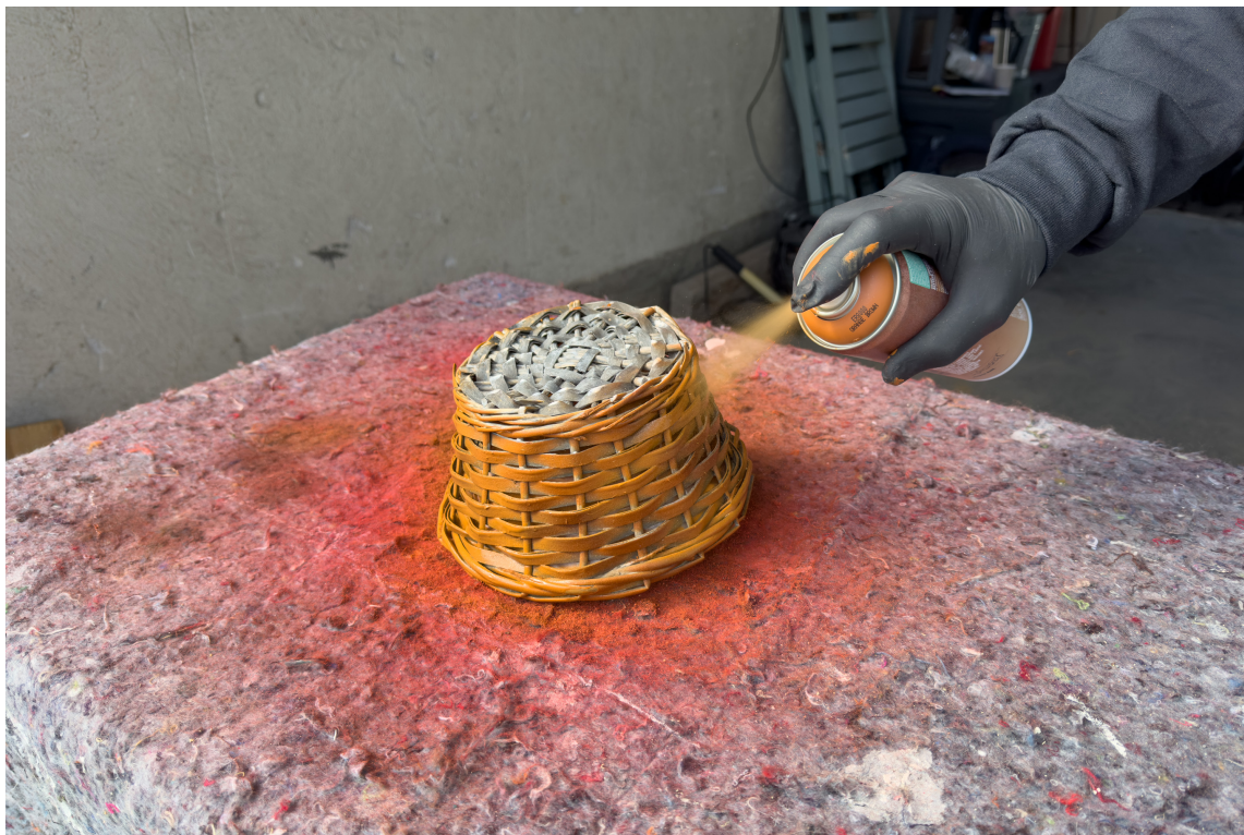
STORT UTVALG: Spraymaling finnes i utallige farger og kule effekter.

De aller fleste har noen gamle blomsterpotter, kurver, bilderammer eller lignende som har sett bedre dager. Istedenfor å kaste dem kan du friske dem opp med spraymaling. Det er fort gjort, og du vil bli overrasket over hvor enkelt det er.