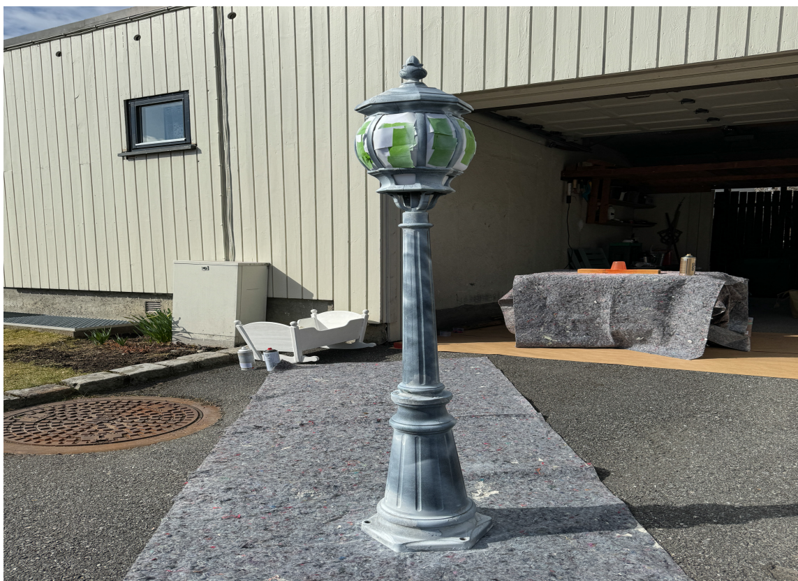
GRUNNET: Før det ble påført et toppstrøk ble utelampen grunnet. Grunningen gir et jevnt og godt underlag, og tetter porer slik at finishen blir jevn og fin.