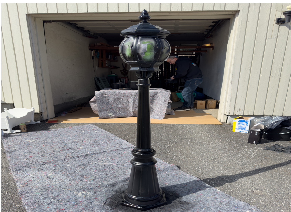
GOD SOM NY: Slik ble utelampen seende ut etter kun en runde med spraymaling. Det går også an å legge på en transparent toplakk i ulike glansgrader for en ekstra fin finish.