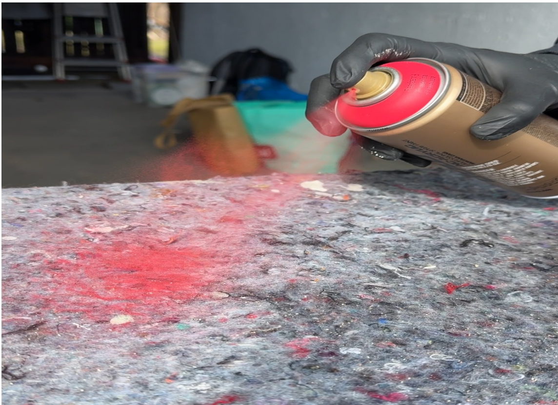
TESTSPRAY: Før du setter i gang er det fint å gjennomføre en liten testspray.