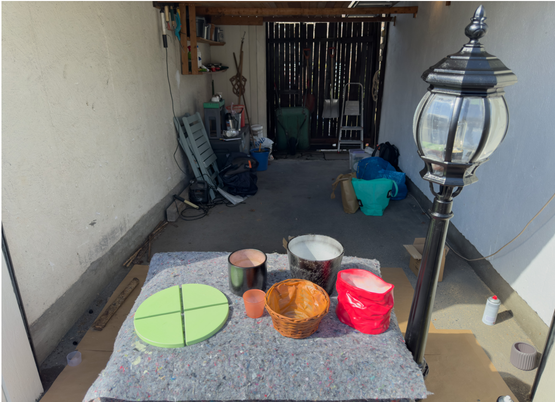
SLUTTRESULTAT: Her er en samling med alt som fikk en runde med spraymaling.