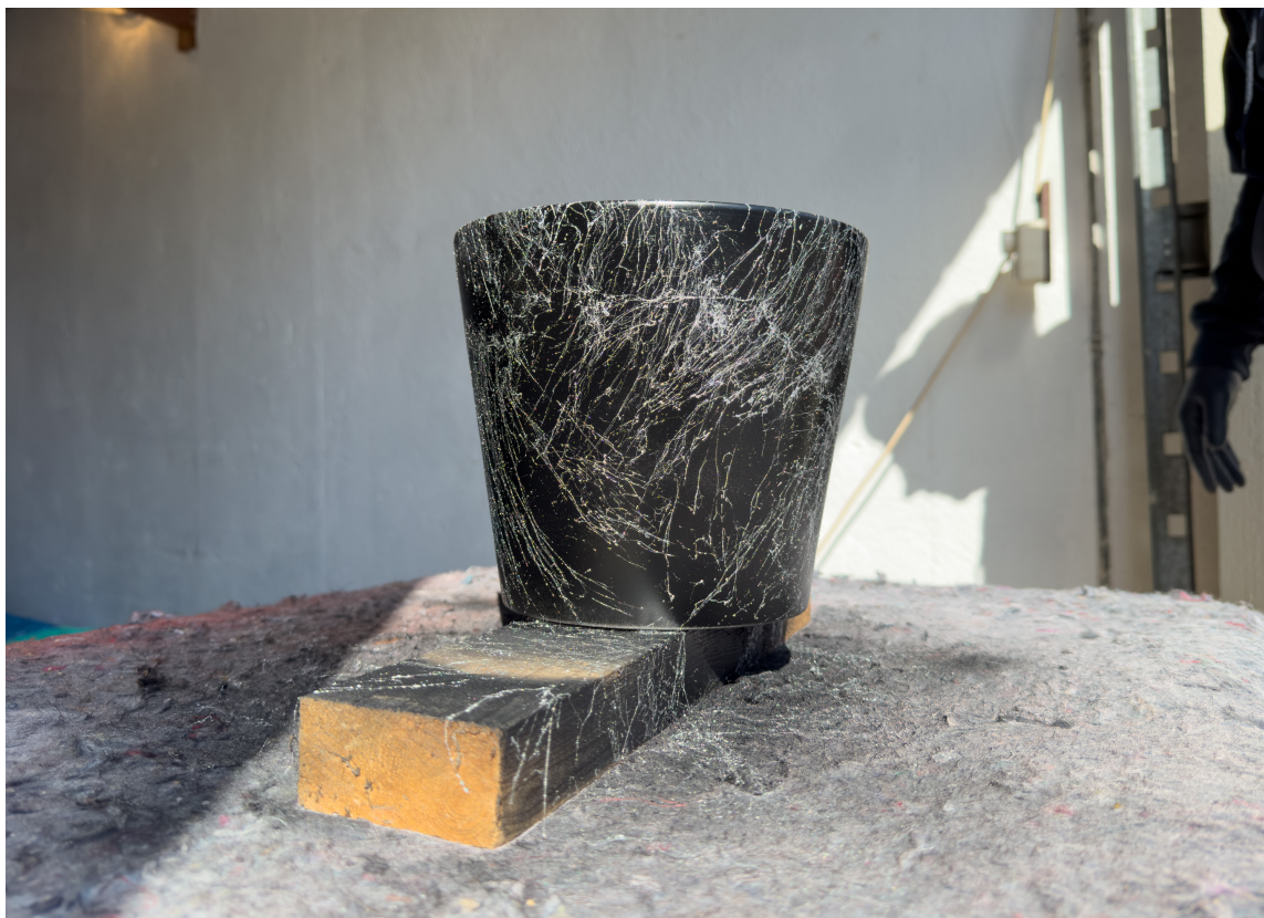
MARMORERING: En effektspray som gir et marmorlignende utseende kan være fin å bruke på gjenstander som allerede er malt.