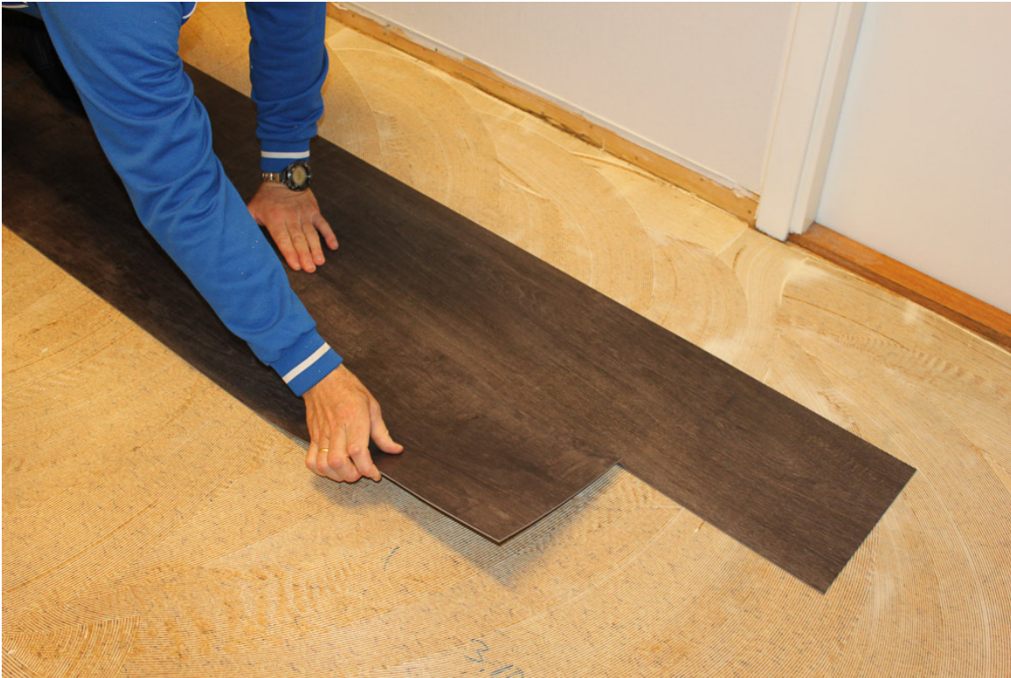
SEN VÅTLIMING: Stavene legges ut når limet har fått riktig vedheft.