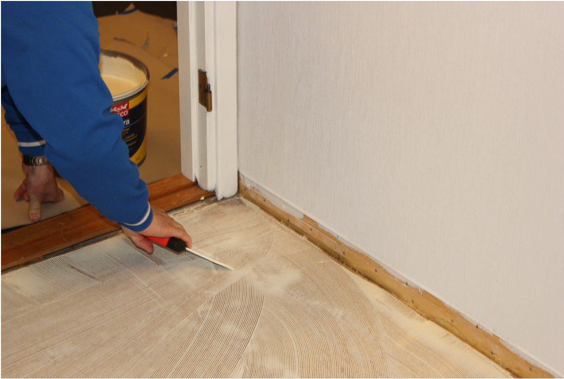
LIMSPREDER: Limet strykes jevnt ut over gulvflaten med en tannsparkel.

På sugende underlag bør LVT legges i så vått lim som mulig, uten at limet «tyter» opp mellom stavene. Rent praktisk vil det si det vi kaller «sen våtliming». Dersom man velger å vente for lenge med å legge, risikerer man at limet har nådd heftlimstadiet. Og da kan gulvbelegget bli liggende ovenpå limrillene uten at disse knuses.