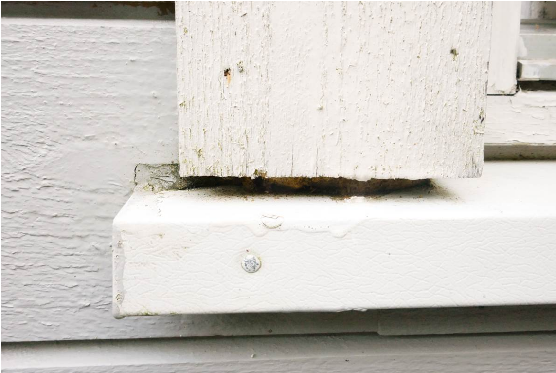
UTSATT: Noen deler av vinduet vil være mer utsatt for fuktskader, slik som denne overgangen mellom vannbrettet og resten av listverket.