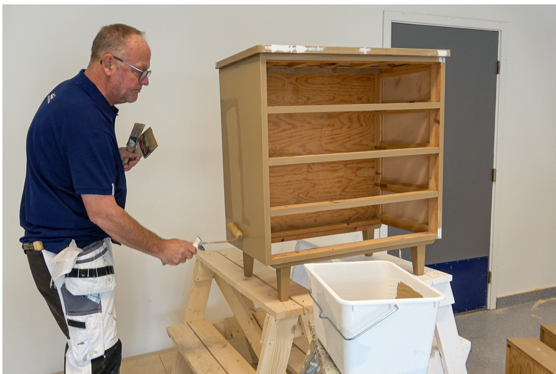
SMART: En god arbeidsstilling er aldri feil. Sett gjerne kommoden opp i høyden, da ser du godt hva du jobber med.