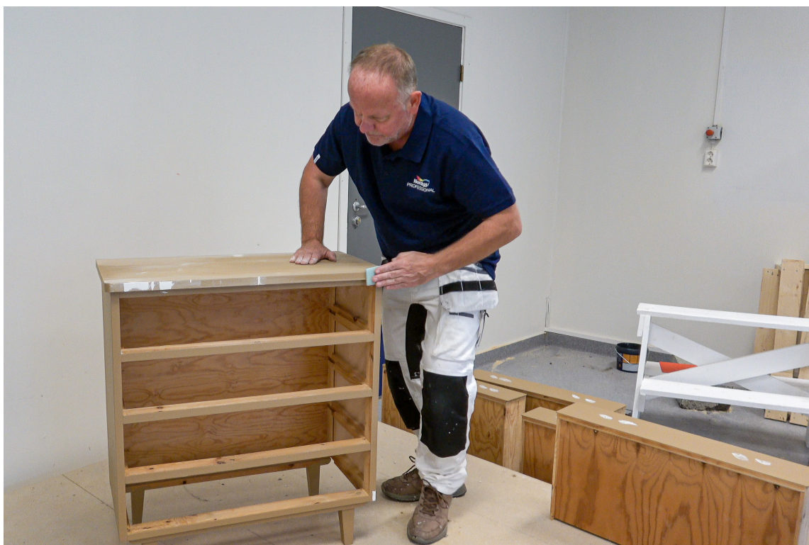
GRUNNARBEID: Godt forberedt er halvveis fullført. Du bør vaske, grunne og sparkle deg ferdig før du begynner med topstrøket.