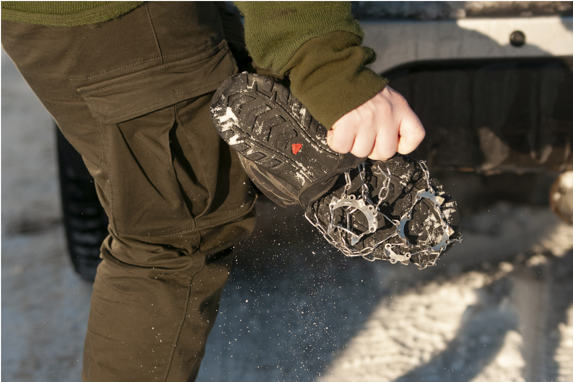
TA DE AV: Piggene er som spiker, og fungerer utmerket utendørs. Husk å ta dem av før du trækker inn i lokaler - ha piggene av når du er inne.

– Jeg mener at det er mangel på folkeskikk og at det nå er på tide at gamle som unge tar grep og skjerper seg. Dette er regelrett hæverk på annenmanns eiendom, jeg tviler på at de ville gått med brodder og pigger inne på parketten i egen stue, understreker han.