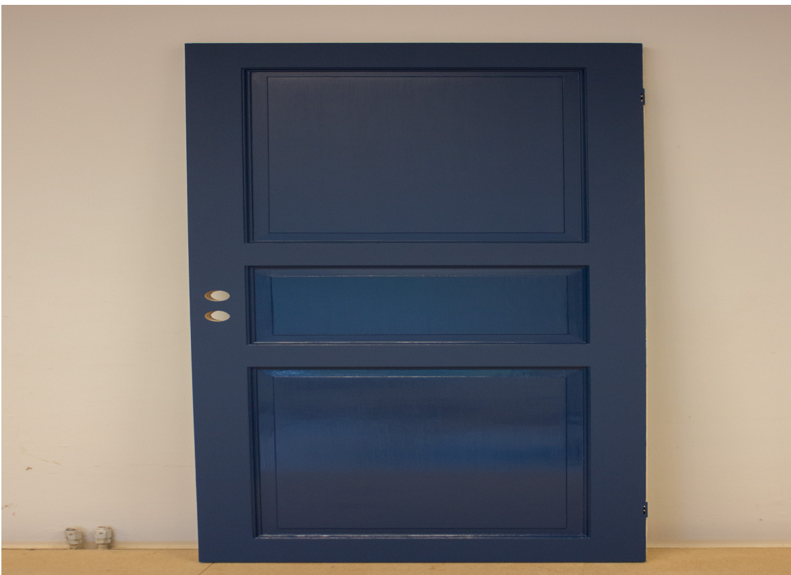
ETTER: Og slik ble døren seende ut når vi var ferdige.