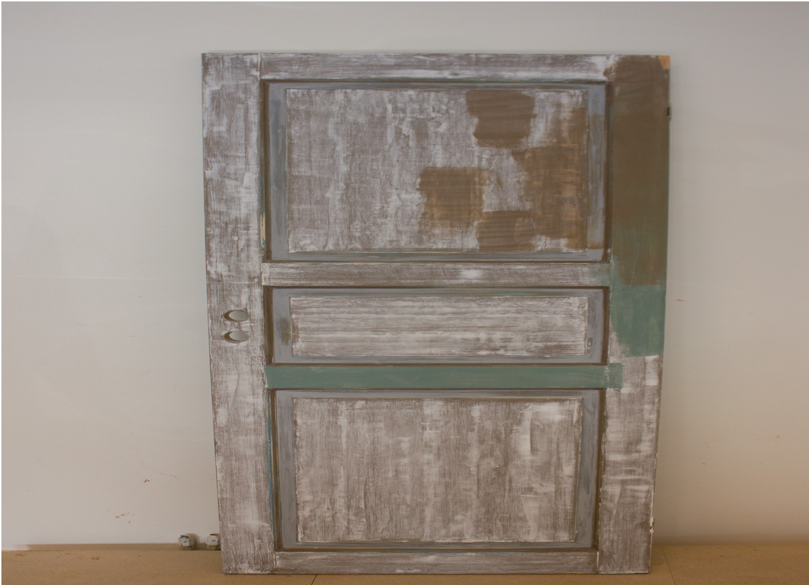
FØR: Slik så døren ut før vi satt i gang.