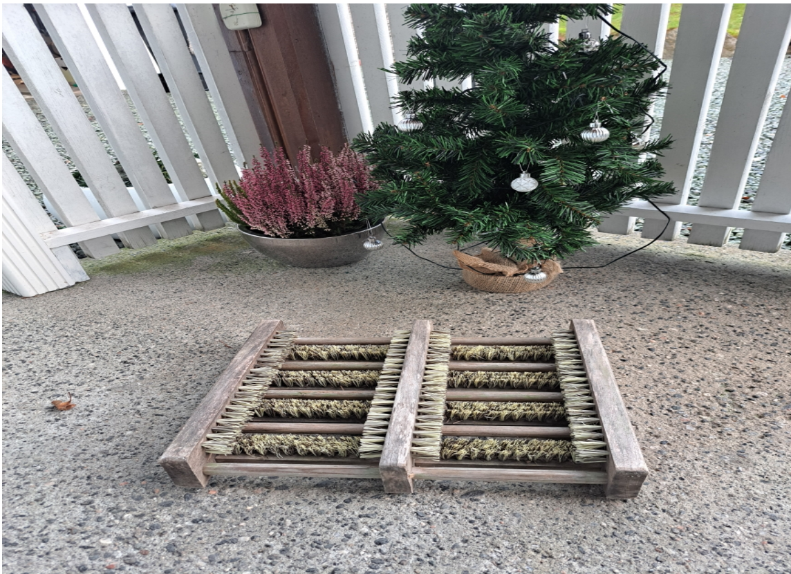
BØRSTE: Med en skobørste ved inngangspartiet får du rensset skoene bedre – spesielt nyttig på våte vinterdager.