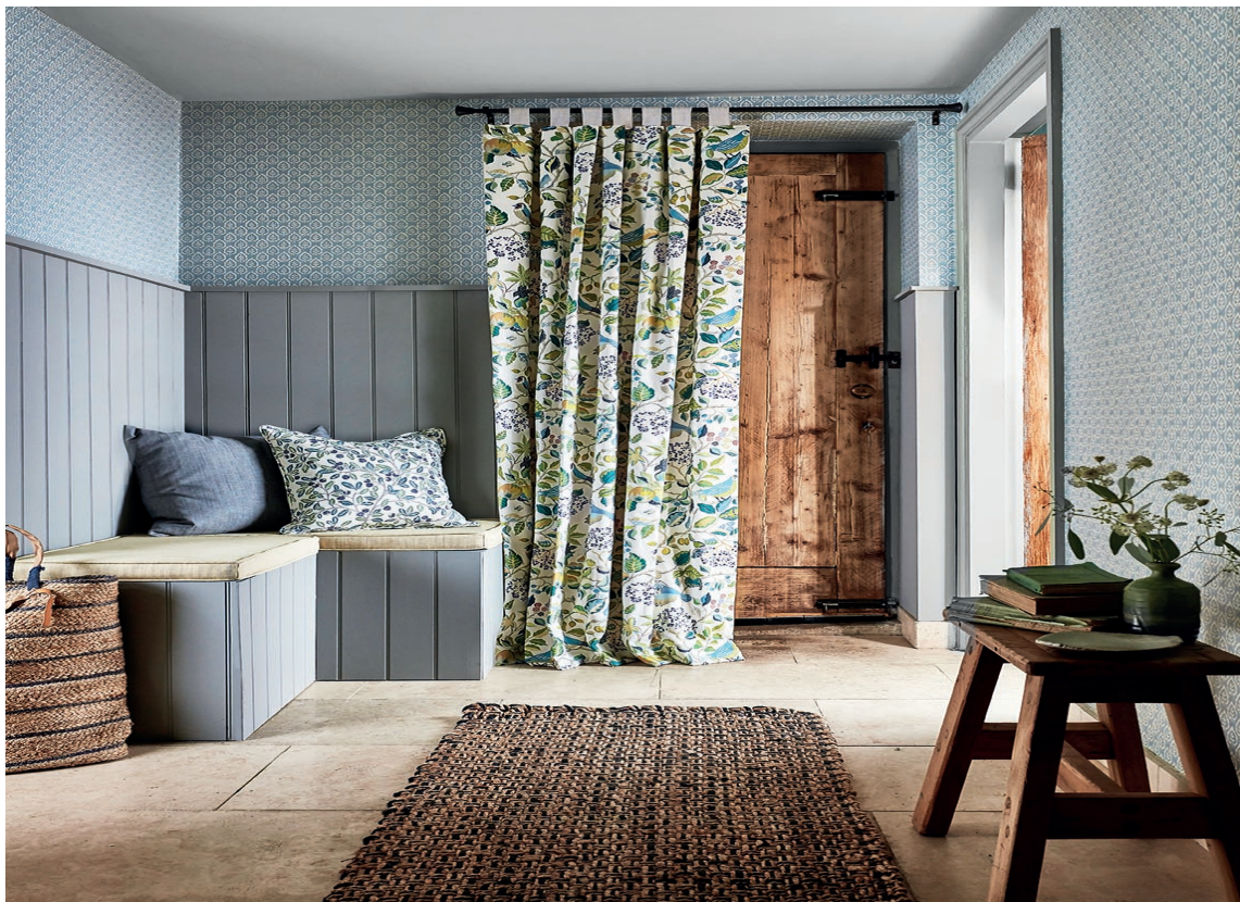
HELT NED: En god gardin går hele veien ned til gulvet, spesielt om hensikten er å sperre for trekk og isolere.

Gardiner kan også brukes andre steder enn foran vinduet. En døråpning eller en ytterdør som føles trekkfull kan skjermes med gardin i et kraftigere tekstil. Slik kan du holde varmen i soner og unngå unødvendig temperaturforskjell mellom rom.