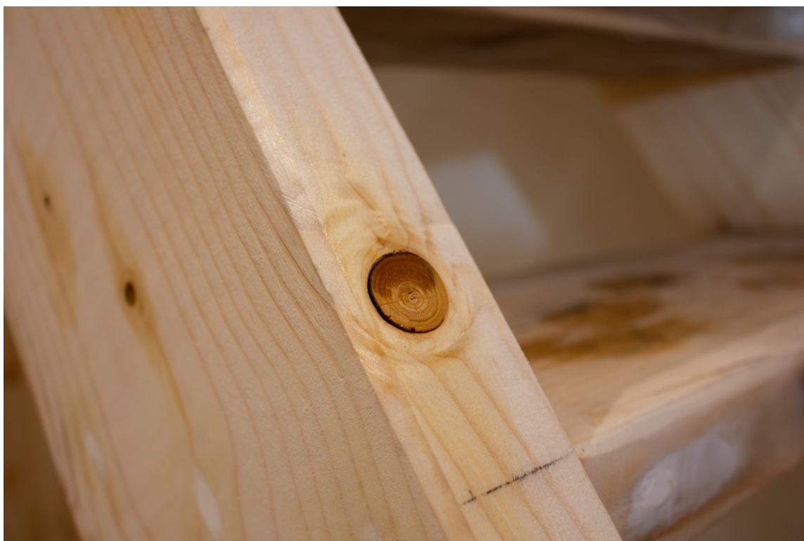
KVISTLAKK: Det kreves lite forarbeid når du maler med eggoljetempera. Det stilles ikke krav til grunning, men det anbefales å kvistlakkere om malingen skal brukes på ubehandlet panel eller annet treverk med mye kvist.