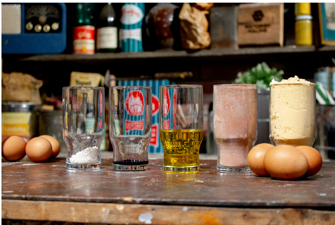
SELVLAGET MALING: Om du ønsker en litt mer personlig maling, så kan du lage eggoljetempera selv med linolje og egne økologiske egg som du blandes med Historisk Malings egen pigmentblanding.