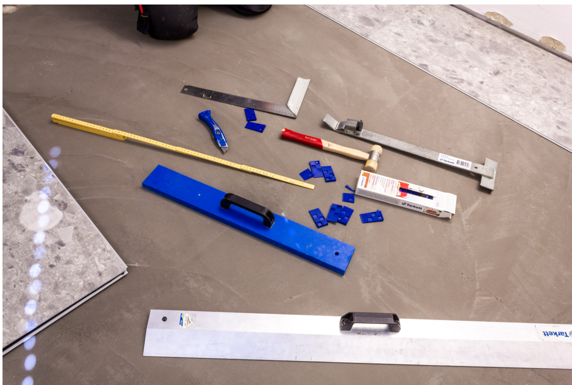
UTSTYR: Det er ikke så mye utstyr og verktøy som skal til når du skal legge teppeflis og klikkvinyll.