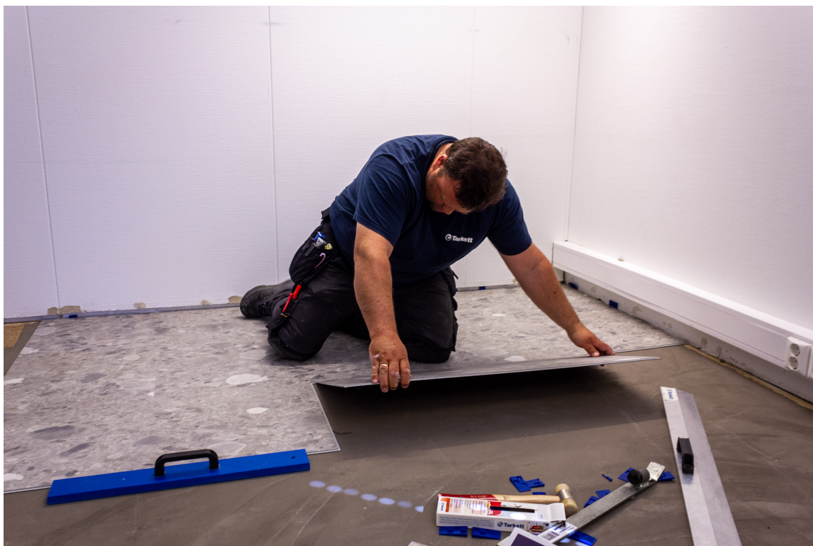
KLIKKVINYL: Avstandsklosser er viktig for å opprettholde en avstand på 8-10 millimeter til veggen.

– Du må også huske å legge avstandskiler mellom veggen og klikkvinylen. Det er for å opprettholde en avstand på 8-10 millimeter langs veggene du skal legge inntil. Avstandsklossene skal du fjerne når du er ferdig å legge gulvet. Det er fordi det skal kunne bevege seg fritt, da det krymper og utvider seg avhengig av temperatur. Det er det vi kaller et flytende gulv, legger Wear til.