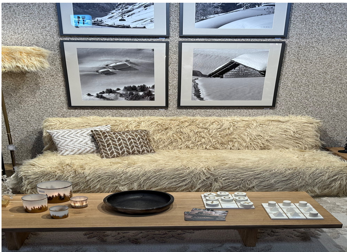
LODDENT: Definitivt noe som kan gå rett inn i norske hytter. Frem med ull, pels og myke tekstiler i lyse naturfarger.