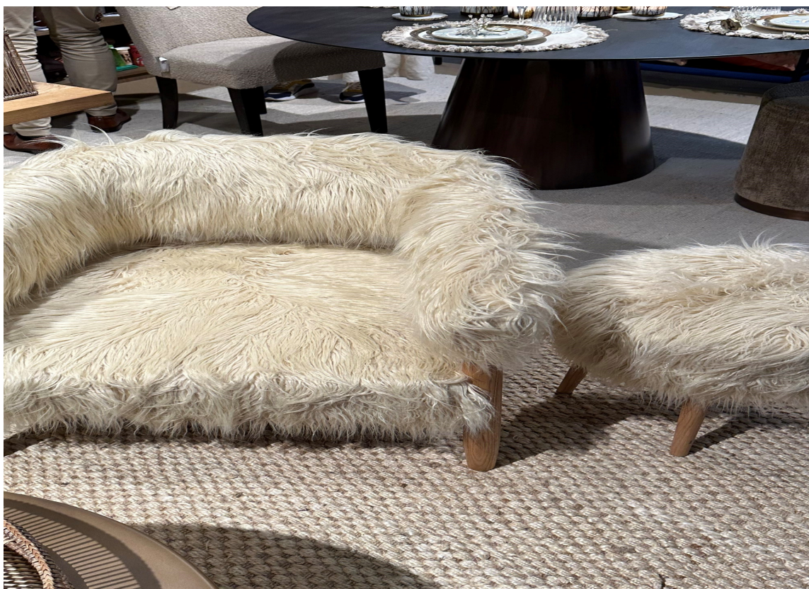
PELS: Fryse kommer vi i hvert fall ikke til å gjøre. Kjekt når strømmen er dyr!