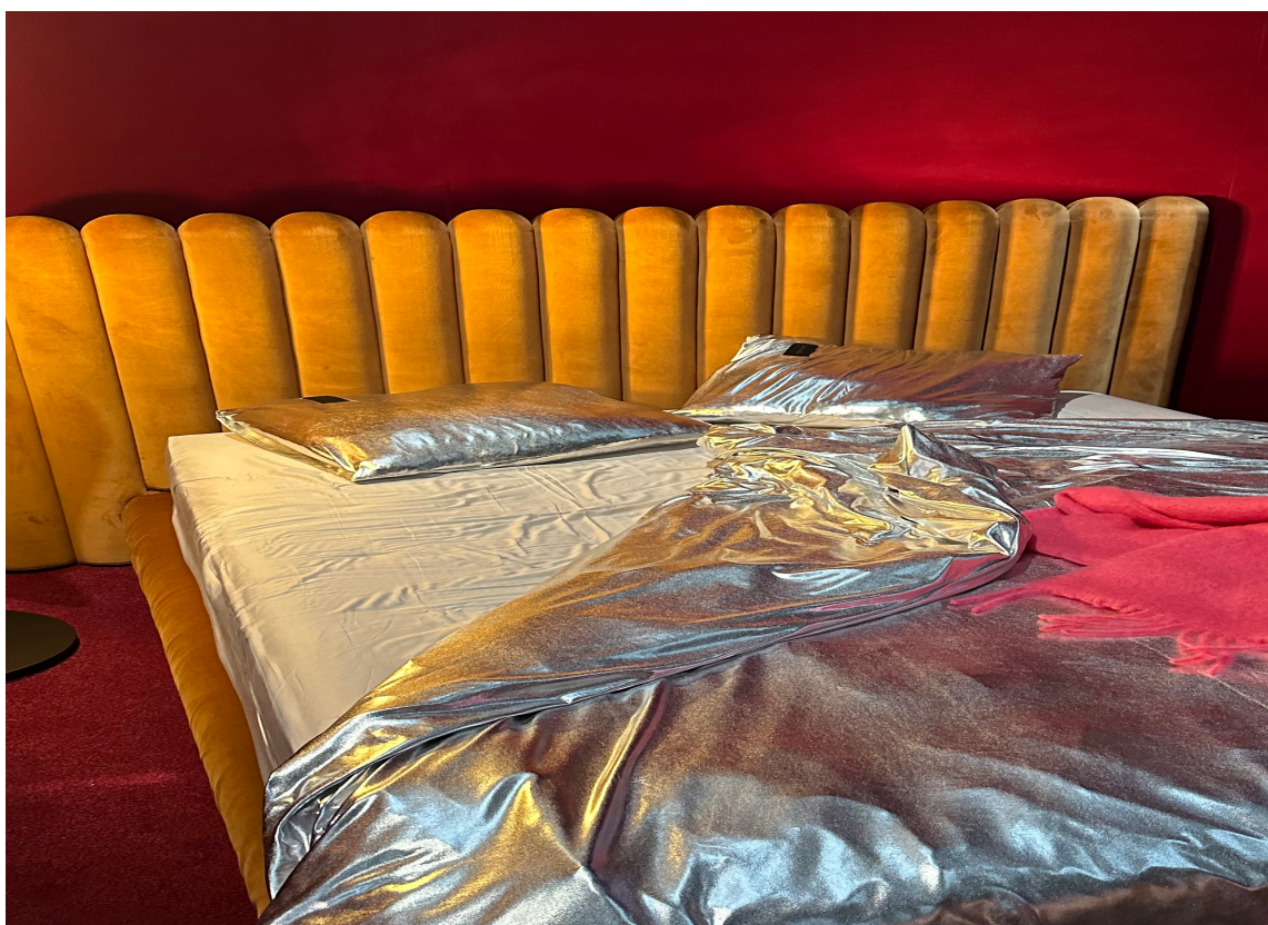
SØLV: Hvis du ikke sliter med nattesvette, kan kanskje sølvsengetøy være noe å prøve?

Farget glass og mønstrete asjetter så vi overalt. Alt kombinert uten lover og regler for mix og match. Stilen er blanding av gammelt og nytt, så alt er lov.