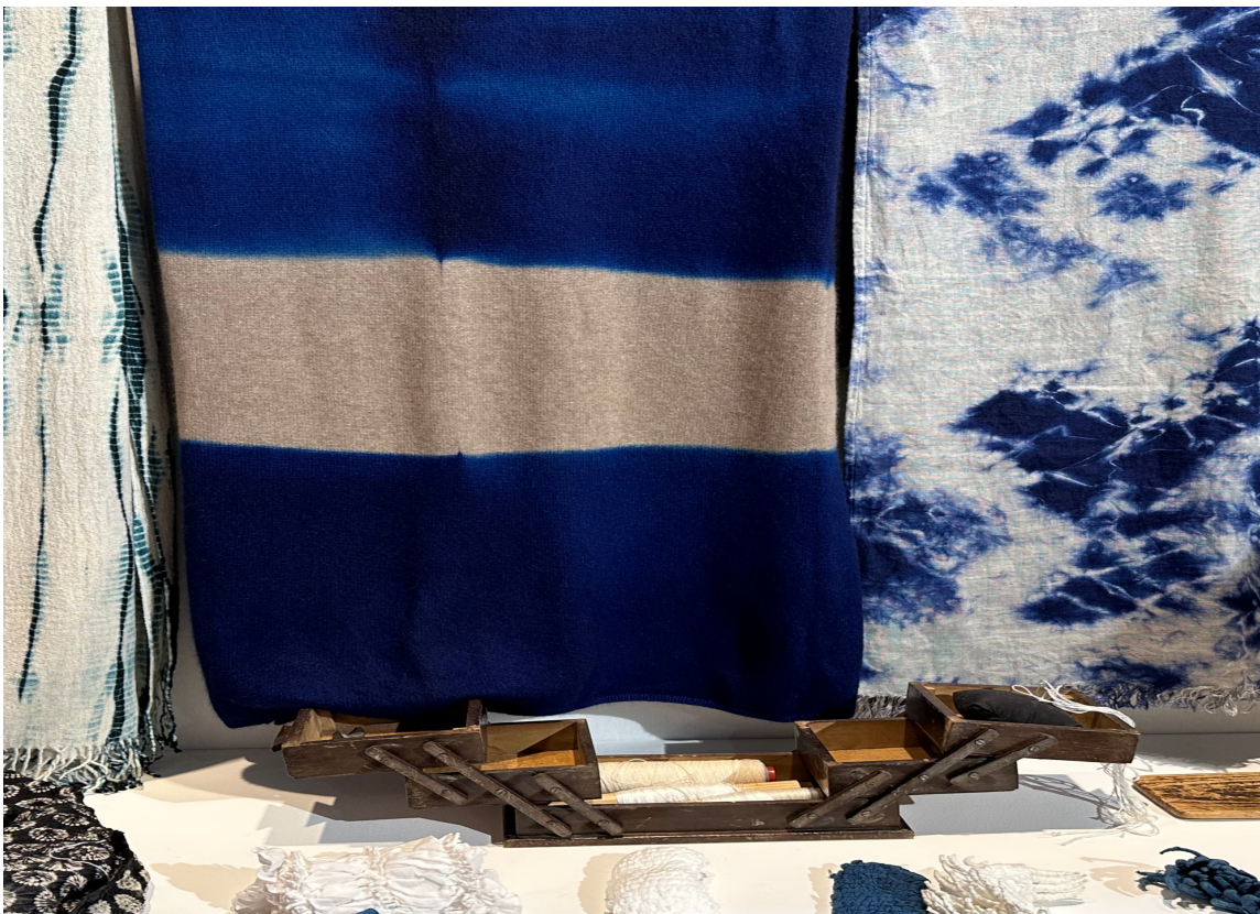
BATIKK: Koboltblått holder fortsatt stand og det var mye batikk å se, gjerne som her i kombinasjon med andre mønstre.