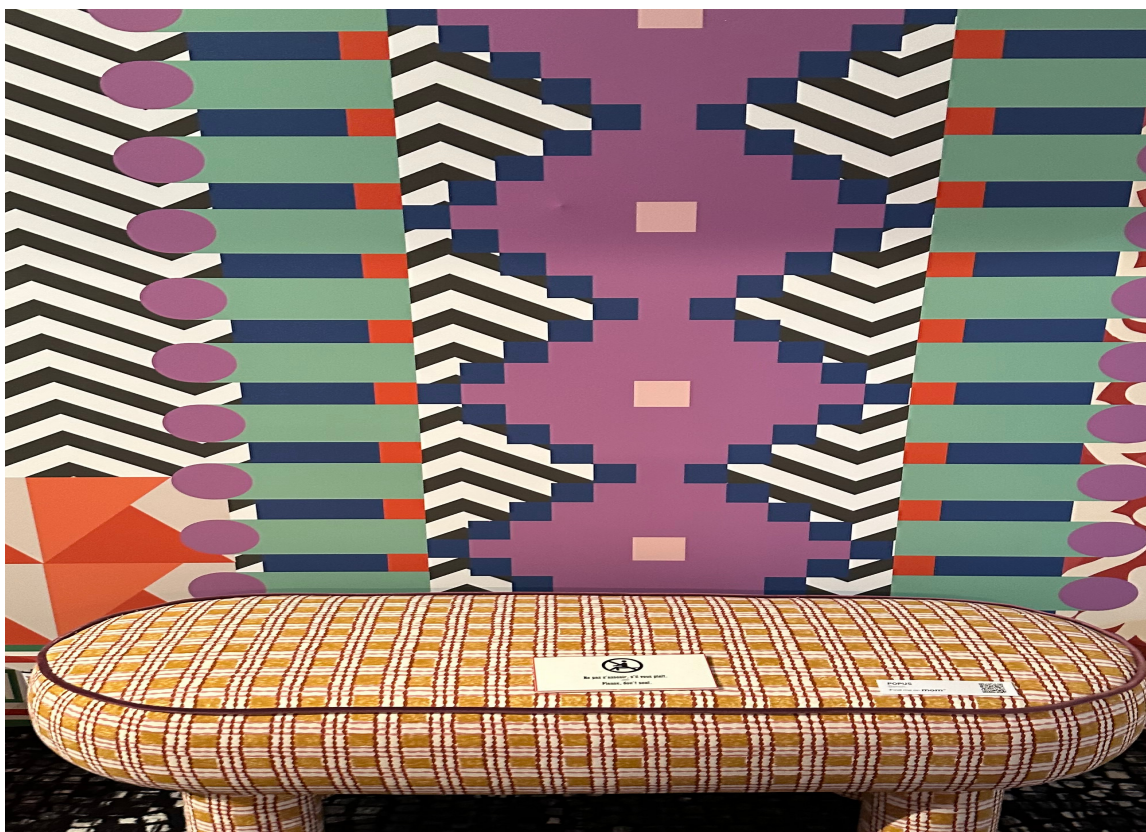
MØNSTER PÅ MØNSTER: Ingen regler. Jo mer mønster jo bedre!