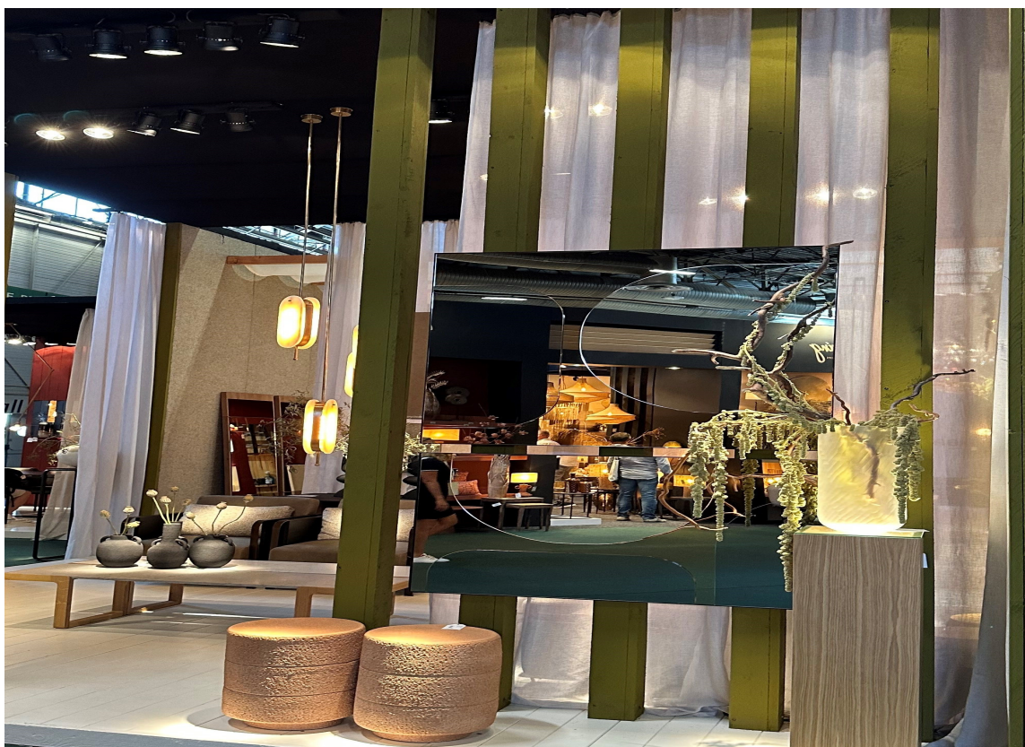
GRØNT: Definitivt en av hovedfargene. Både denne med mye gult i, flaskegrønn og pastellgrønn.