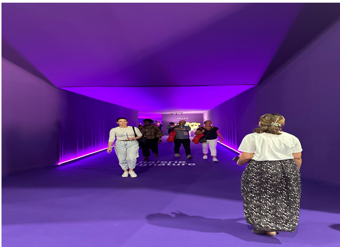
LILLA OVERALT: Denne lillafargen gikk igjen overalt. Både på interiørmessen og på klær i butikkene.

Mye farger der altså. Hvis farger ikke er din greie, kan det kanskje være et alternativ å ha alt i lyse kremaktige nyanser? Det var nemlig også en tendens – men da bare det og ingen andre farger involvert. Hele rom i bare én farge, uavhengig av farge, var også generelt hyppig representert.