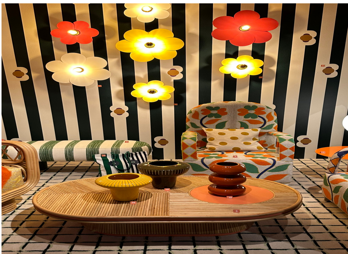
MØNSTRETE: Stripete tapet og masse mønster også her. Litt bestemor-vibber og litt tegneserie kanskje?