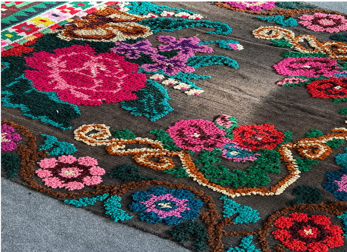
ROSEKELIM: Tepper med rosemønster var å se overalt i Paris. Ikke bare på messen, men også i butikker og på klær. Rosekeliminspo er hot!