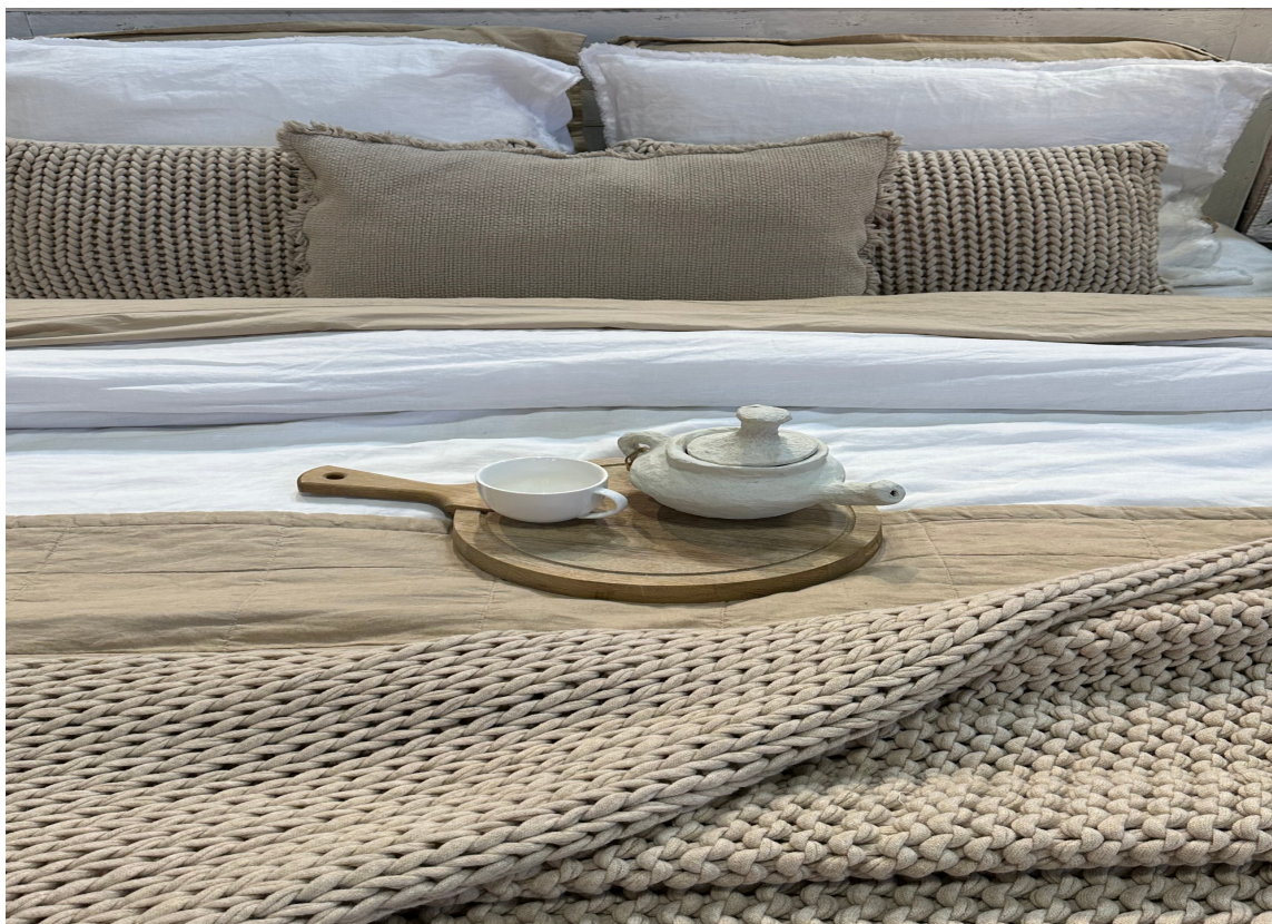
LYST PÅ LYST: Hele rom som er lyse er også en klar tendens. Og som her på sengetøyet. Lag på lag med kremfarget og beige og ulik taktilitet på tekstilene.