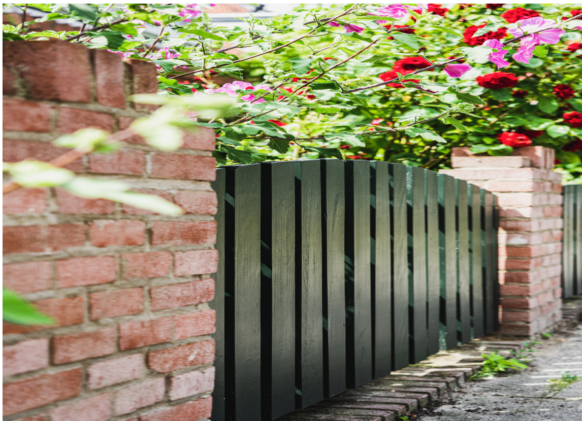
GRØNT: Grønt er en harmonisk og sjarmerende farge som kler hagen godt.