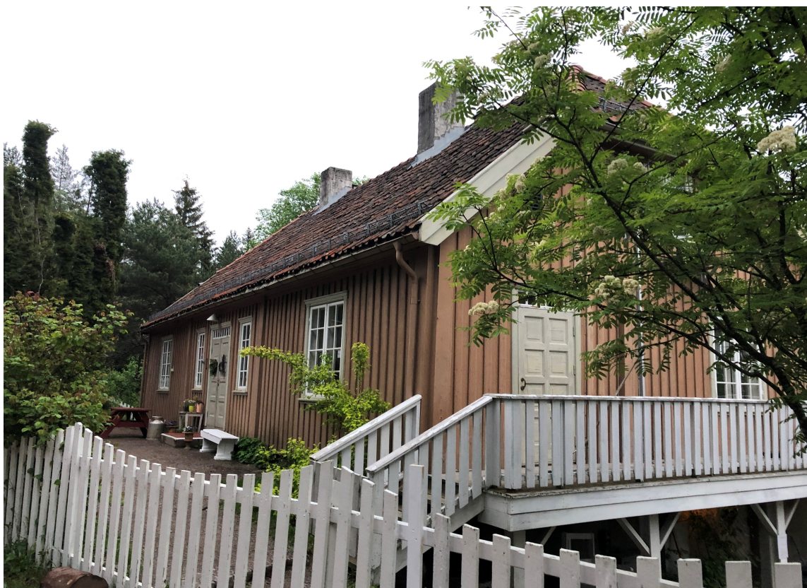
DRAMMEN: Dette huset i Drammen har også valgt hvitt stakitt, selvom husfargen er en annen. Hvitt passer inn nesten overalt.