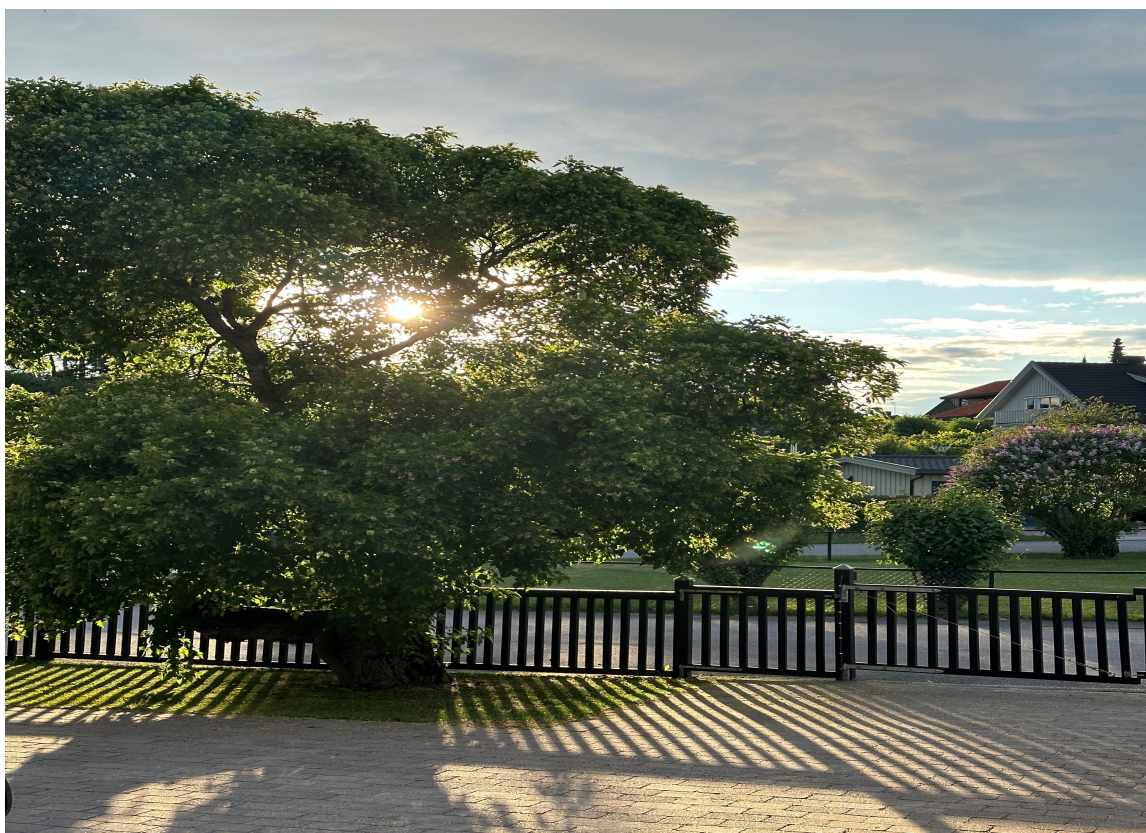
SØMLØST: Her er porten en nesten usynlig del av gjerdet.