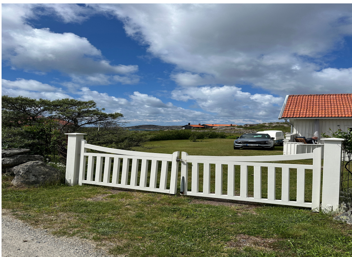
NATURTOMT: Beliggenhet kan være et godt utgangspunkt for å klare å ta et valg når det kommer til stil på porten og gjerdet. Har du mye natur rundt deg, er det på landet eller på fjellet?