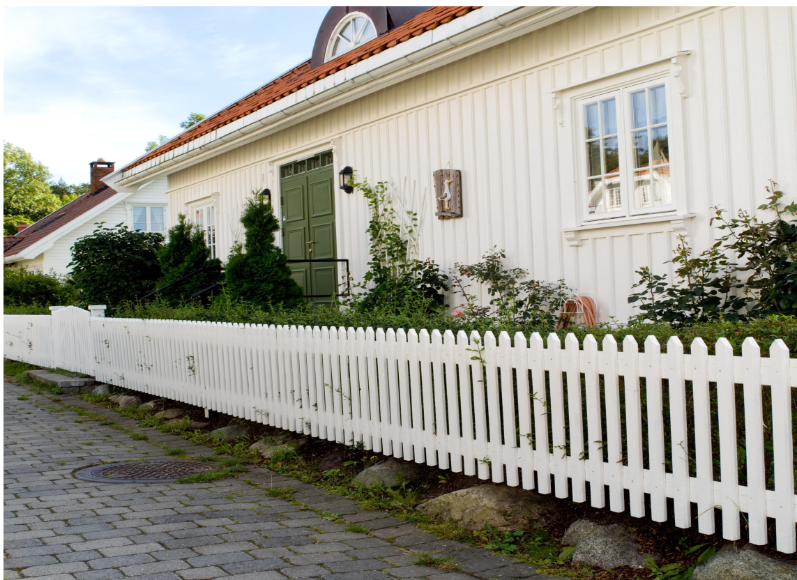
KLASSISK: Et hvitt enkelt stakittgjerde er aldri feil og den mest klassiske fargen.