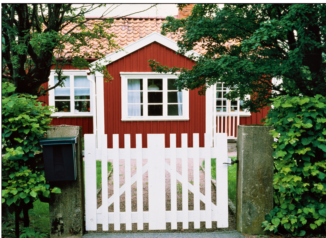
TRADISJONSRIKT: Dette har vi sett før og mange av oss har varme følelser for denne fargekombinasjonen.