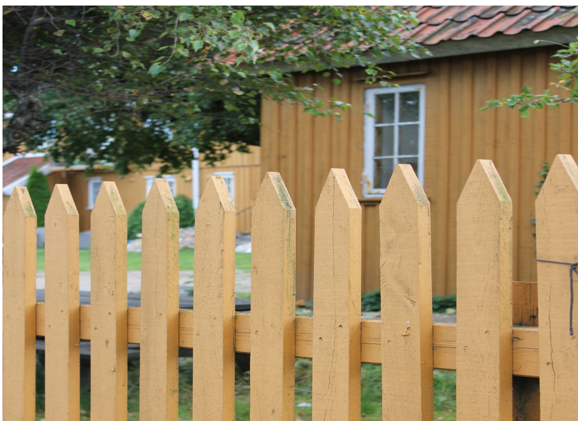
SAMME FARGE: Her har man valgt å ha samme farge på gjerdet som på huset.