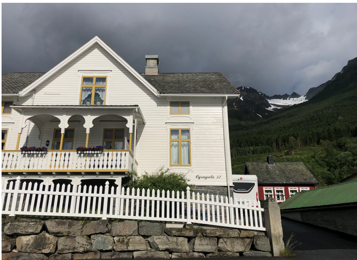
VESTLANDET: Til et tradisjonelt trehus på Vestlandet hører det med et gjerde. Uten hadde det føltes tomt og for åpent.