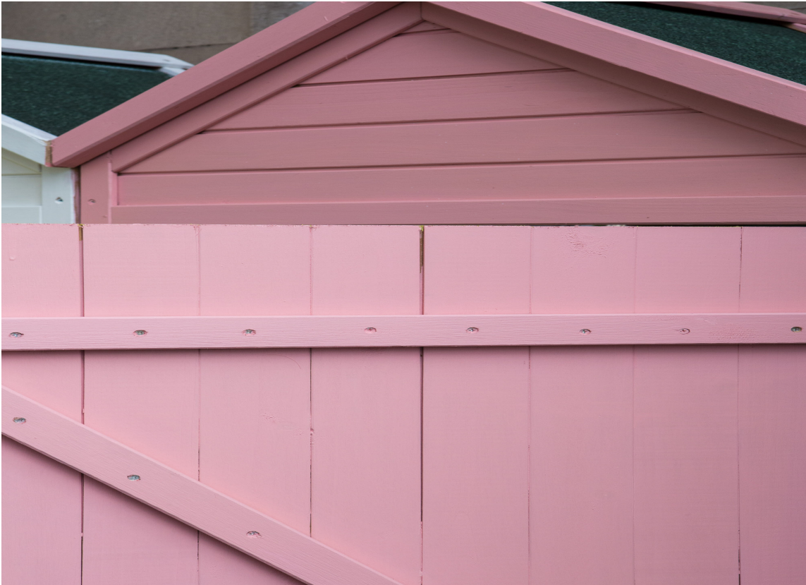
PIPPi: En morsom farge som gir assosiasjoner til Pippi.