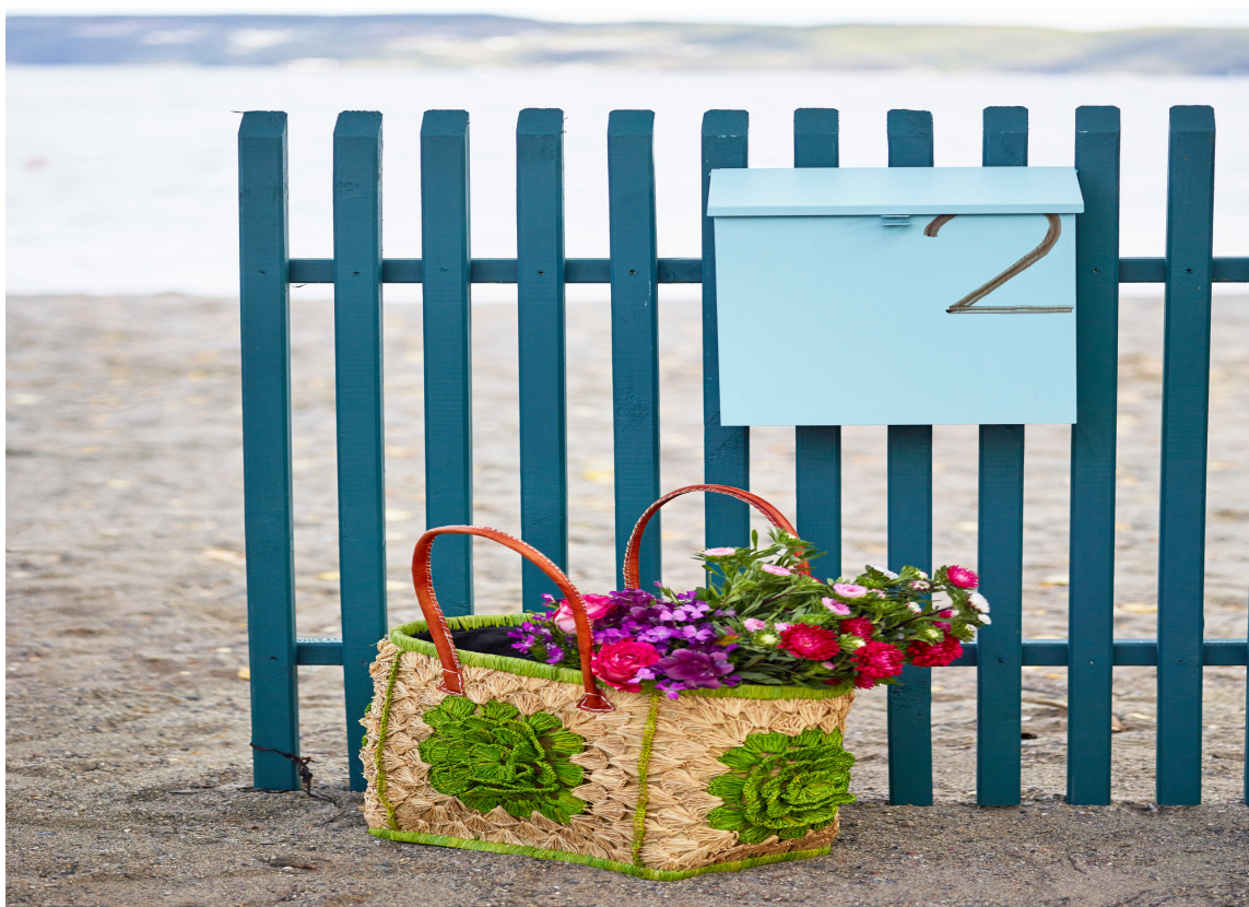
BLÅTT: En farge som ikke brukes så ofte her i Norge. I Sverige er det mer å se av den. Riktig blåfarge kan fungere riktig så fint.