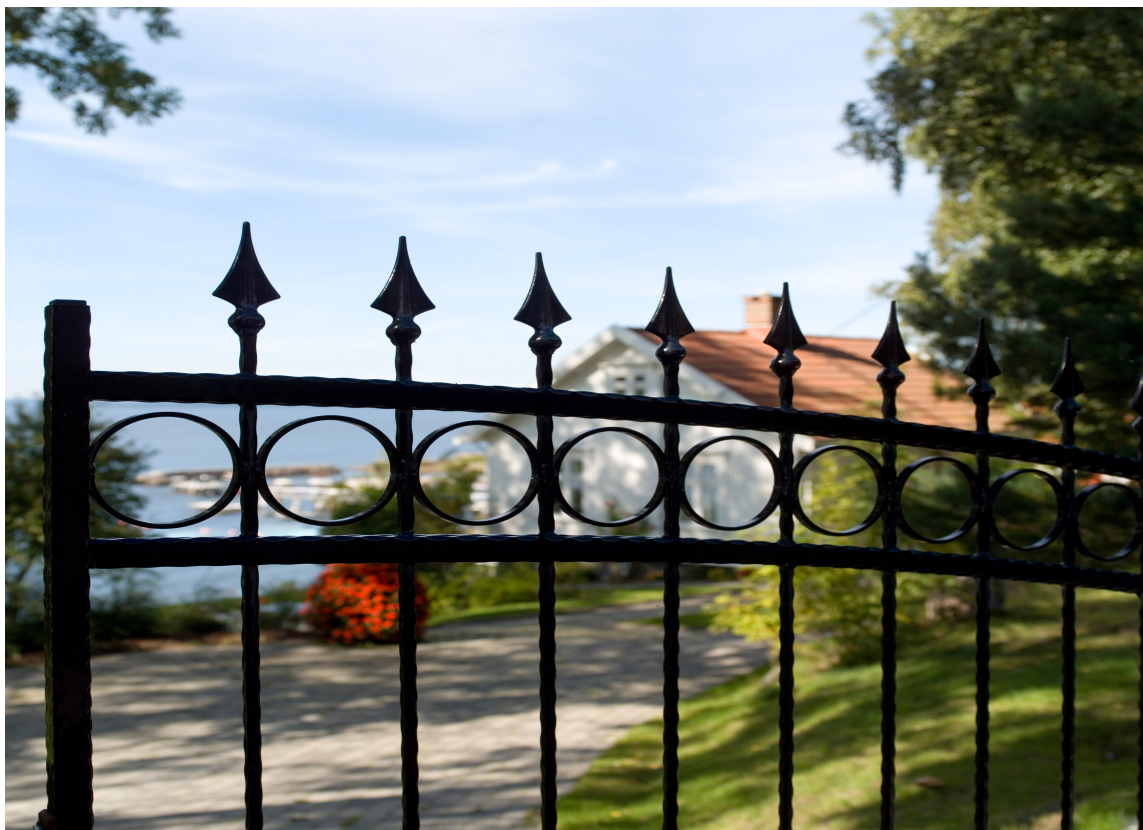
SMIJERN: Vil du slippe så mye vedlikehold er smijern et alternativ.