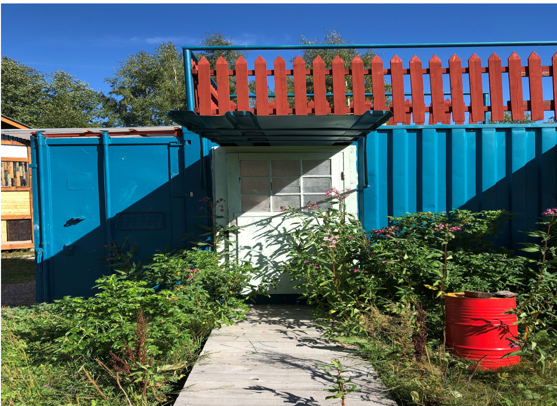
FLERFARGET MORO: Det er lov å ha det gøy og her har man virkelig brukt farger og latt kreativiteten blomstre.