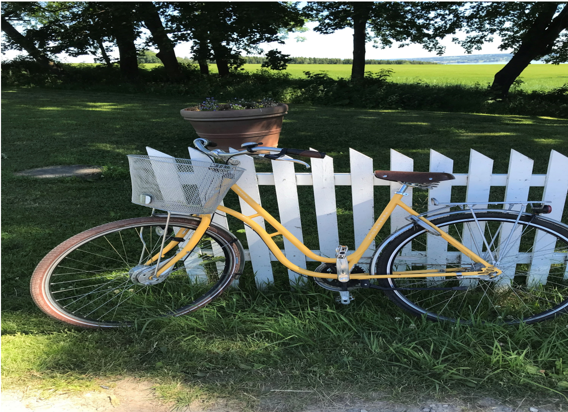
LANDLIG SJARM: Hvem synes vel ikke dette er et sjarmerende skue?

For mange er det et ønske at hagen skal være som en romantisk oase. Som å gå inn i en annen verden. Har du en port med klatrende roser, eller en nostalgisk sykkel som står inntil et gjerde, er du godt på vei.