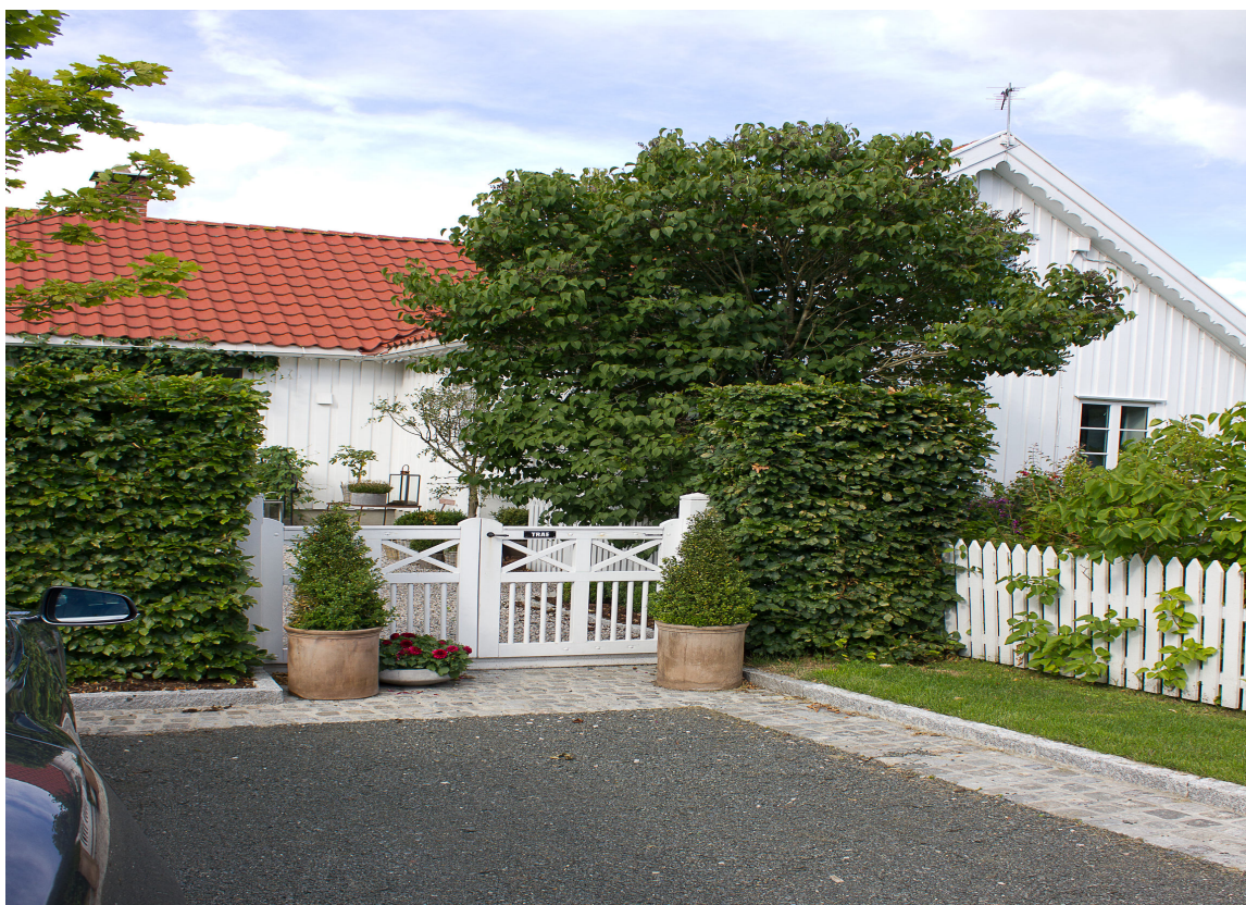
HARMONI: En usedvanlig vakker port som sier "Velkommen inn!" med hele seg. Når den er forseggjort som her, fungerer den som et smykke og det ser ut som det bor hyggelige mennesker der.