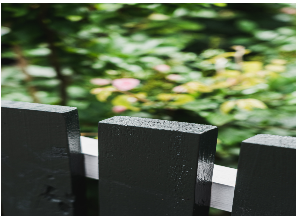
SVART: Har du et svart hus er det ikke feil med svart gjerde. Husk endeveden -den må også males!