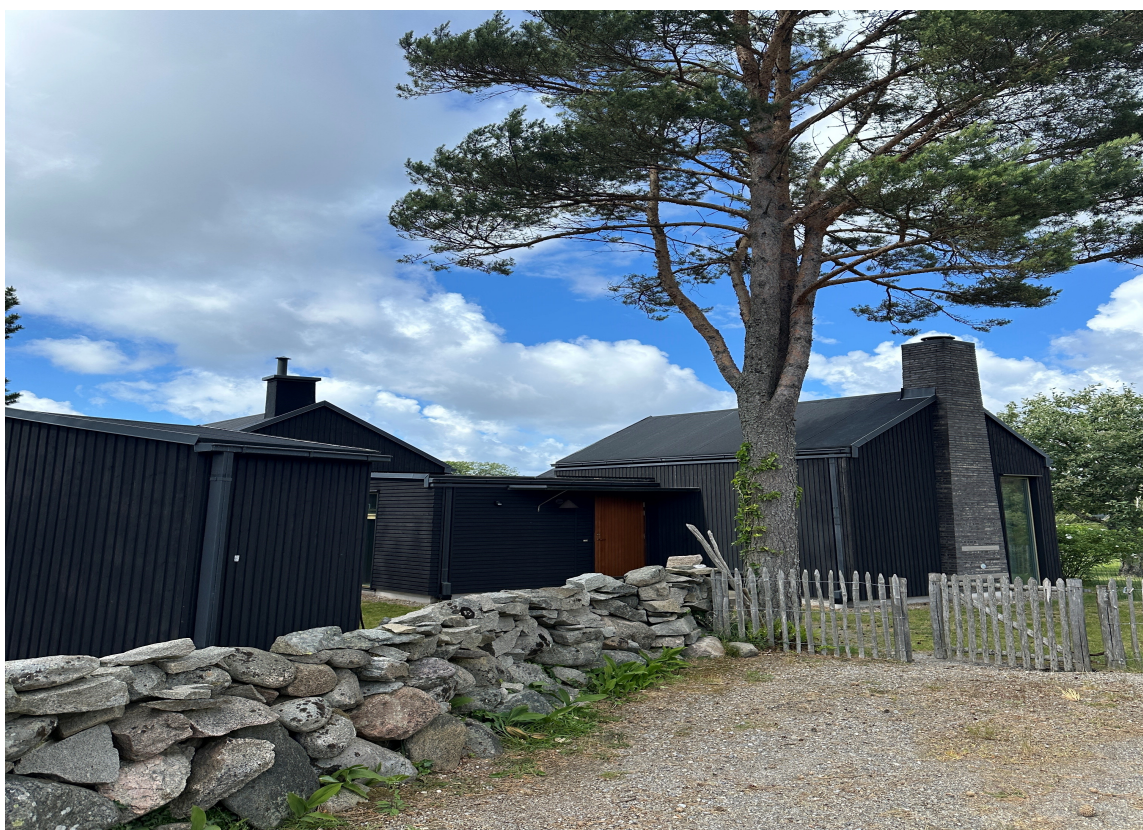
I ETT MED NATUREN: Her har et moderne hus, beliggende på en naturskjønn øy med lite bebyggelse, fått både et steingjerde og et enkelt naturgjerde av tre. Materialene er hentet fra nærmiljøet. Det passer godt til huset og omgivelsene, og sklir inn i stedet for å trekke til seg oppmerksomhet.