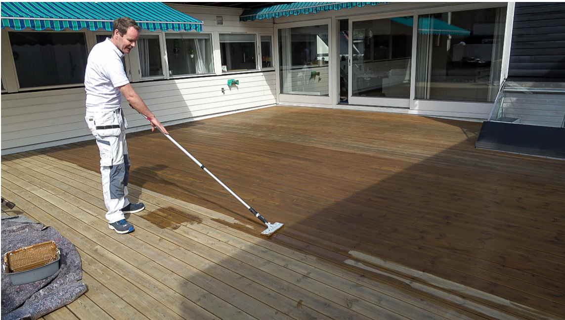
VENTETID: Det kan være lurt å være ute i god tid, hvis du ønsker at prosjektet skal være ferdigstilt innen en viss dato.

Mange håndverkere har lang ventetid, og det kan være lurt å være ute i god tid, hvis du ønsker at prosjektet skal være ferdigstilt innen en viss dato.