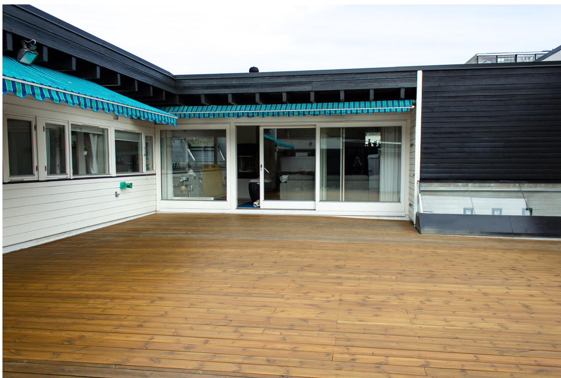
KLAR FOR BRUK: Her er sluttresultatet - en innbydende terrasse det klør i fingrene etter å bruke.