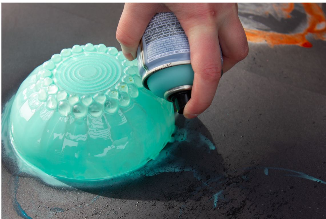
DUSE FARGER: Disse blåfargene er perfekte å kombinere med sterke påskefarger som gul, grønn eller lilla.