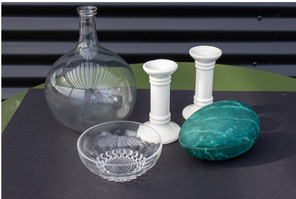
LITT AV HVERT: Lysestaker, skåler eller påskeegg er noen av tingene du kan friske opp i nye farger til påsken.

I brukbutikken fant vi mye spennende vi tenkte kunne bli til fin påskepynt. Vi fant et par hvite lysestaker, en glasskål, en vase og et påskeegg av metall. Da var det bare å dra tilbake til kontoret å sette i gang.