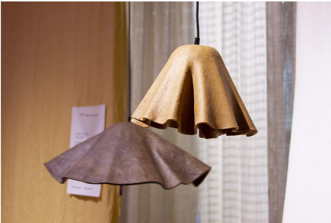
KAFFELAMPER: Disse er laget av kaffegrut og appelsinskall. Når den går i stykker kan den kastes på komposten.