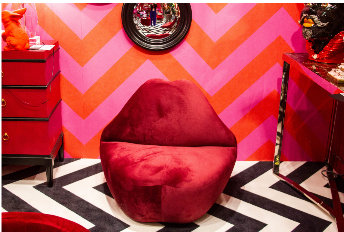
KISS ME: En stol formet som røde lepper på svart-hvitt gulv og rød-rosa vegger? Hvorfor ikke?