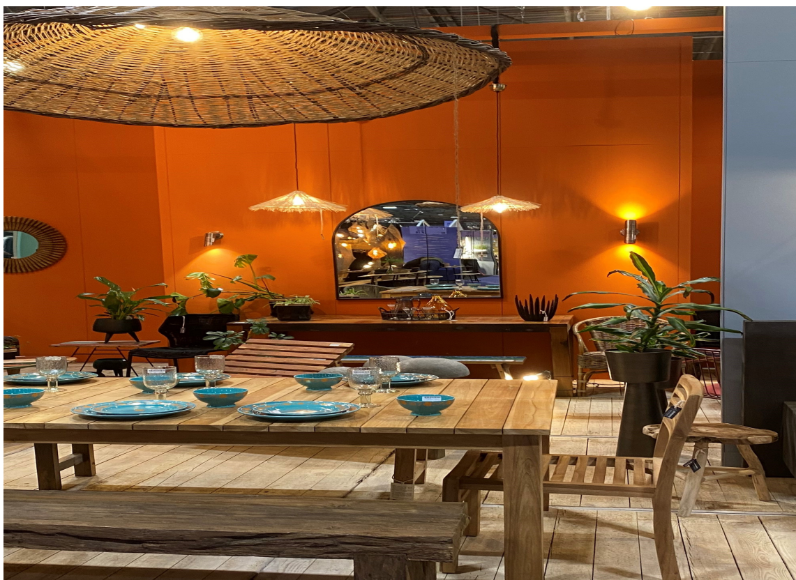
ORANSJE: I alle varianter og styrker har vi sett oransje/ferskenfarger, gjerne sammen med blått.