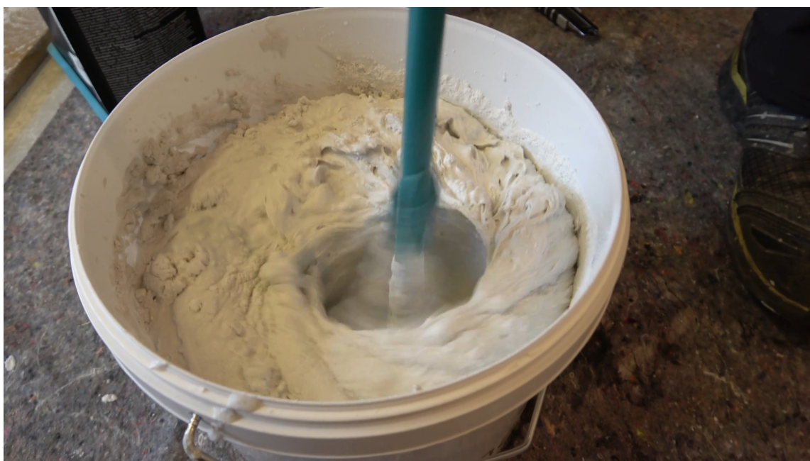
JEVN MASSE: – Når du blander sparkelmassen kan det være lurt å vurdere om du trenger å ta hele posen i med en gang. Tilsett litt pulver og bland før du heller oppi resten, sier Olaisen.