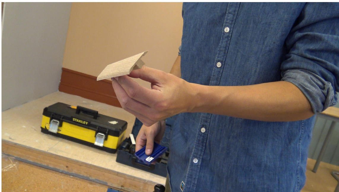
5-i-1-LIST: Denne 5-i-1 listen kan du endre ved hjelp av et verktøy som er i pakken til listen. Du kan blant annet få en t-list, en overgangslist eller en avslutningslist.