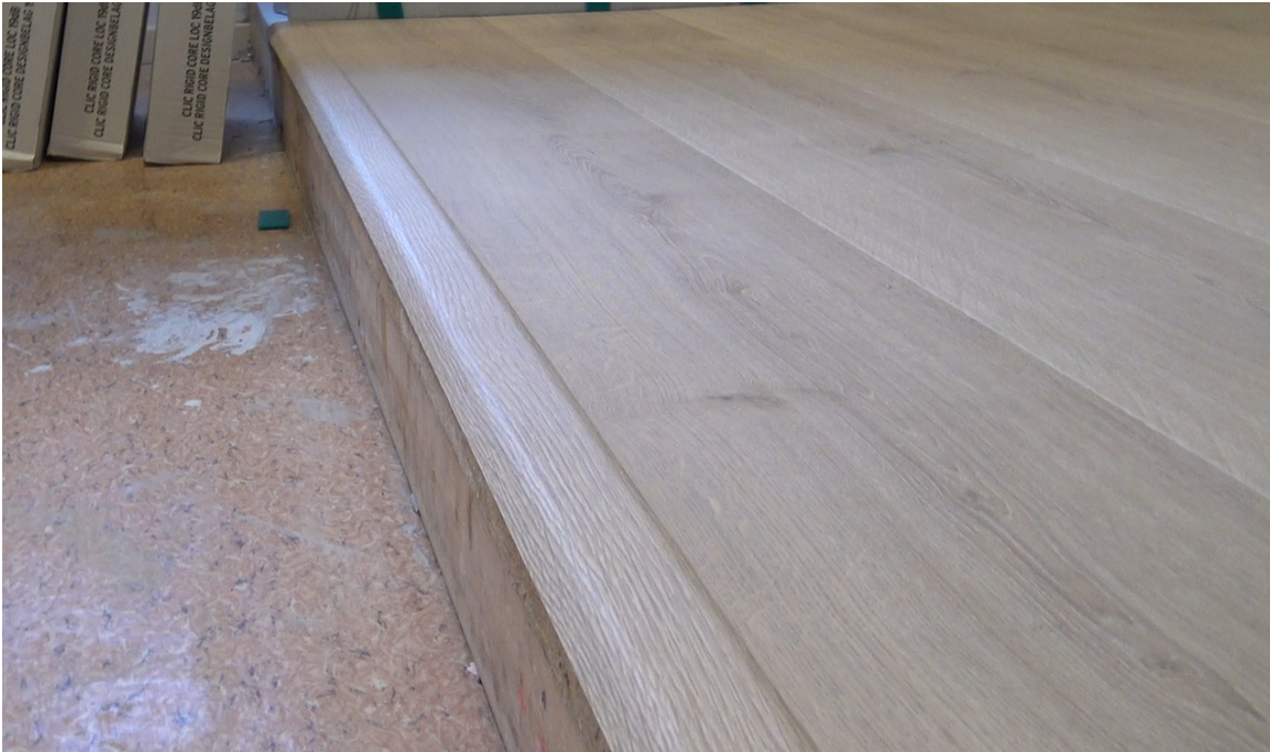
AVSLUTNINGSLIST: I filmen la vi en avslutningslist. Listene kan du få i farger som matcher gulvet.