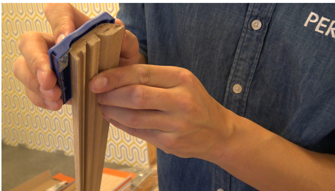
SLIK FUNKER LISTEN: Still inn riktig mål for den listen du vil ha. Dra deretter verktøyet langs listen og knekk av. Slip over den kuttete siden med slipepapiret på siden av verktøyet.