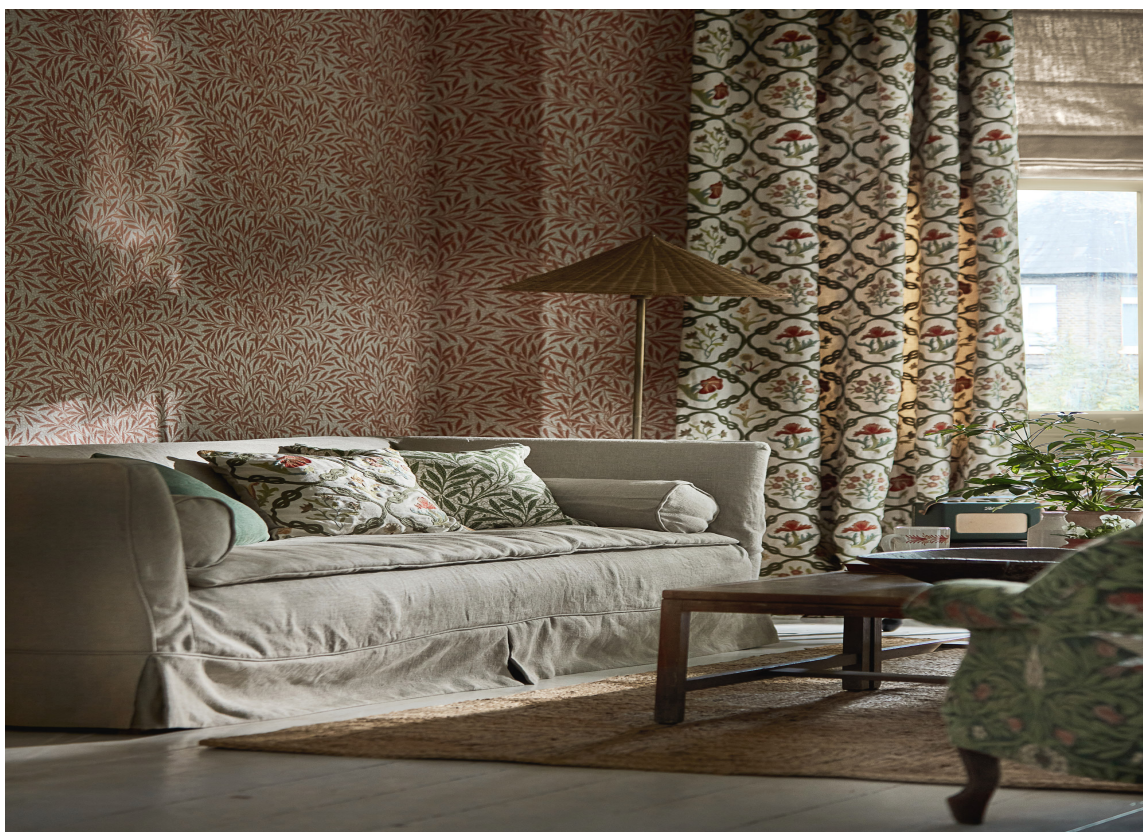
PUTER: En enkel og rimelig måte for å få mer stemning i rommet, er å bruke puter.