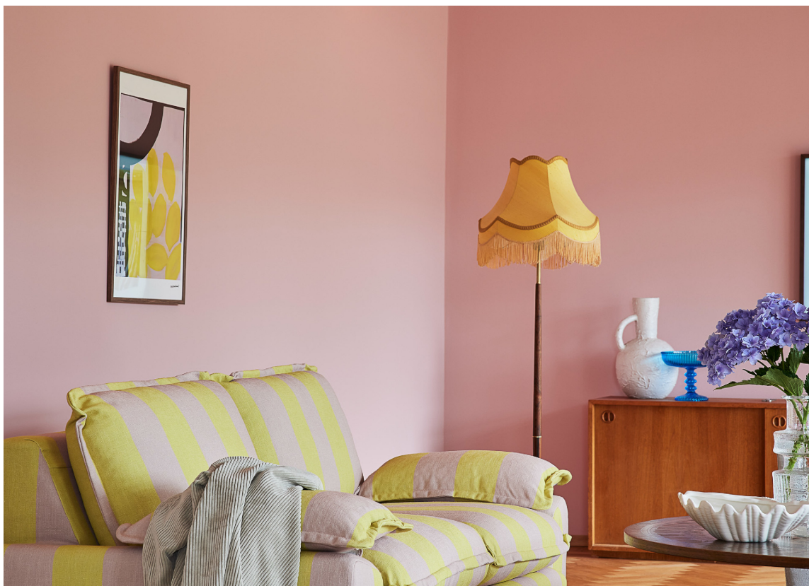
GJENBRUK: Med brukte elementer og morsomme stoffer blir det et unikt og personlig preg på interiøret.

Flere mønstre: Prøv å kombinere ulike mønstre, eller mønster på mønster. Det gir hjemmekoselig stemning. Hvis alt er likt, blir det fort for perfekt og litt stivt. Mer farger: Det kan være lettere å tørre mer når det gjelder puter, tepper eller en duk, enn fargen på en hel vegg, og det er enkelt å bytte ofte. Gjenbruk: Kombiner gjerne nytt og gammelt. Har du liggende en vevd eller brodert duk fra bestemor, kan det være fint å ta den frem nå. Det skaper gode følelser og gir nye minner. Har du bare små rester? Bruk dem som brikker på et brett eller lysfat. Eller kanskje de kan sys på en ensfarget pute som trenger litt ny gnist? Da får du et mer personlig og unikt preg på interiøret.