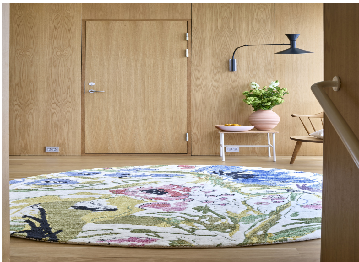
SMYKKE: Et teppe kan være som et smykke i rommet.