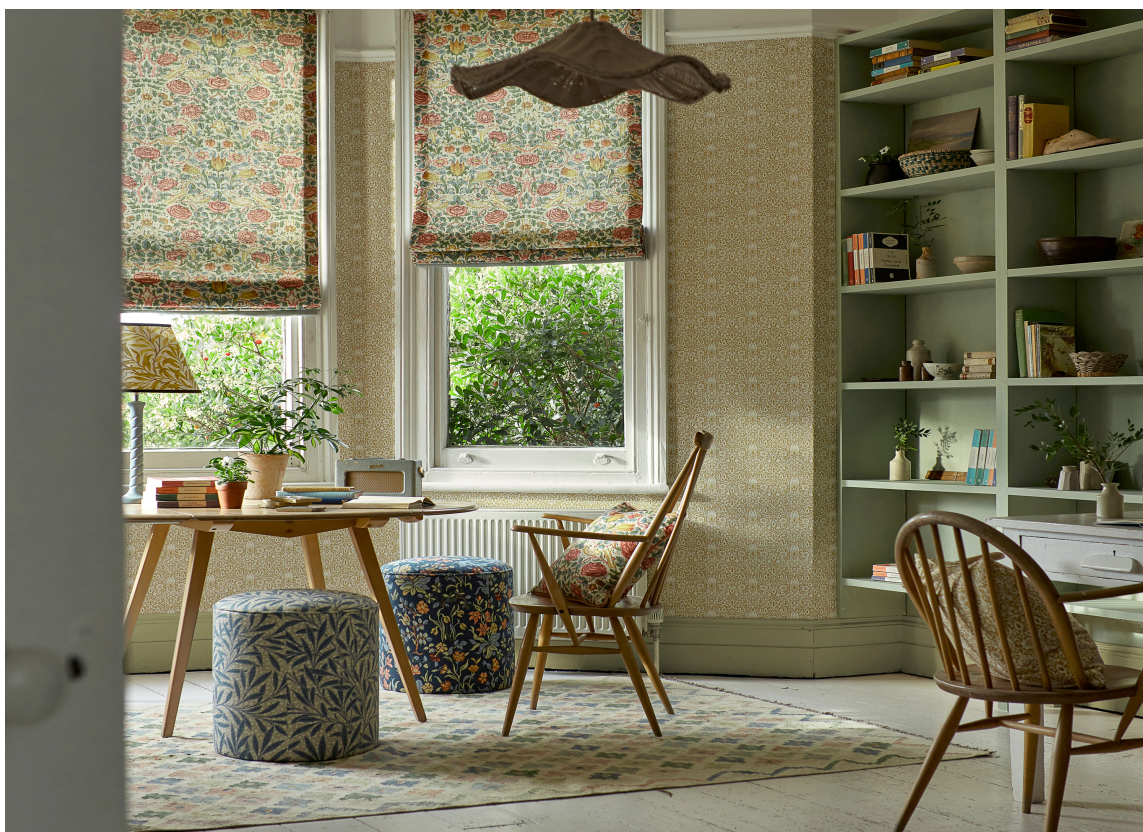
YNDIG: Blomster er mye brukt på tekstiler og liftgardiner på kjøkkenet er fortsatt en store greie.