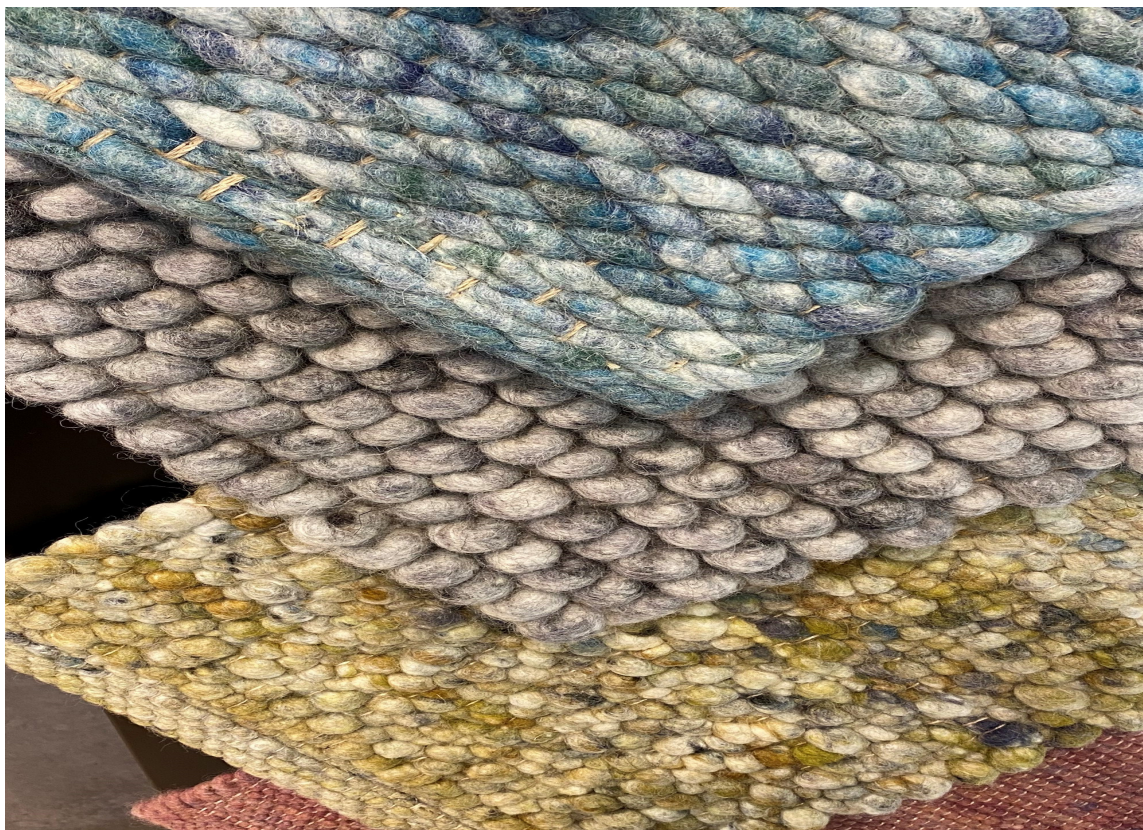
TYKKE TEPPER: Lubne tepper med mye liv. Ikke de beste å gå på kanskje, men veldig dekorative.