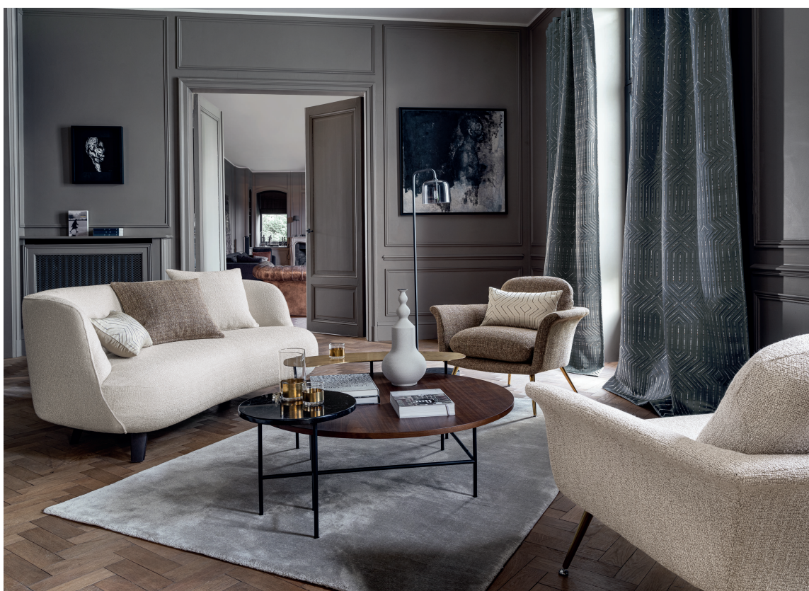
LUNT: Et lunt hjem å trives i er viktig. Uten tekstiler blir rommet fort kjølig og litt sterilt.