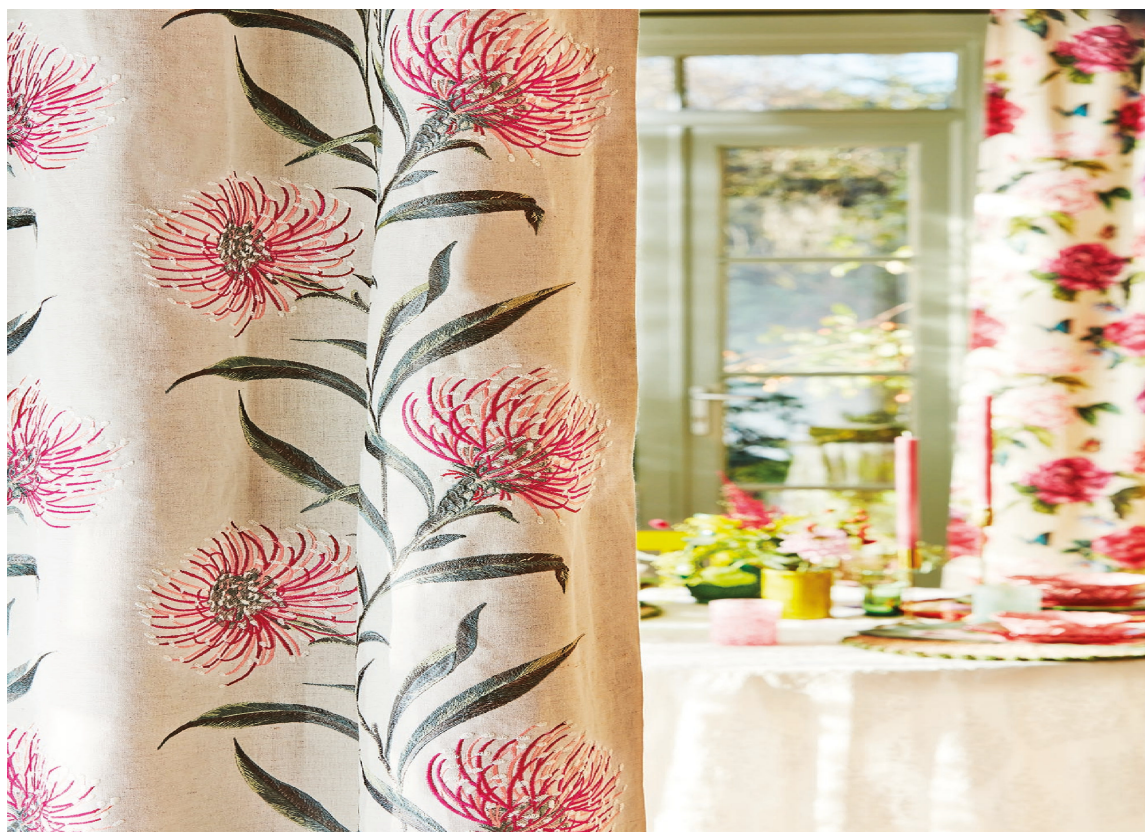
BLOMSTRETE GARDINER: Med blomster på gardinene kommer sommerfølelsen umiddelbart rett inn i rommet.