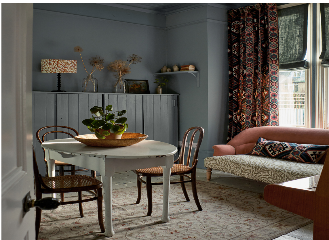
INTERIØR: Et rom trenger mer enn møbler for å bli koselig. Tekstiler gjør interiøret varmt og fint.