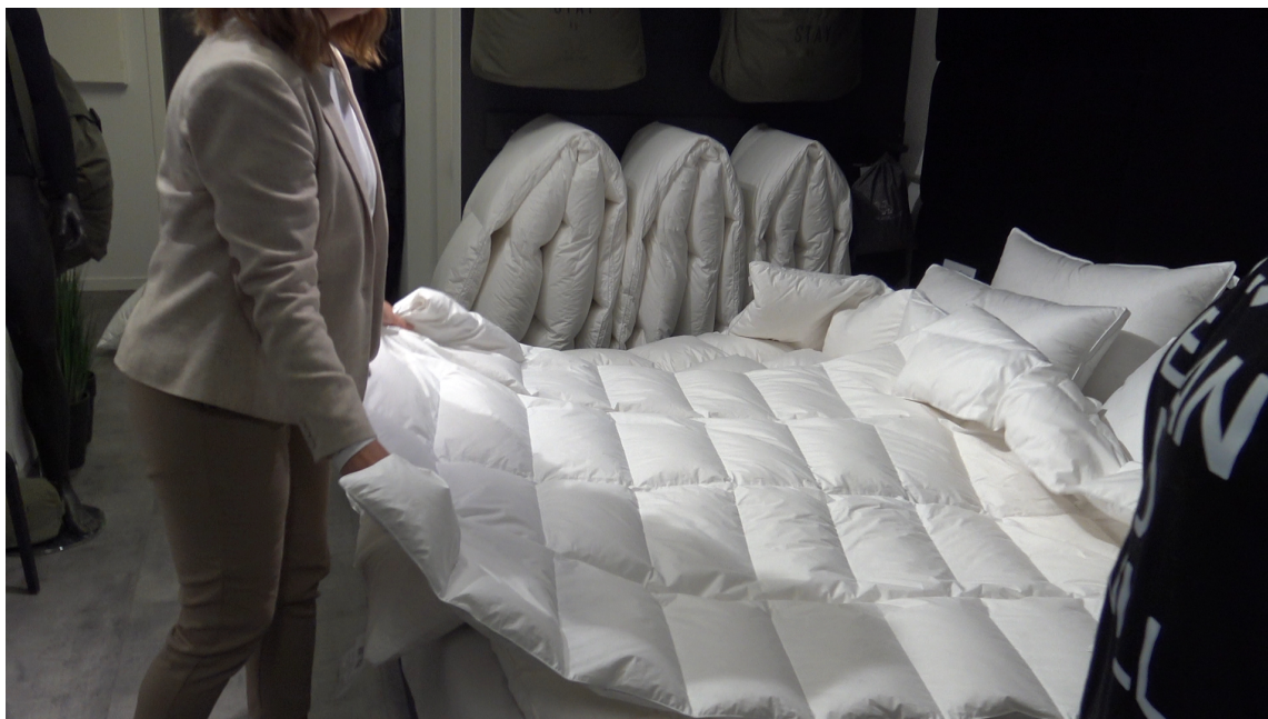
SNU DEN: Snur du dynen hver morgen vil den fuktige siden peke opp, slik fuktigheten tørker opp.

– Det varierer mye fra person til person hvor varme de blir i løpet av natten, men de aller fleste av oss er ganske varme når vi sover. Det vil føre til at den siden av dynen som er mot kroppen vil bli fuktig. For at vi enkelt skal kunne kvitte oss med denne fuktigheten, er det lurt å riste dynen, og deretter snu den slik at siden som var mot kroppen nå peker opp, sier Haltuff.