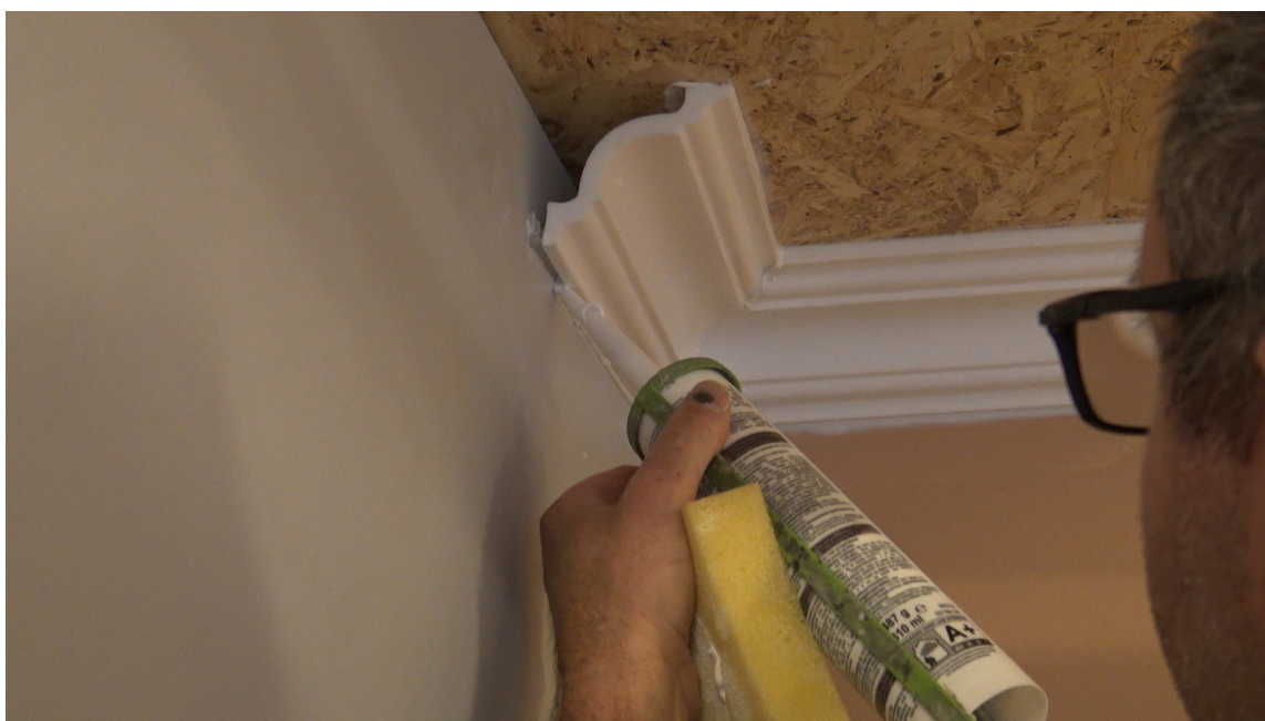
FUG: Av og til kan vegger og hjørner ha litt skjevheter i seg. Da kan du bruke limet som fug og fylle tomrommene.