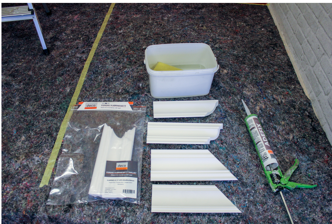
LITE UTSTYR: For å montere Deco Systems sine lister trenger du lim, kniv, svamp og listen.

– Alle lister kommer ferdig kappet, det gjelder både inn- og utvendige hjørner. De ferdig kappede listene gir perfekte 90-gradershjørner hver gang. Listene er laget av polystyren som gjør at de er veldig formstabile, og derfor enkle å montere, sier Hoff.