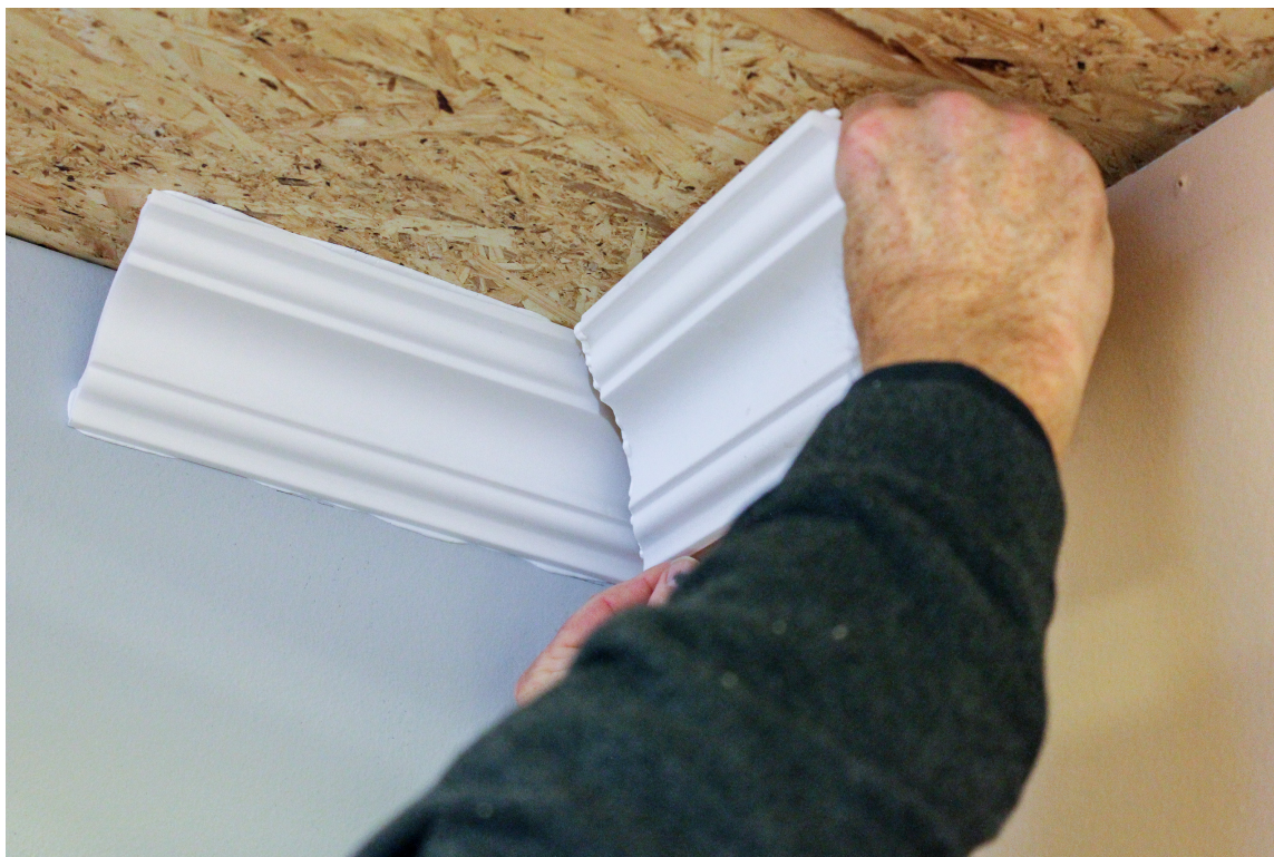
FERDIG KAPPET: – Alle lister kommer ferdig kappet, det gir perfekte 90-gradershjørner hver gang, sier Hoff.

– Listene tåler høy luftfuktighet, så de kan også benyttes til badrom eller andre områder som har relativt høy luftfuktighet, legger han til.