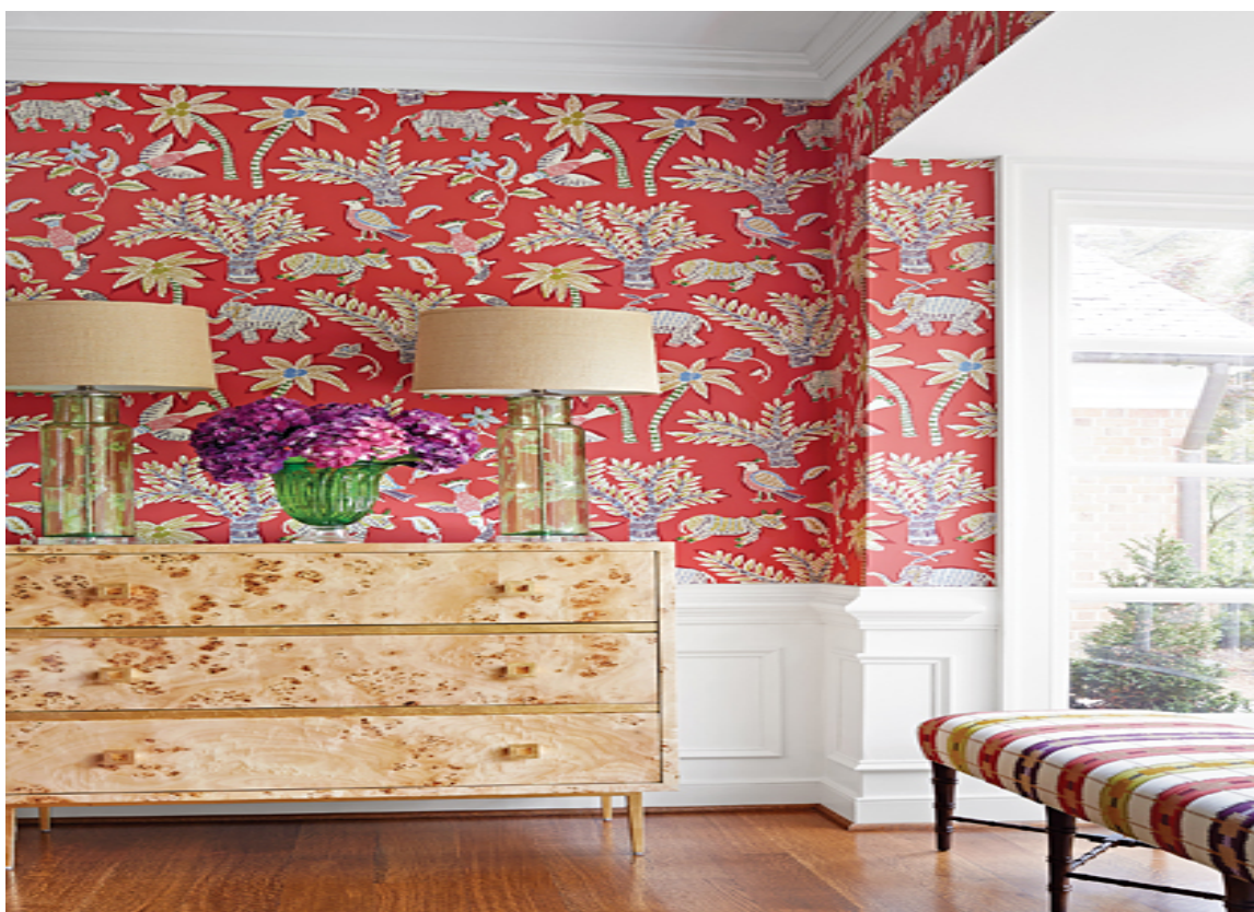
RØD ENTRE: I denne entréen henger det et tapet fra Thibaut, mønster Goa fra kolleksjon Trade Routes. Føres av Green Apple.