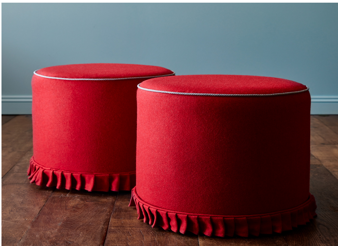
RØD PUFF: Hva med å trekke en puff i knallrød velur, og la den gi rommet det ekstra piffet? Stoffet her er fra kolleksjonen Juno fra Linwood. Føres av Intag.