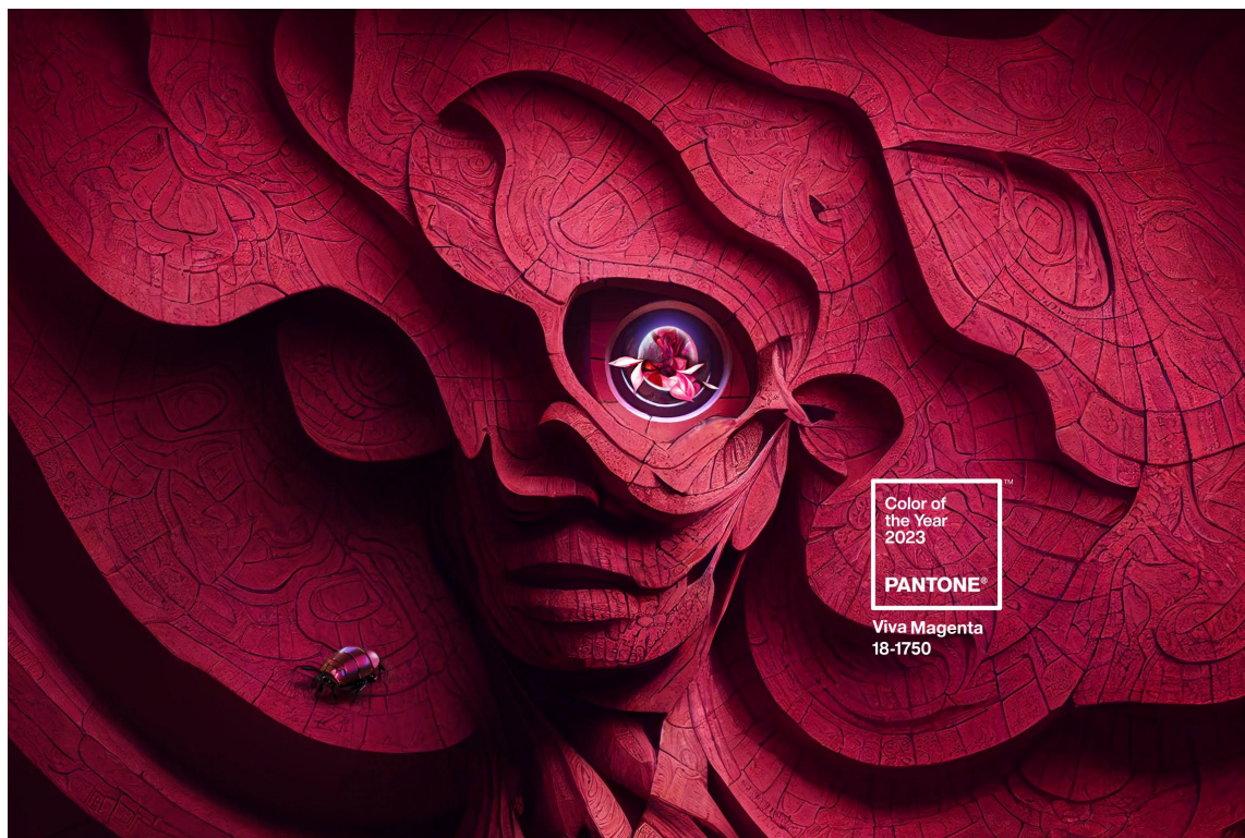
ÅRETS FARGE 2023: Det verdenskjente fargesystemet Pantone har valgt den friske og kraftfulle rødfargen Viva Magenta til årets farge 2023.

Og nå er vi klar for å ta det røde trikset inn i rom, og piffe opp stuen eller gangen med en frisk aksentfarge. I 2023 blir det superaktuelt, etter at det verdenskjente fargesystemet Pantone har valgt den friske og kraftfulle rødfargen Viva Magenta til årets farge 2023.