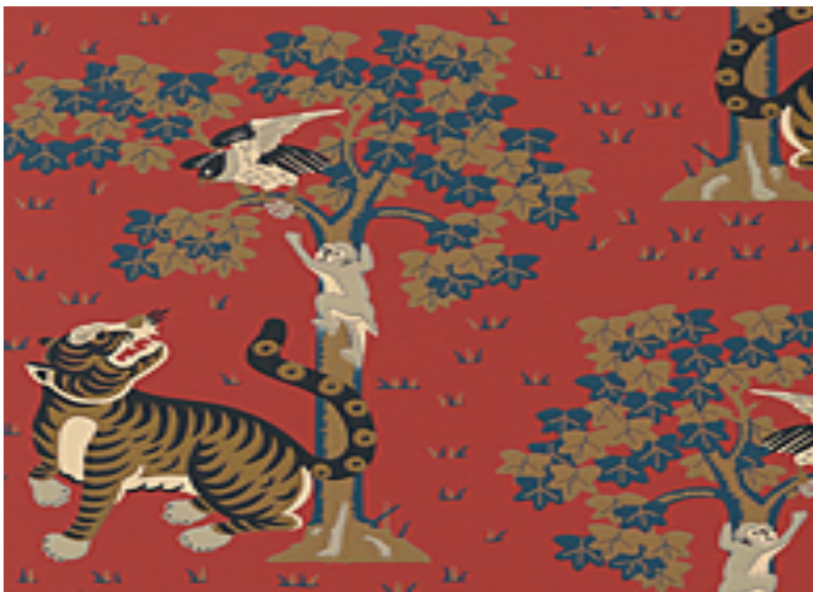
DYRISK BLIKKFANG: Et herlig tapet til gangen eller gjestetoalett! Tapetet er fra Thibaut/Anna French og finnes i kolleksjon Palampore. Føres av Green Apple