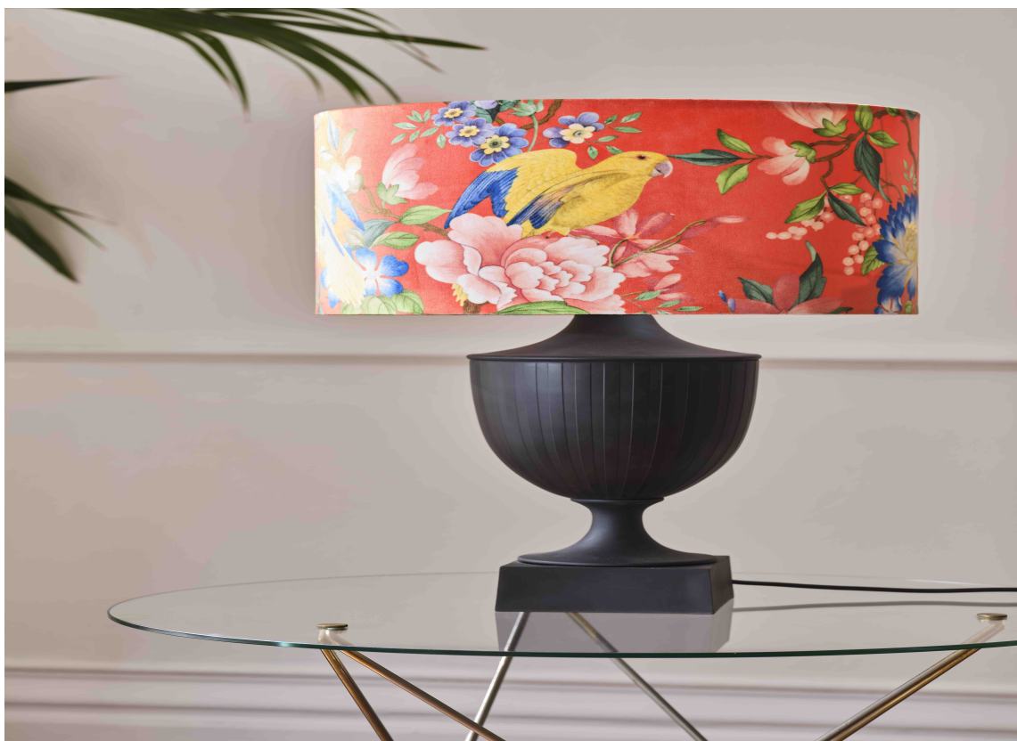
LAMPE MED LITT EKSTRA: Lampeskjermen er trukket med et tekstil fra Clarke&Clarke, design Golden Parrot. Føres av Storeys.