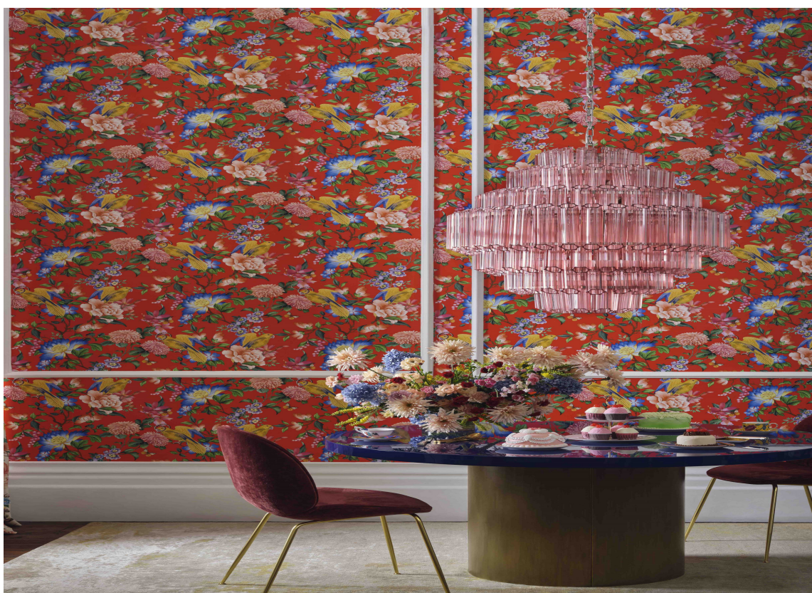
RØD ENTRÉ: Designet Golden Parrot fra Clarke&Clarke finnes også som tapet. Hvorfor ikke velge det til en entré for en skikkelig wow-effekt. Tapetet føres av Storeys.