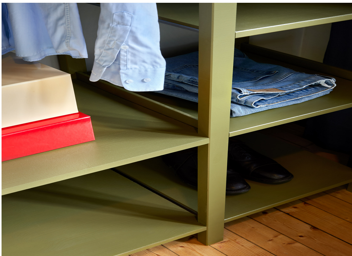
OVERRASKNING: «Fresh Moss» er grønnfargen du ikke visste at du trengte. Her er den brukt på en åpen garderobekonstruksjon. «Fresh Moss» er en av aksentfargene i kolleksjonen. Styling: Kirsten Visdal