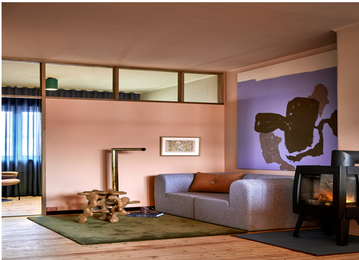
ALLE FARGENE: I boligen er alle fargene i kapselkolleksjonen brukt og i stuen brukes «Coy Blush» på både vegger og tak. Fotlisten er malt i fargen «Old Wine» som finnes fra før i Pure & Originals arkiv. Styling: Kirsten Visdal