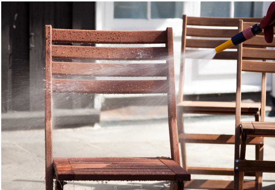
VASK: Rene utemøbler lever lenger.

Har du ikke plass i bod eller garasje kan møblene stå ute, men da dekket til av en presenning ment for denne bruken. Husk å ikke plassere dette for tett på husveggen, da snø og is kan fanges tett på veggen og føre til vannskader når det smelter.