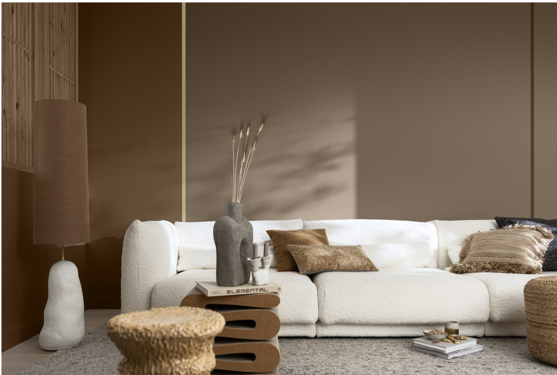
RAW COLOURS: Med nyanser hentet fra tørket gress, sopp og tre gir Raw-paletten en varm og fylldig, naturlig look.