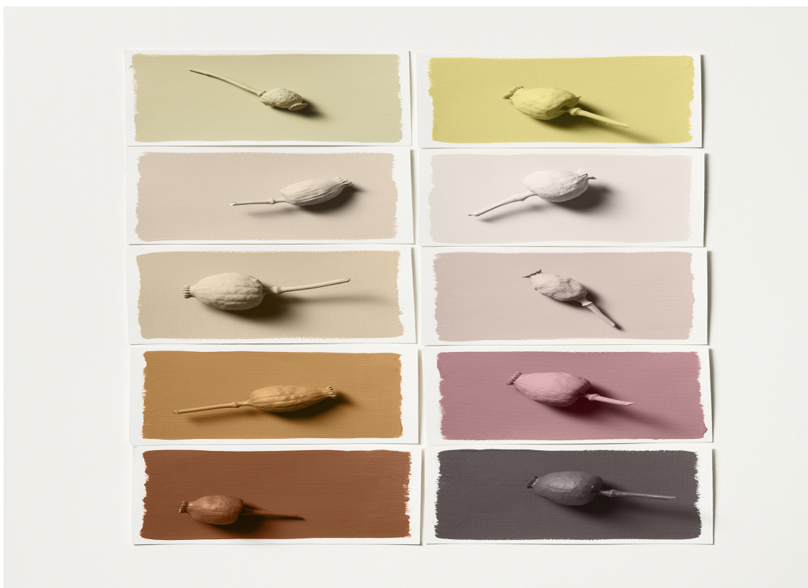
BUZZ COLOURS - disse fargenyansene er inspirerte av det livlige biologiske mangfoldet i en blomstereng full av forskjellige engblomster iblandet grønt gress.