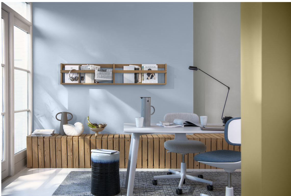
FLOW COLOURS: Vann, skjell, sand og stein – farger fra havet og stranden gir oss en avslappende nærhet til naturen.

I denne paletten har fargene hentet inspirasjon fra tidevann, bølger og jordens naturlige rytme. Fargene fra skjell, sand og stein hjelper til med å skape en følelse av kontinuitet og balanse. Årets farge Wild Wonder står for varmen i paletten, og kombinasjonen gir en rolig atmosfære i hele boliger eller enkelte rom.