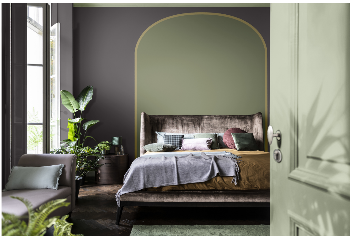
LUSH COLOURS består av grønt, brunt og lilla som sammen med Wild Wonder gir en naturlig rolig og håpefull palett.