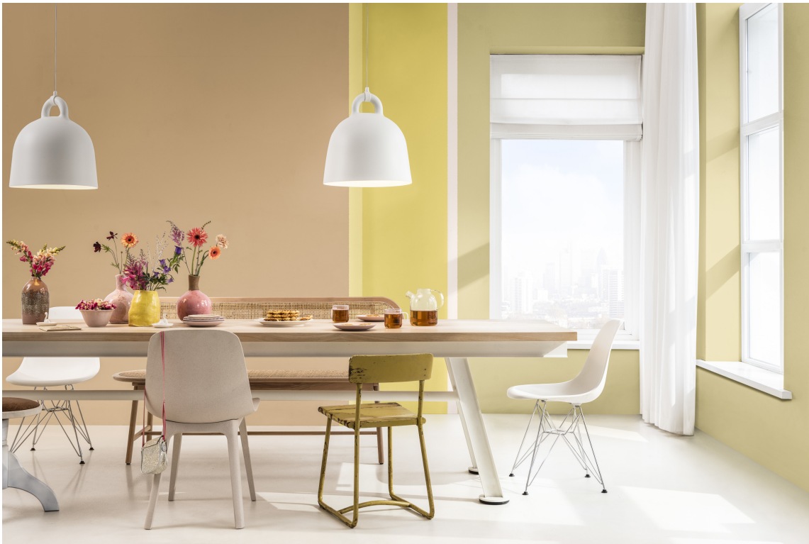
BUZZ COLOURS: Den optimistiske paletten i gult, rosa og gyllene farger tilfører glede og harmoni og hyller styrken i å jobbe sammen.

Buzz henter inspirasjon fra det mangfold av blomster som er på våre åkermarker og enger. Fargene er intense og varme, og gir glede og energi. Her fungerer Wild Wonder både dempende og sammenbindende. De mettede nyansene av gult, rosa og oker er perfekt for sosial omgang og lekfullhet.