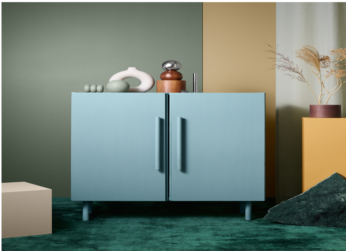
HEY STYLISH: De mørke og dype fargene I trendfamilien «Hey Stylish» flørter med både hotellstil og et elegant og lunt interiøruttrykk. Skapet med Prettypegs håndtak og bein er malt i fargen Stålblå 782.