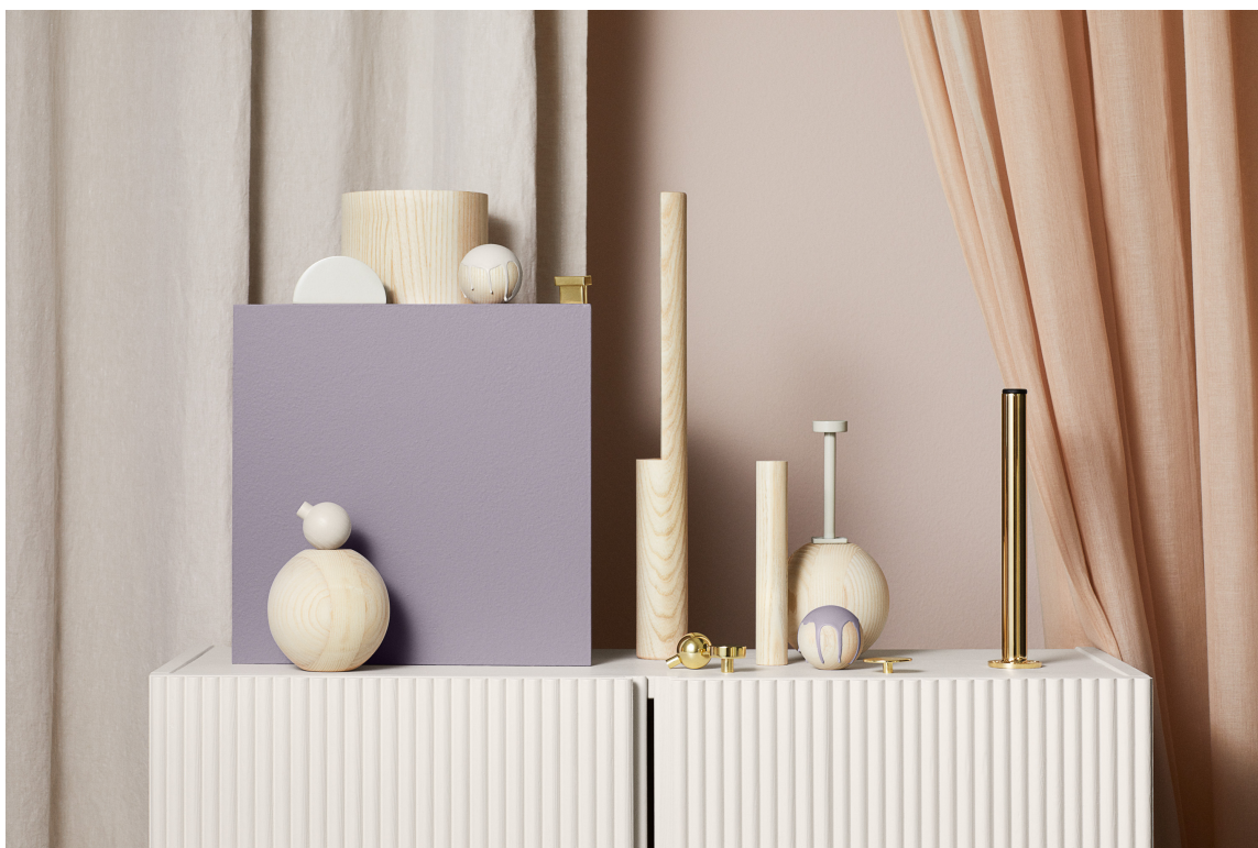
IN BEIGE WE TRUST: Fargefamilien «In beige we trust», som er en del av Beckers trendfargekolleksjon for 2022, er dempet og naturnær. Fargene gir en myk og rolig følelse. Her er Ivar Front panels malt i fargen Camee 561 og den lilla boksen i Hortensia 722.