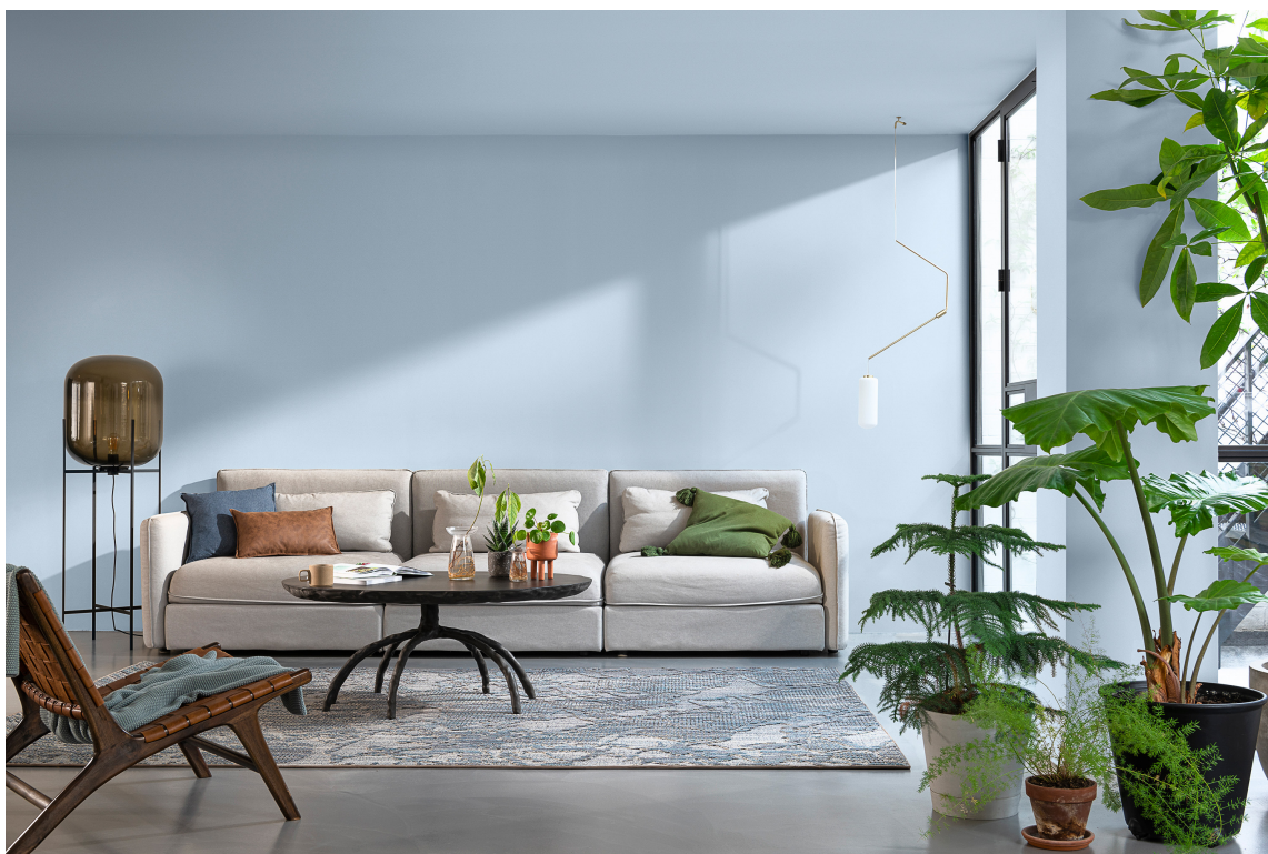
ÅRETS FARGE: Bright Skies er frisk, åpen og god for sjelen. En vitaliserende nyanse som fører inn naturens positive effekter og gir nytt liv til alle våre boareal. Det er også en farge som fungerer med en mengde andre nyanser, fra myke nøytrale til glade og lyse farger.