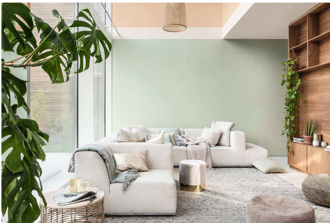
CALM: Den duse grønnfargen Tranquil Dawn, som var Årets farge i 2020, gir rommet en ro, en beroligende følelse, som langt fra er kjedelig.