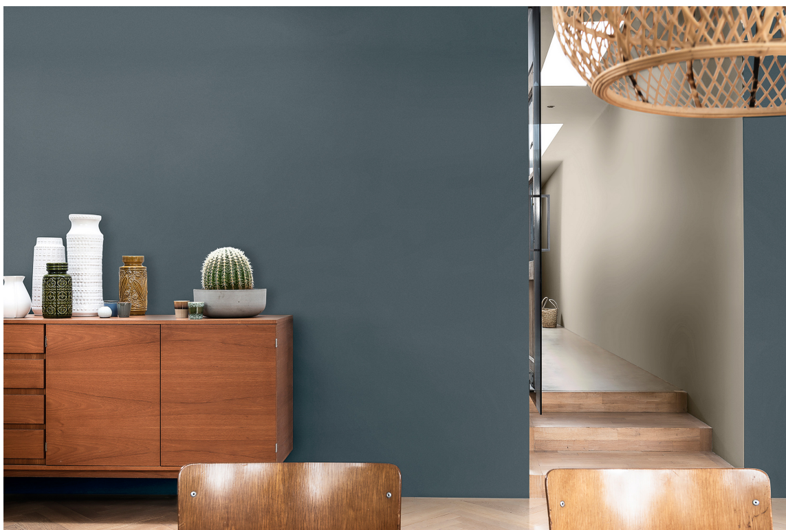
DEEP: Den mørkt grå fargen Dazzling Paris gir et stilrent og eksklusivt uttrykk og er perfekt for å skape hotellstil hjemme.