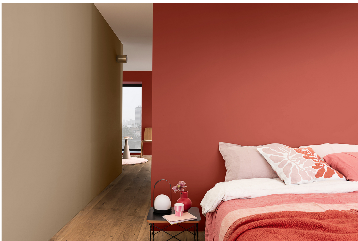
COZY: Kombinasjonen av den terracotta-lignende fargen Dusky Antibes og den nougatfargede Glowing Melun setter karakter på hjemmet.