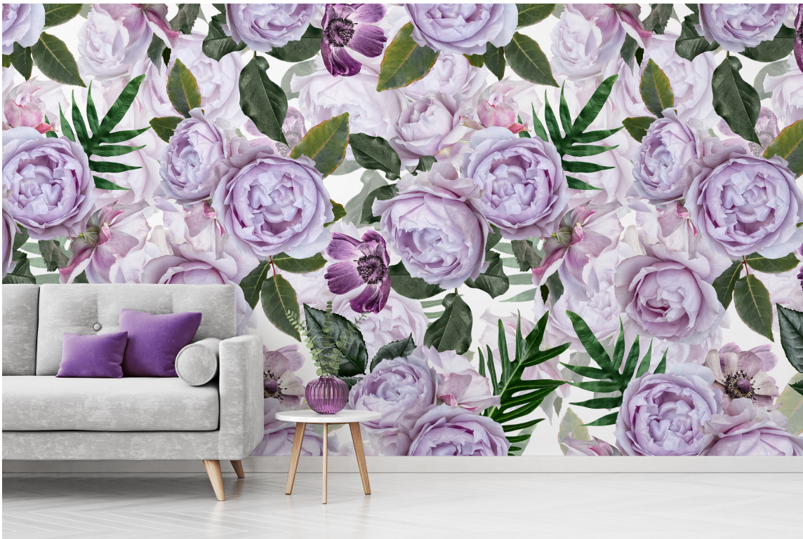
FORANDRINGENS TID: «Very Peri» viser globale tidsånd vi lever i. Den skal symbolisere forandringer vi ser i samfunnet. Det skriver Pantone Color Institute i sin pressemelding om 2022-fargen. Her er fargen vist i et tapet fra Wallsauce.com (Pretty Purple Peonies Mural by Uta Naumann)