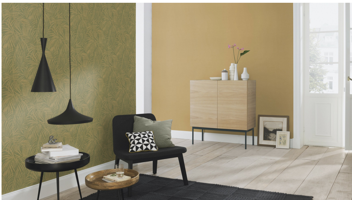
MANGE NYANSER: Gulfargene som gjelder nå spenner fra gulgrønn, via solgult til gulbrun – blekt, mørkt og kulørt. Bruk de du liker best! Tapetene her er Symfoni fra Wall Concept.