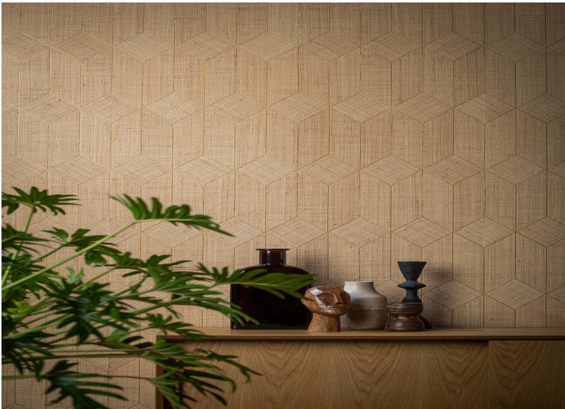
HÅNDVEVET LOOK: Dette er vevet tapet fra Omexco. Materialet er tråder laget av papir, designet er inspirert av gamle japanske teknikker og mønstre. Kolleksjonen heter Tribu. Omexco-tapeter føres av Intag.