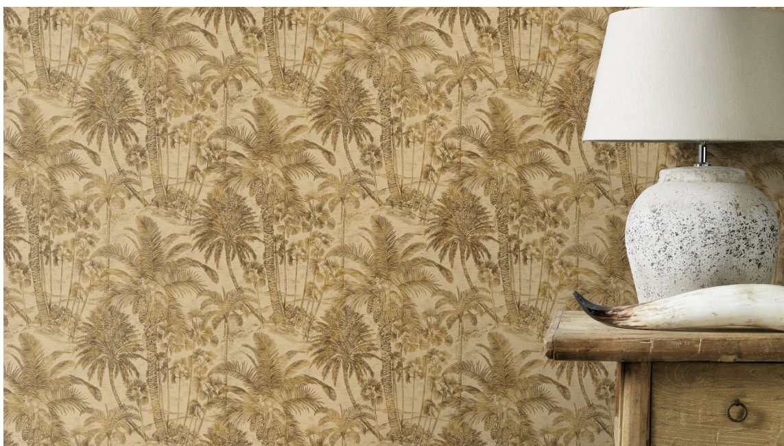
STEMNING: En av grunnene til at det brukes mye tapet på hoteller og restauranter, er en unik egenskap til å lage stil og stemning. Du gjør det med farger, mønster og tekstur. Tapetet her er Symfoni fra Wall Concept.

Uansett hvilken stemning eller stil du er ute etter, så finnes det både gulfarger og tapet som tar deg i riktig retning.