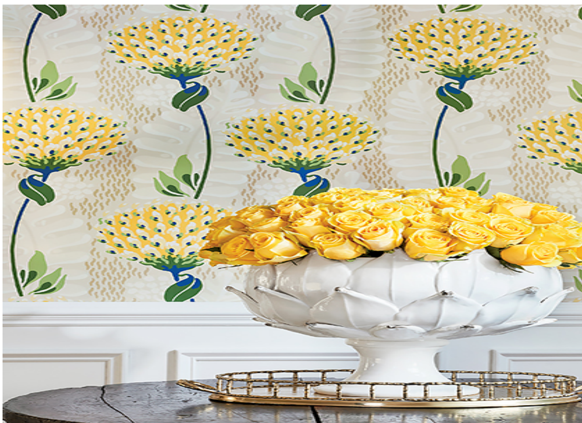
SOMMERLIG: Gule blomster mot hvit bunn virker sommerlig friskt og lett. Dette tapet er fra Thibaut, kolleksjon Ceylon. Det føres av Green Apple.