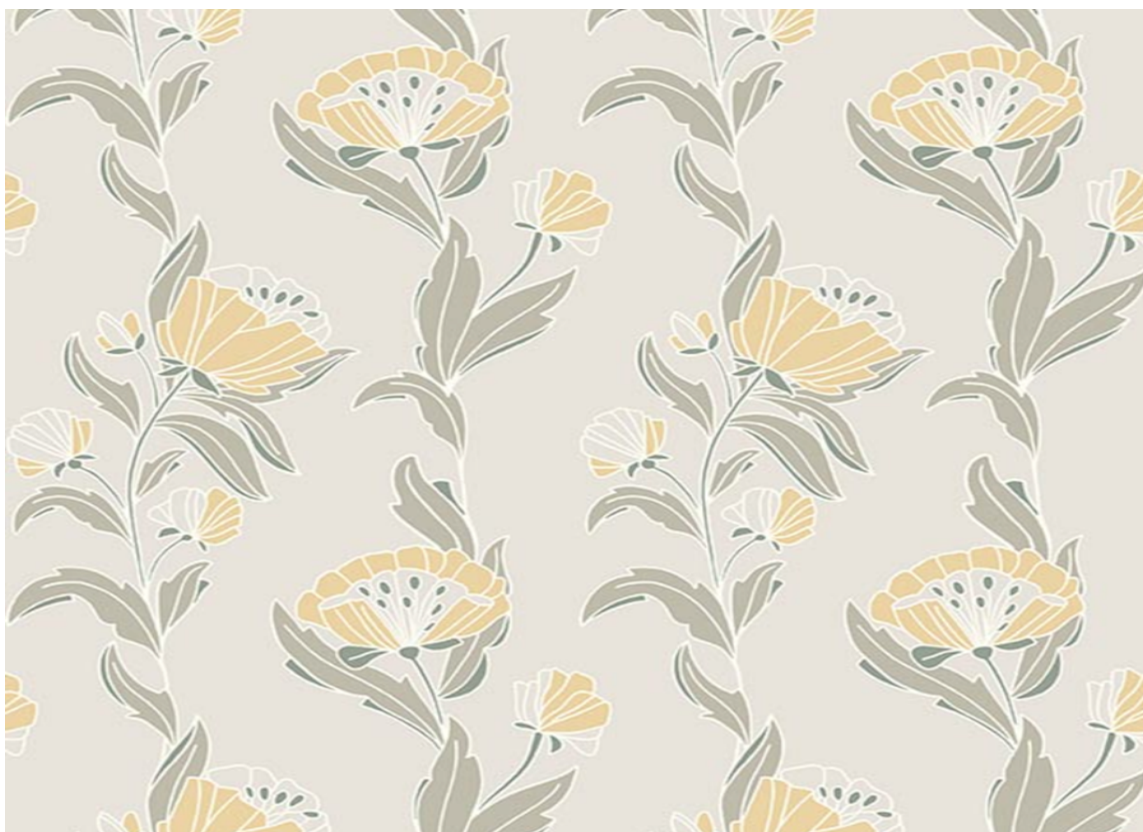
ROLIG OG DEMPET: Et stilisert enkelt blomstermotiv i dempede farger, vil passe fint til den nordiske stilen og dra uttrykket litt mot retro. Tapetet Fiona Wild Bouquet føres av Flügger.