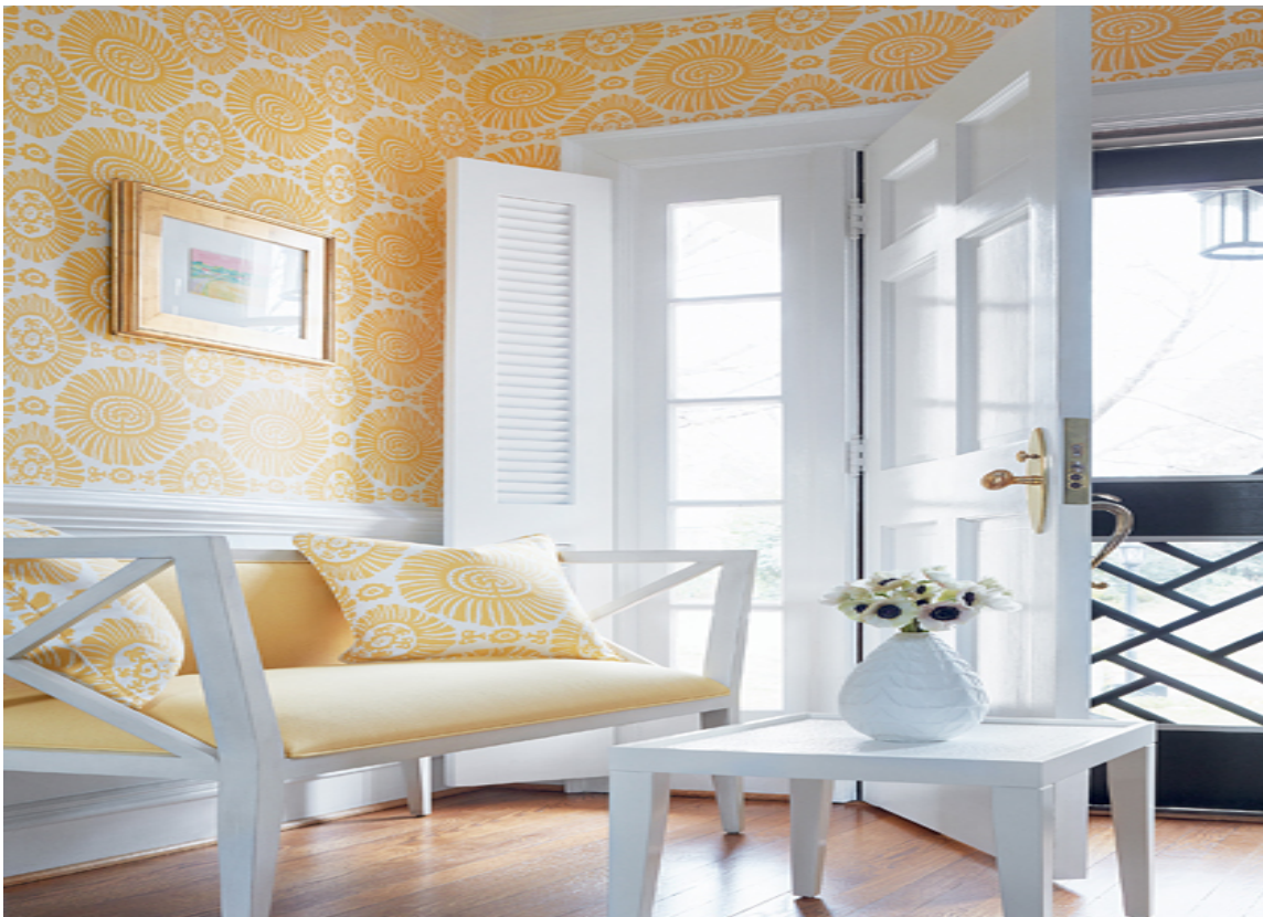
SVALT: Solfyllt og sommerlig atmosfære med gult mønster på hvit bunn. I kombinasjon med hvitmalt blanke dører og listverk blir helheten sval og luftig. Tapet fra Thibaut, føres av Green Apple.