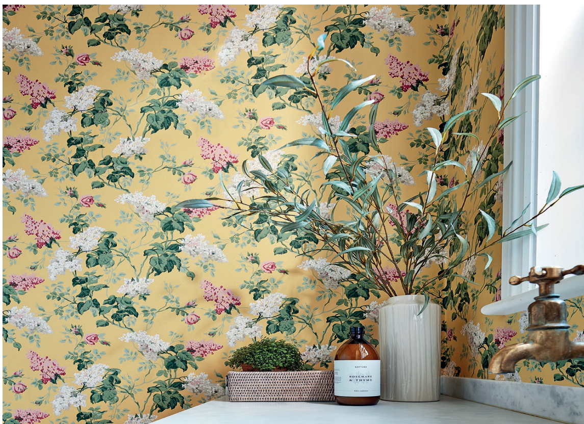
KLASSIKER: I Sandersons kolleksjoner er det mange gode design, som er evig aktuelle. Denne fant vi i kolleksjonen One Sixty. Sanderson tapet og tekstiler føres av Intag.