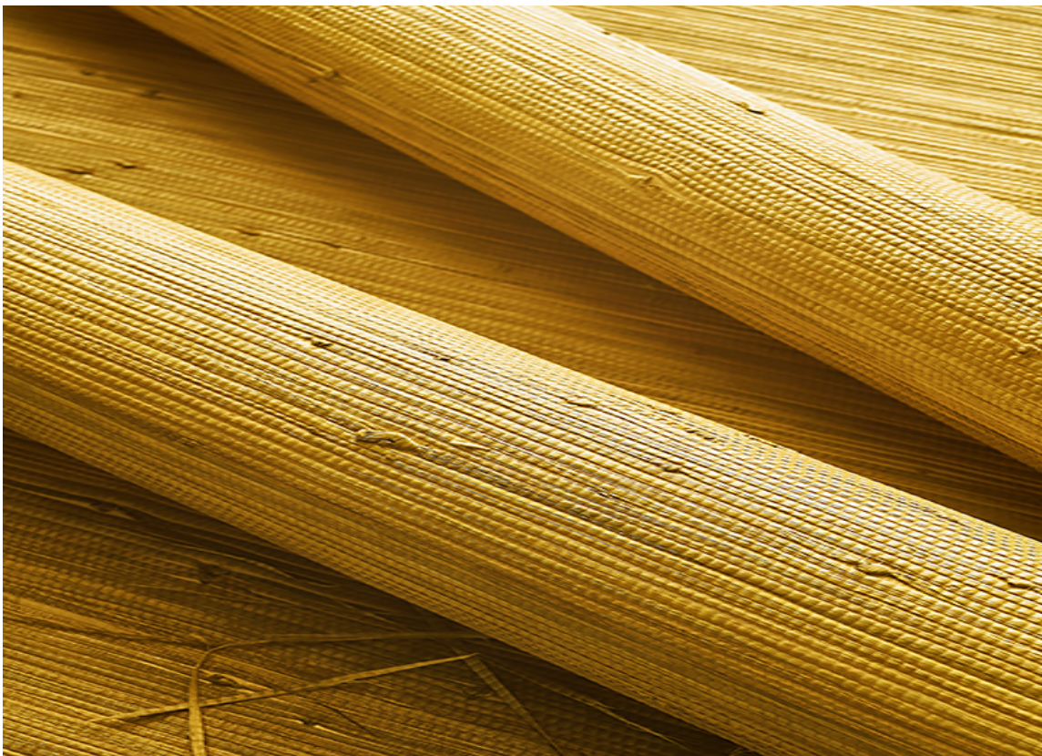
PLANTEFIBER: Tapetet Grasscloth fra Thibaut finnes i mange forskjellige nyanser fra lyse naturfarger til heftig og gult. Tapetet føres av Green Apple.