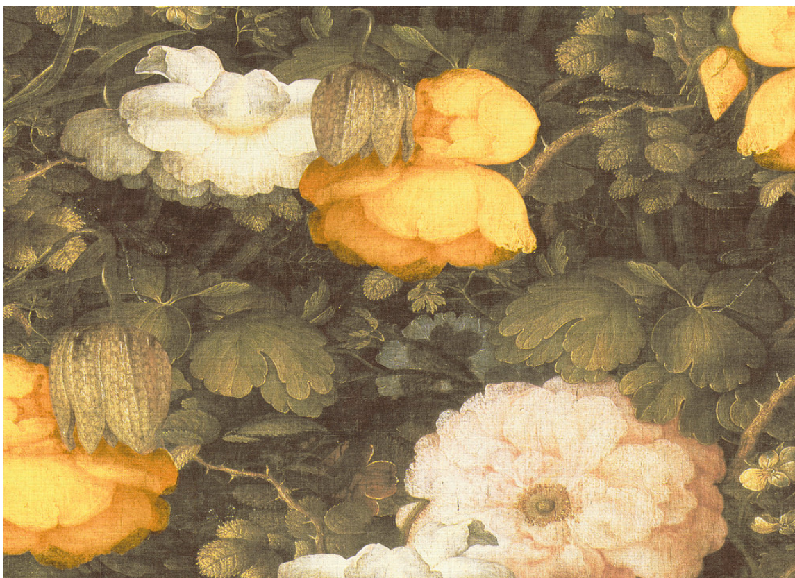
ROSEDUFT: Går du for litt mer tyngde og en varm, atmosfære, så ta en titt og kjenn litt på dette tapetet. Det er nesten så vi hører humlesurr og kjenner roseduft strømme ut av vegg. Tapetet heter Metropolitan Stories og føres av Storeys.