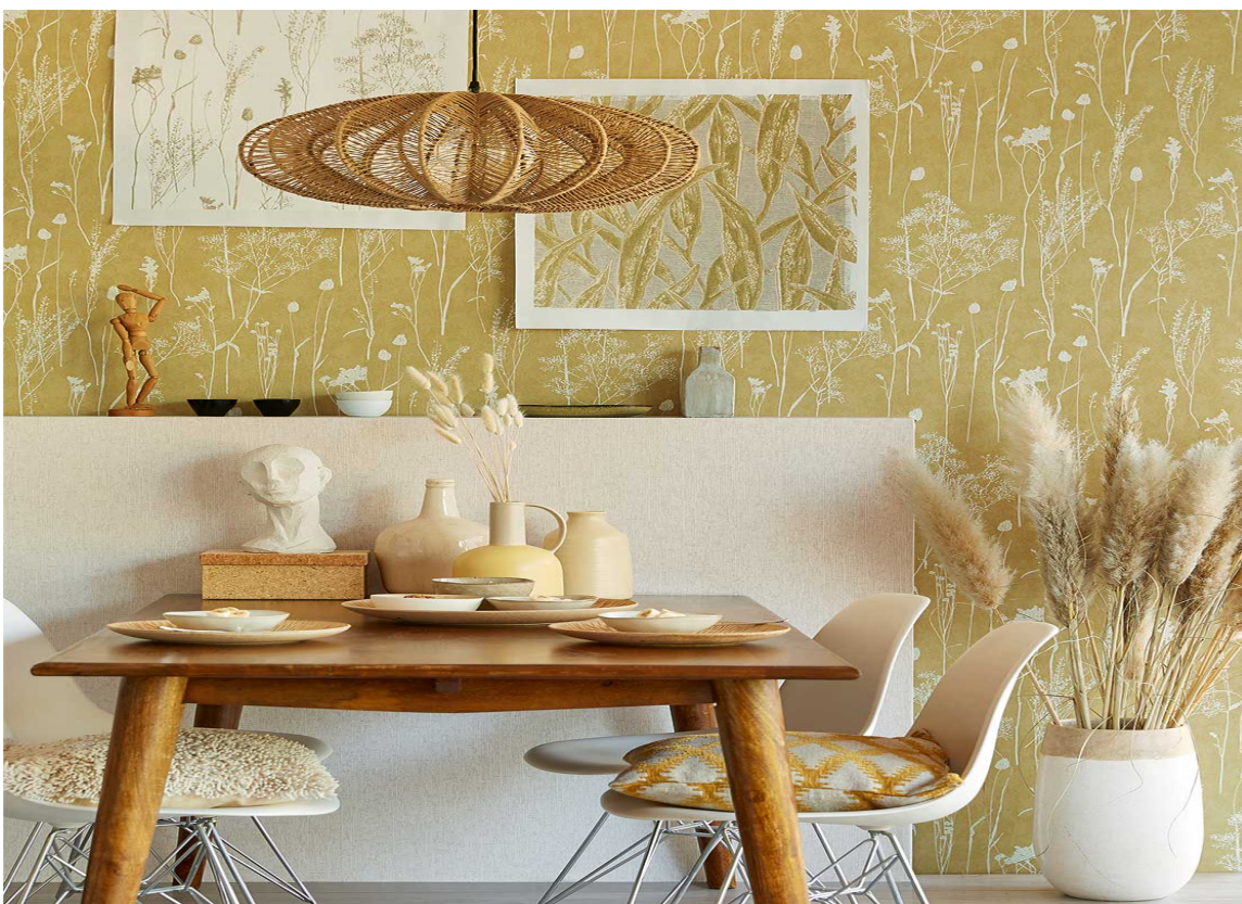
LUNT: Gult som heller mot rødt i kombinasjon med lyse, matte naturmaterialer gir en lun atmosfære. Tapetet Waterfront fra Eijffinger føres av tapetleverandøren Storeys.