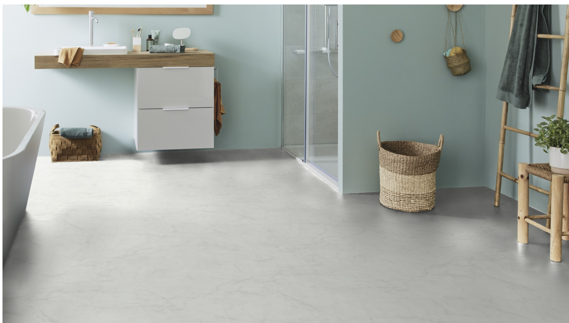
VÅTROM: Under «gulv og vegg til badrom og vaskerom» finner du gulvene som egner seg til våtrom. På bilde ser vi gulvet «Aquarelle Carrara Marble White».