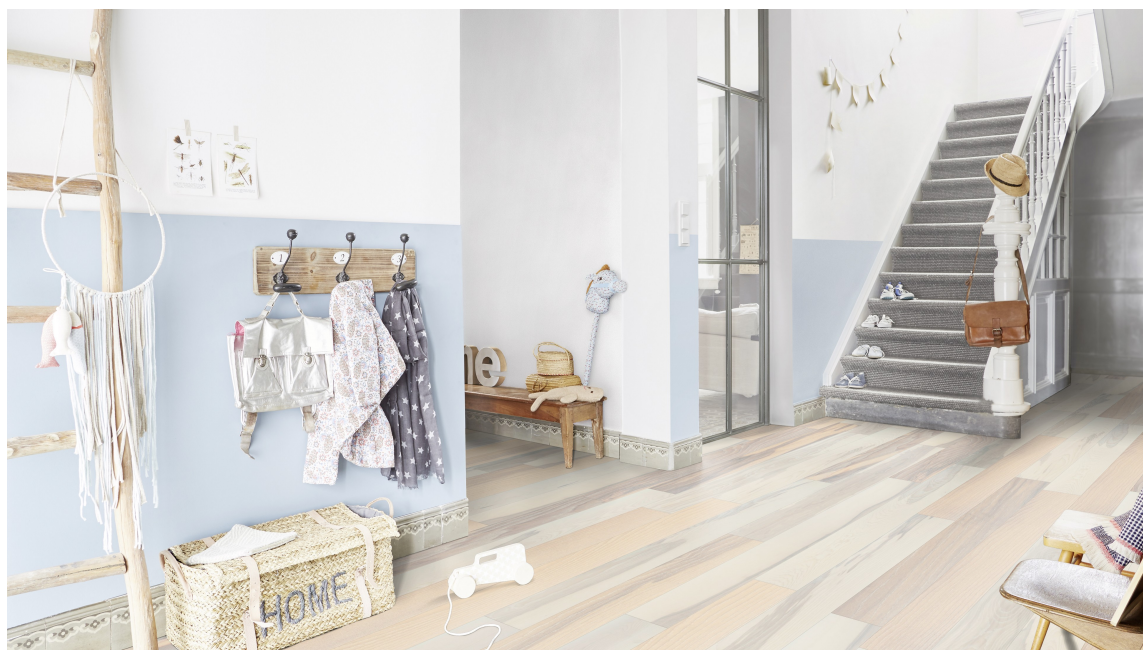
LA KREATIVITETEN BLOMSTRE: Room Designer har flere forhåndsbilder tilgjengelig for bruk. Her er ser vi ett av dem, med det unike gulvet «Prestige Ask SEASHELL».