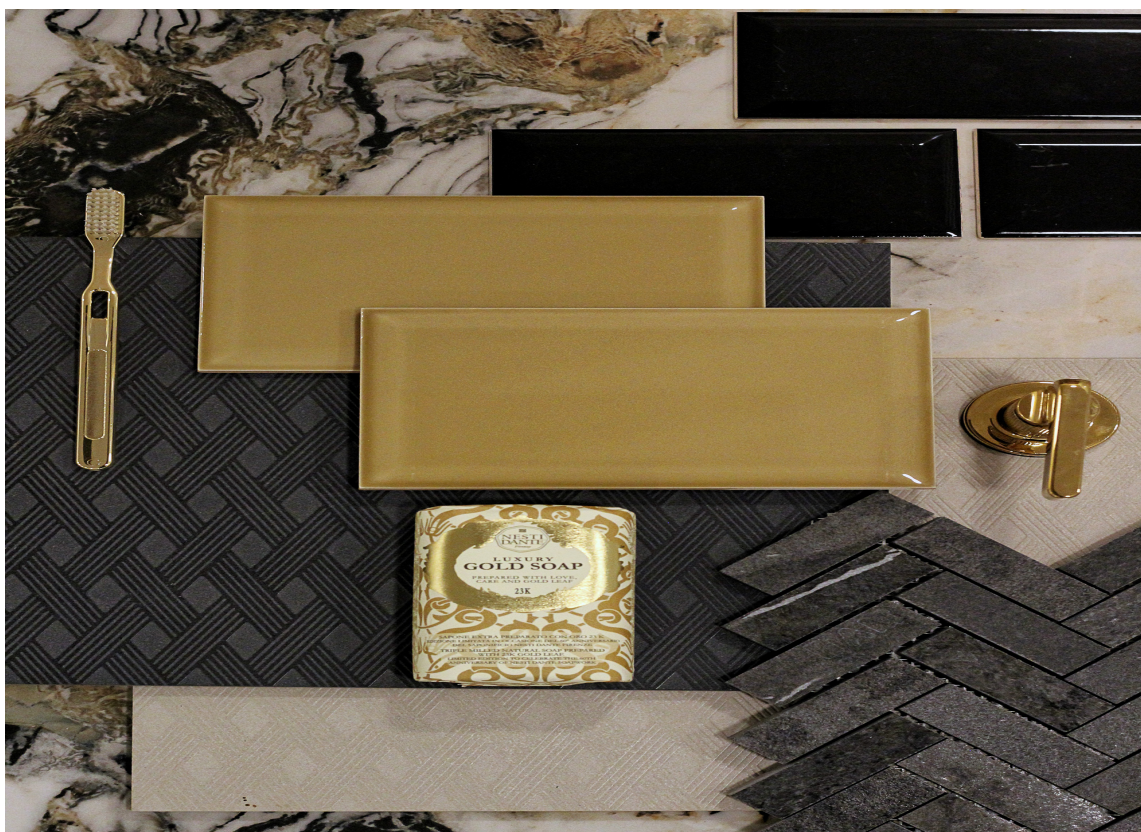
MOTEHOVEDSTADEN: Moodboard inspirert av Milano.