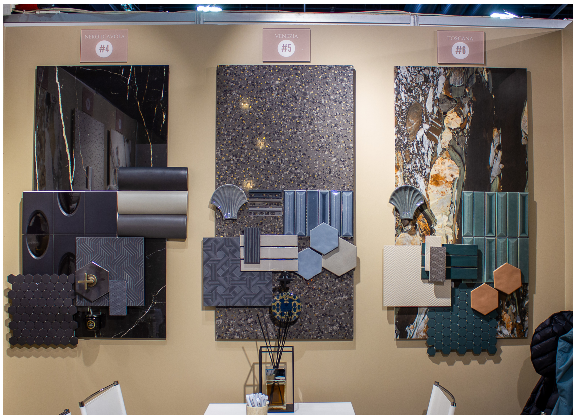
ITALIAINSPIRASJON DEL 2: Disse tre moodboarden er inspirert vinen Nero D Angelo og byene Venezia og Toscana.