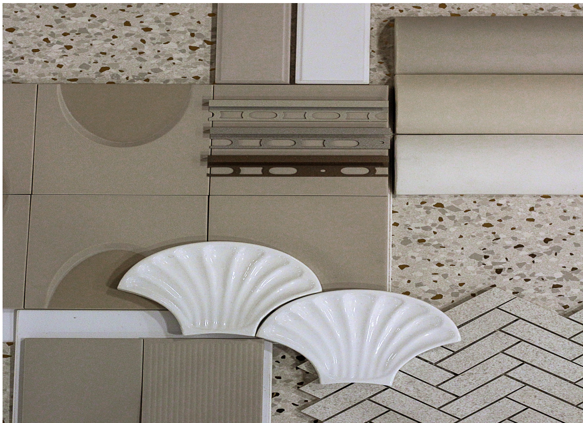
FLISHOVEDSTAD: Moodboard inspirert av Bologna.

– Blanke metallfarger i messing og gull kommer igjen i både fliser og kraner. Hovedfargen er lys og delikat med innslag av varme detaljer, sier Bazzanella.