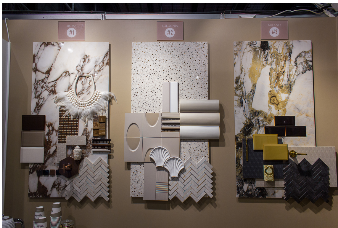
ITALIAINSPIRASJON DEL 1: Disse tre moodboardsen er inspirert av Roma, Bologna og Milano.