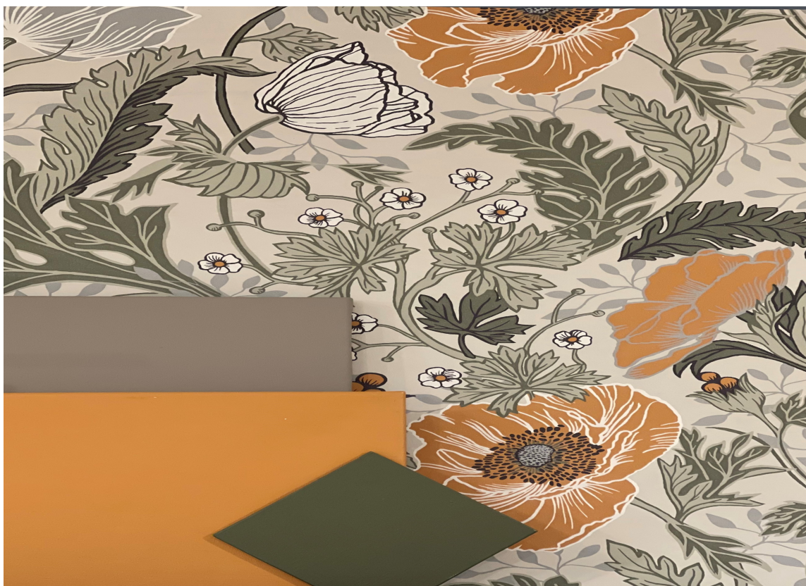
DETTE ER BRUKT: Fargene HH Rakle, HH, Ringblomst og HH Koriander. Tapet: Apelviken Nr 33001 fra Wall Concept.