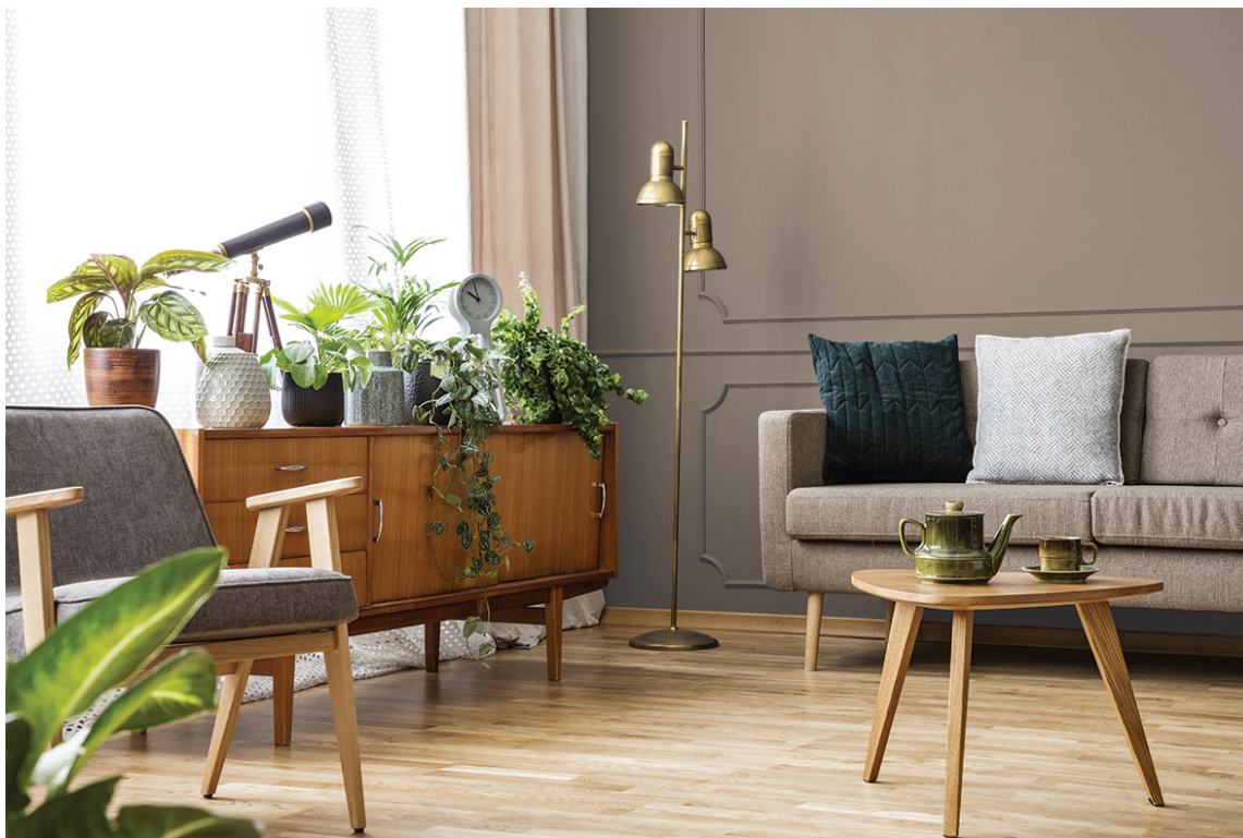
GOD KONTRAST: Fargen HH Rakle kommer fra den røde delen av fargesirkelen, og passer fint i kombinasjon med grønne planter og ulike grønne fargenyanser. Dette er en kombinasjon som skaper en rolig atmosfære.