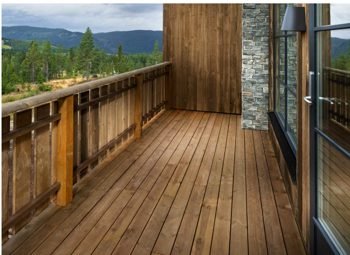
ROYALIMPREGNERT: Tyrilin Terrassebeis kan også benyttes til vedlikehold av royalimpregnert terrassebord og impregnerte tretak.