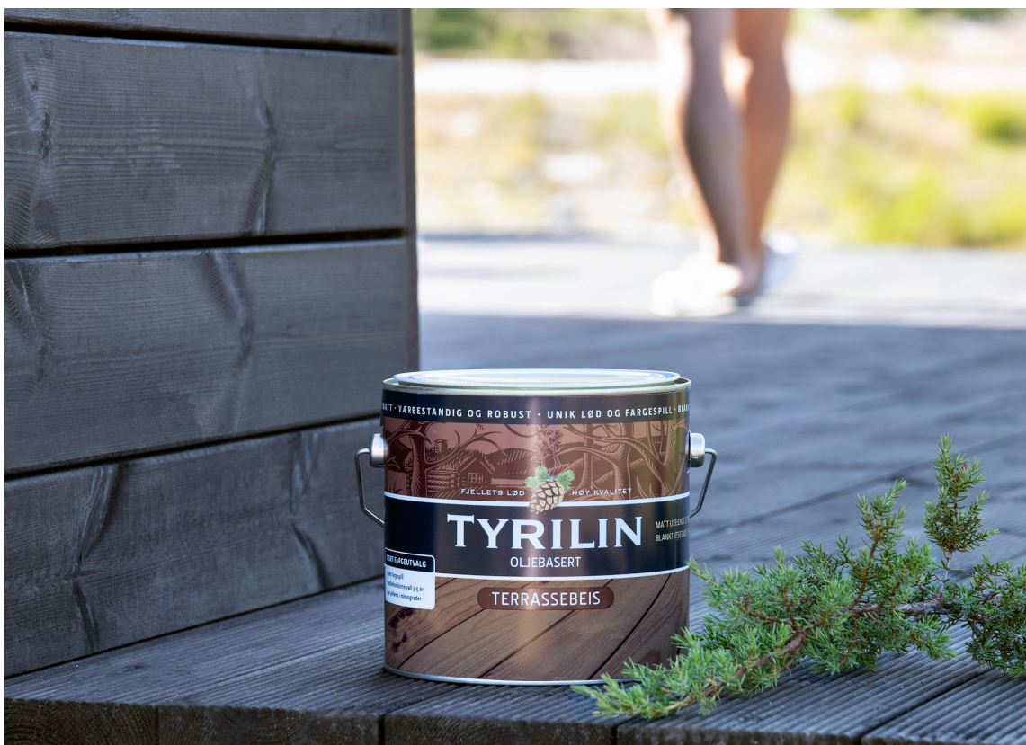
BESKTYTTELSE: Tyrilin Terrassebeis er spesialutviklet for å holde seg vakker selv på fjellet. Det er kombinasjonen av transparente pigmenter, UV-filter, tretjære og utvalgte oljer som gir et så flott fargespill og god holdbarhet.