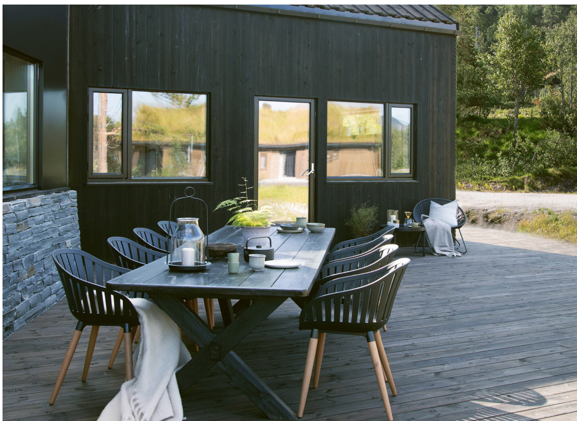
NATURLIG FARGE: Tyrilin Terrassebeis i fargen 1311 Tiur passer fint til den mørke veggfargen Svarthatten, fra Tyrilin Matt Beis.