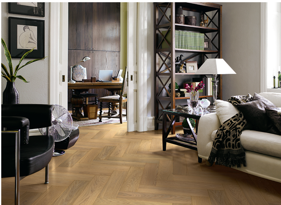
FISKEBENSPARKETT MED NATURLIG EIKEFARGE: Saltholm Natural Herringbone Oak fra Pergo.