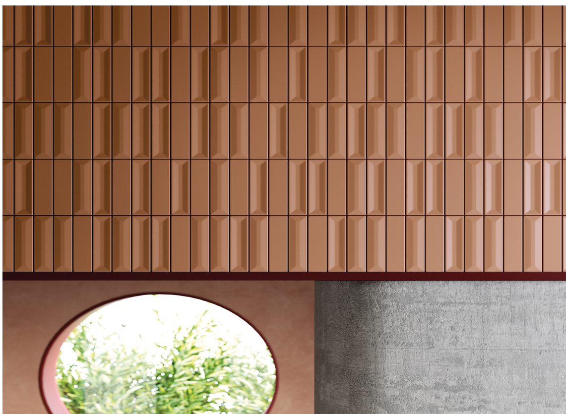
KOMBINASJON MED SMÅ FLISER: Vi bruker store og små fliser på nye, spennende måter, og flere har begynt å montere de avlange flisene stående. Det skaper en kul 70-talls-look.