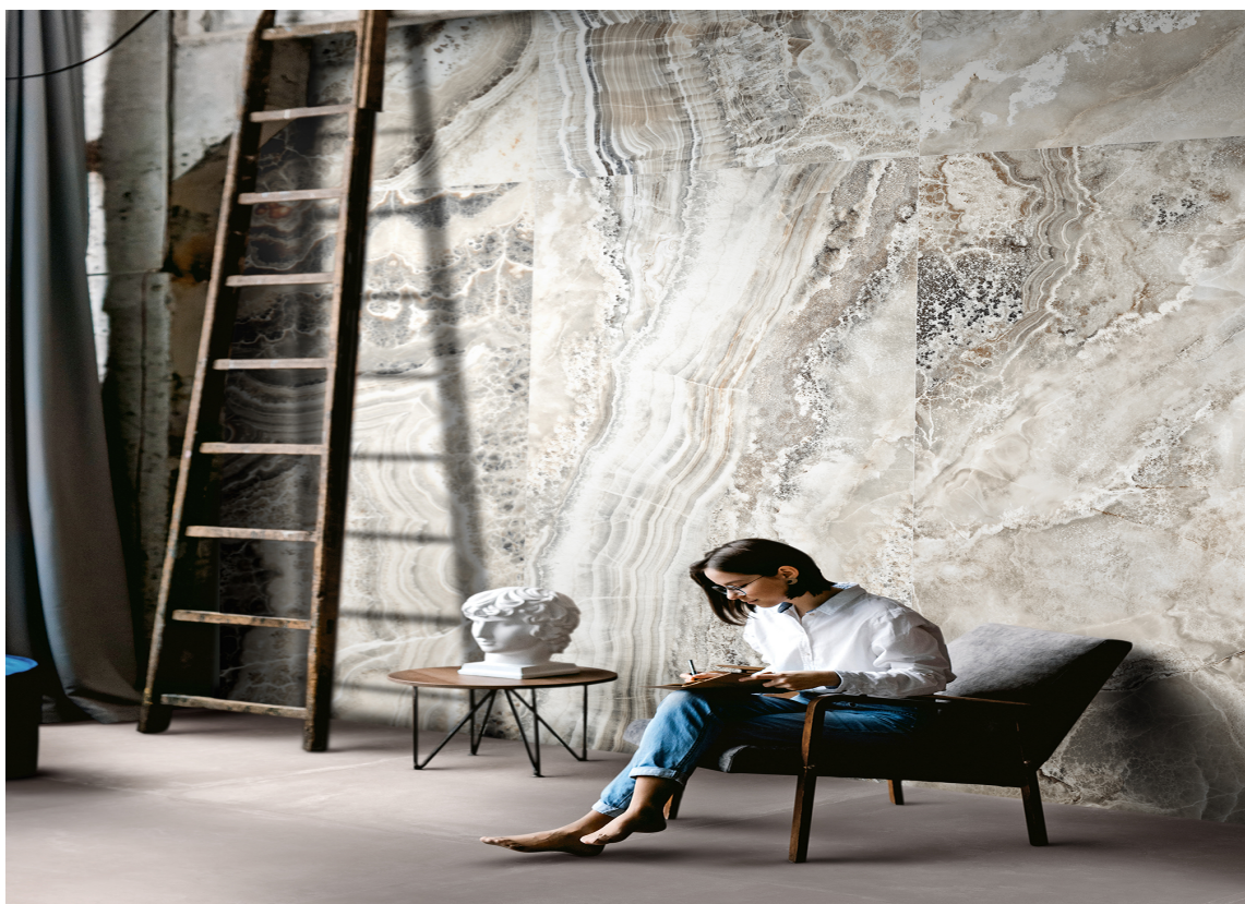
STORE FLISER: Marmorfliser i storformat er noe mange har fått øynene opp for, og det kombineres gjerne med mindre fliser.