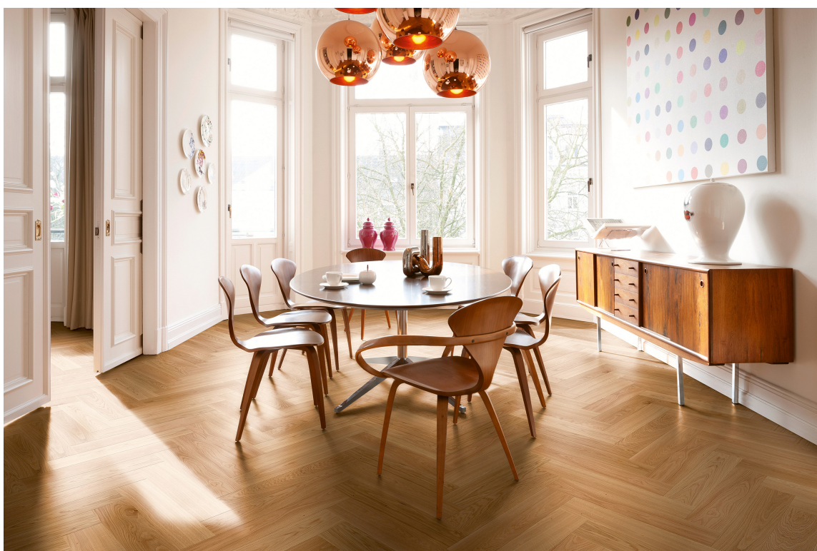
EKTE TRE: – Vi søker varmen fra ekte tregulv, og velger bærekraftige gulv som vil vare lenge. Flere og flere velger mer spennende mønstre som fiskebensmønster og chevronmønster.