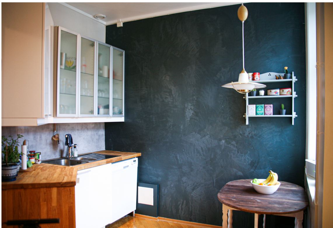
PERSONLIG STIL: Ingenting er mer personlig enn det du skaper selv, og som ingen kan kopiere. Mal for eksempel en vegg med sparkelmalingen "SPACE", slik som det unge paret fra Oslo har gjort her.