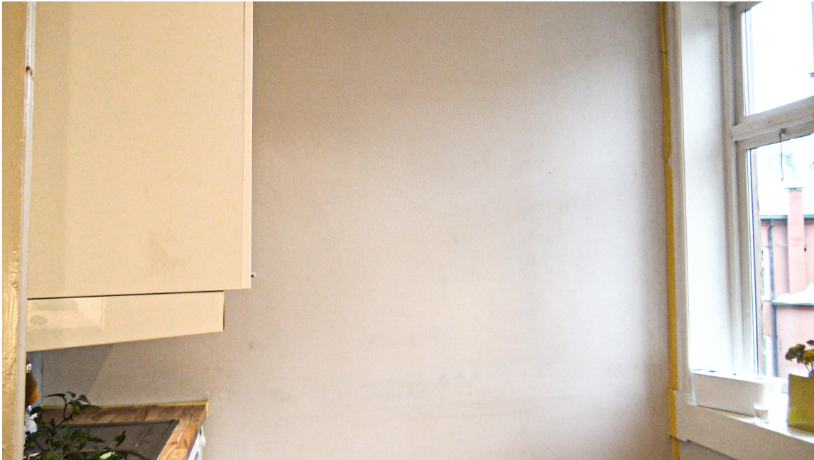
FØR: En hvit, traust kjøkkenvegg.