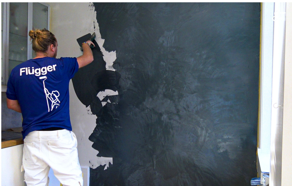
ENKELT: SPACE påfører du enkelt selv med brede sparkelspader.