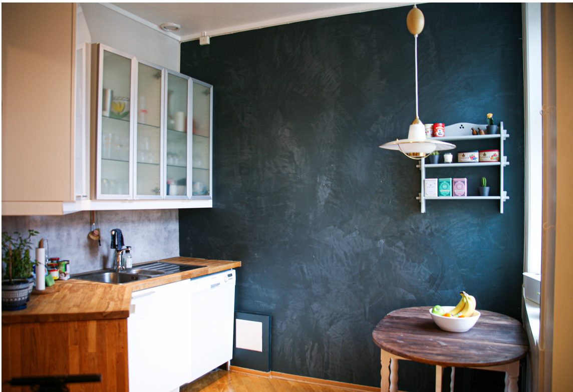
ETTER: Den levende, galaktiske veggen gir det ellers standardiserte kjøkkenet en helt ny atmosfære.