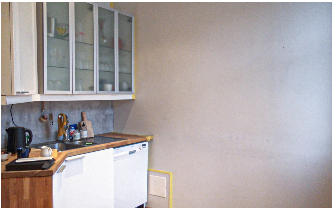
FØR: Veldig klar for litt farge.