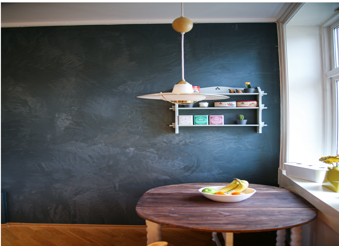
ETTER: Den blågrønne fargen "Orbit" står i stil med de danske designmøblene og varme gultonene.