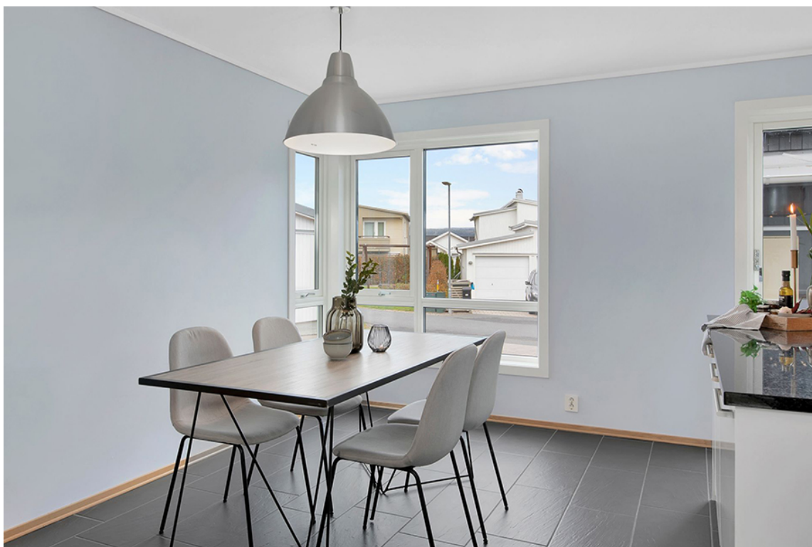
HVITT OG KJEDELIG: Slik så veggene til Merete og Øyvind ut da de kjøpte nytt hus i Drammen.

Tapetet «Into the Wild» består av mange blåtoner fra lys blå til nesten sort. Det var helt naturlig å hente opp en av disse blåtonene for å skape et helhetlig kjøkken og spisesone.