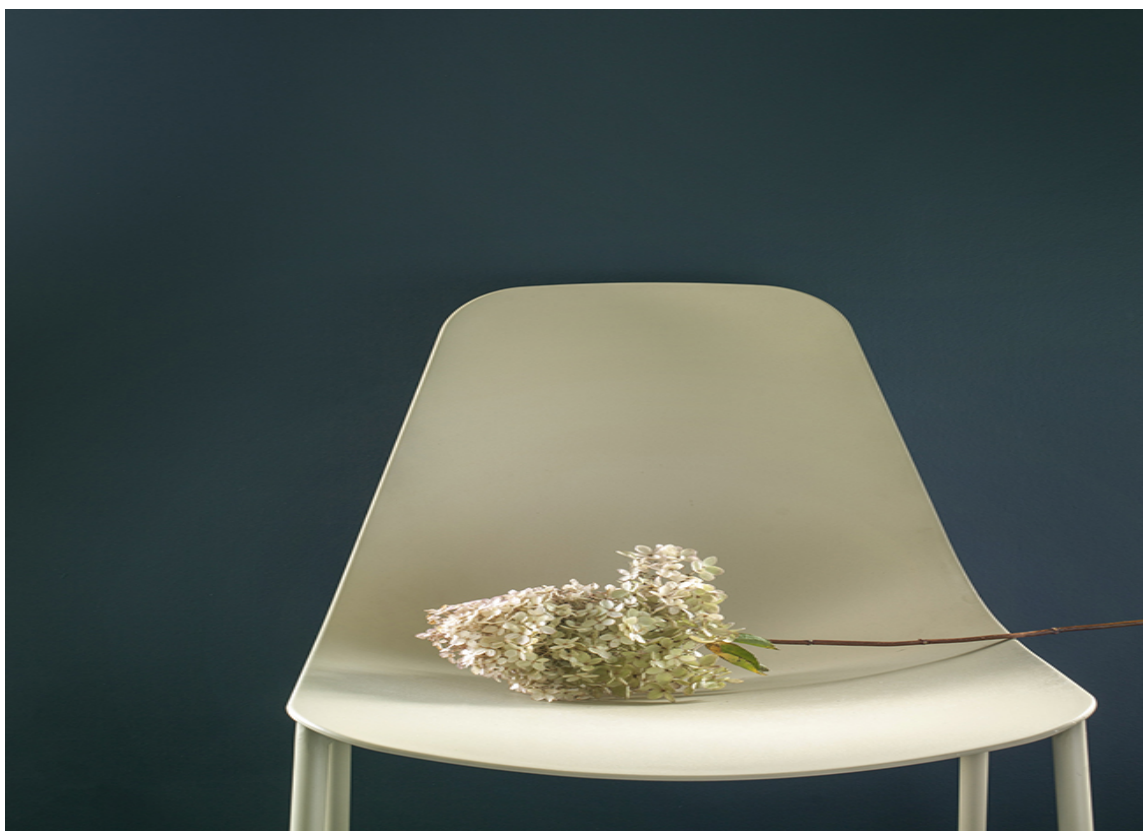
MATCHENDE STOL: En dus gulfarge står godt til den mørke blåtonen på veggene.

Kjøkkeninnredningen er hvit, så de ønsket å beholde lister og vinduskarmene hvite for å ta igjen det hvite i innredningen.