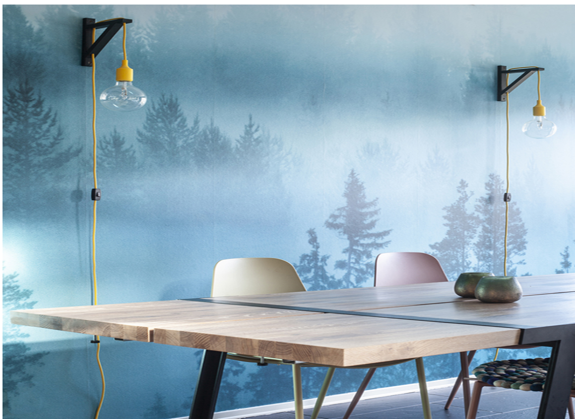
DIY-LAMPER: Lampene er laget av Muuto E27 pendel som er tredd gjennom en hylleknekt fra IKEA, malt i samme farge som kjøkkenveggene, 5905 Petroleum.