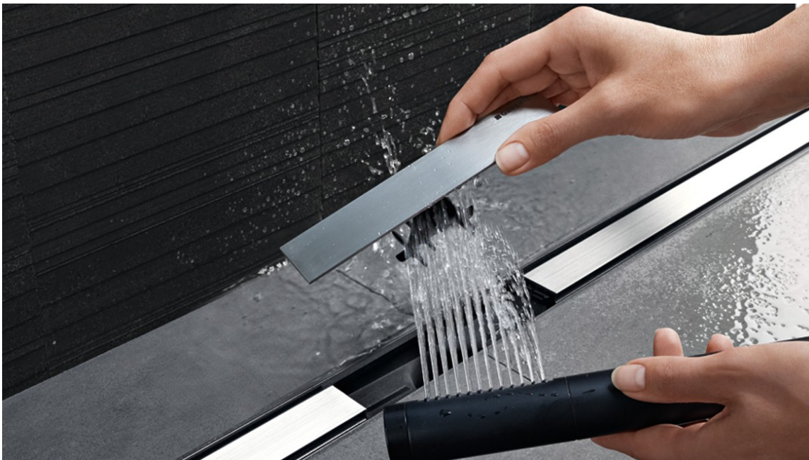
ENKEL RENGJØRING: Den praktiske hårsilen fanger opp smuss og hår, og kan skylles og rengjøres raskt og enkelt.