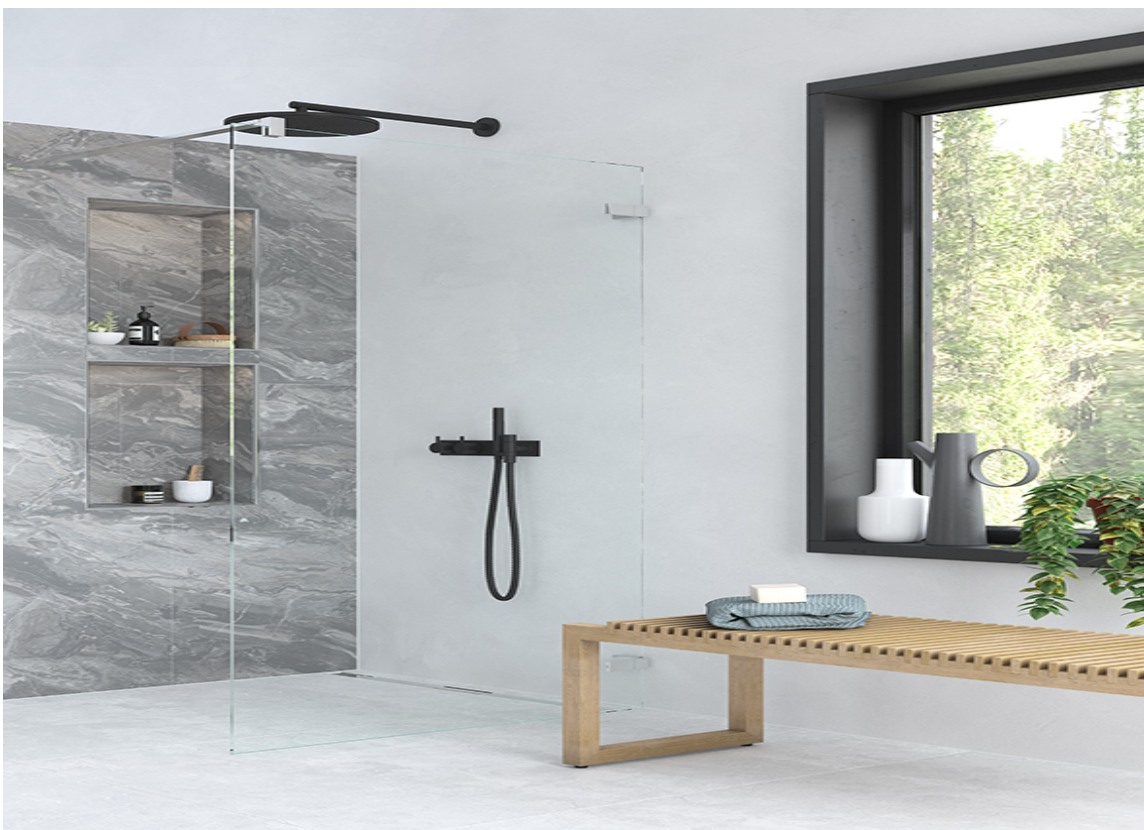
PASSER OVER ALT: Geberit CleanLine kan kuttes til ønsket lengde på stedet, og dermed tilpasses perfekt til dusjområdet. Og med de klassiske og diskre designerlinjene passer den inn i ethvert baderomsinteriør.