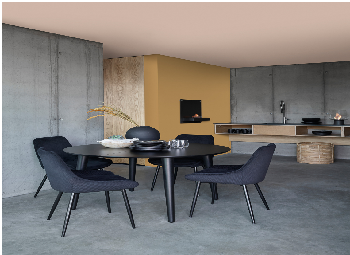
NORDISK LYSROSA OG RUSTIKK GULL: Disse fargene spiller godt sammen og skaper et trendy men også varig uttrykk.