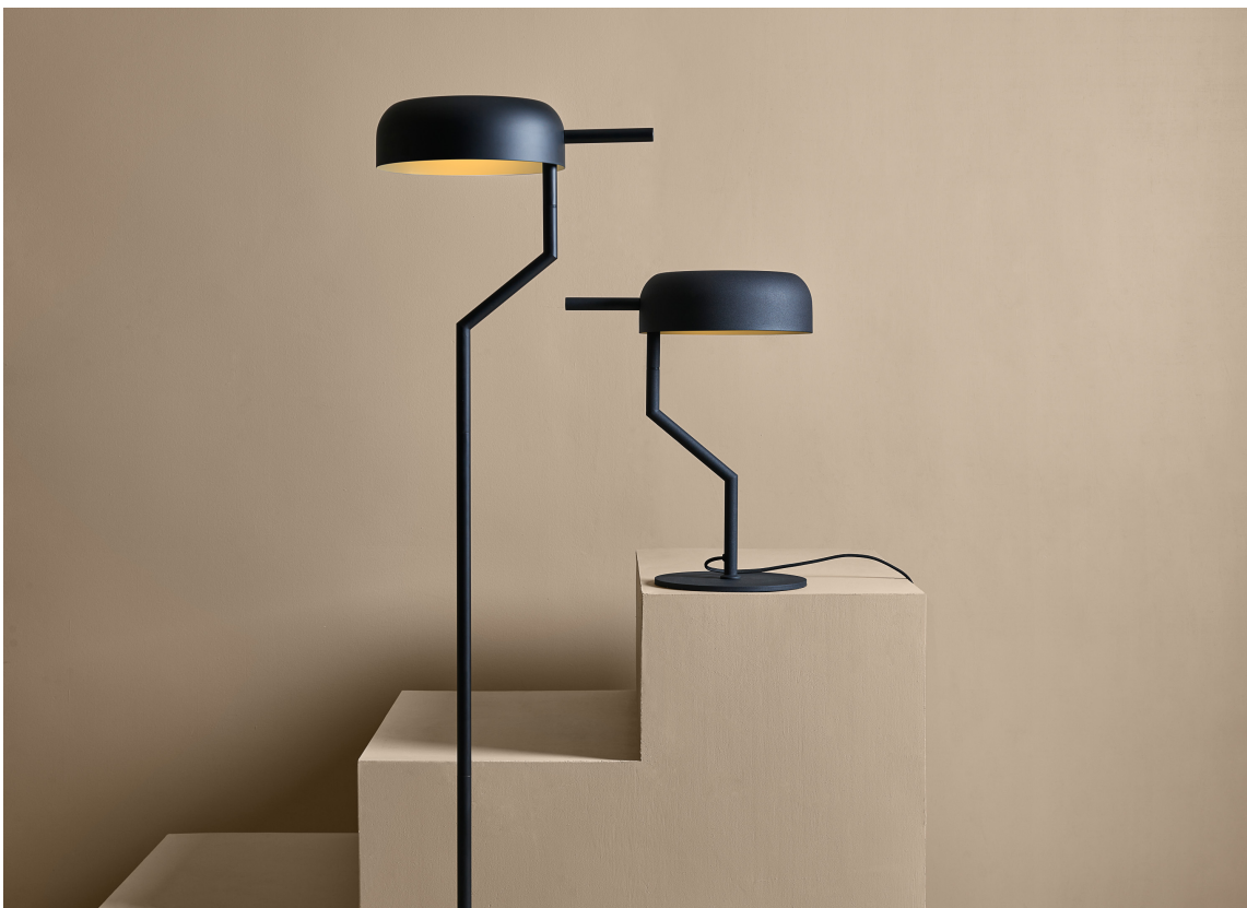
BEIGE: Beigetoner fra sanden bringer også naturen inn i hjemmet.