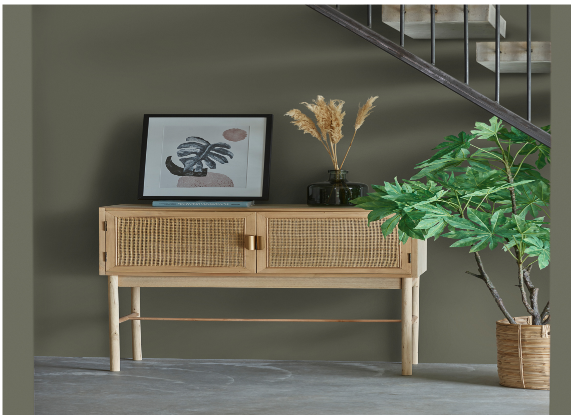
NORDISK GRÅGRØNN: Ta med deg naturen hjem ved å fargesette veggene med nyanser inspirert av norsk skog.