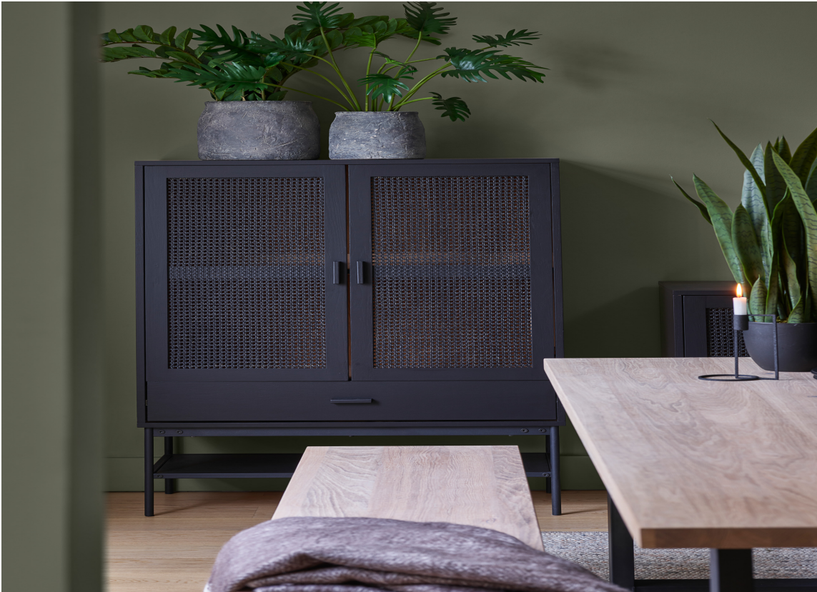
NORDISK GRÅGRØNN: Naturens egne fargepalett er alltid trygge fargevalg som kan gi deg følelsen av skogens ro hjemme.