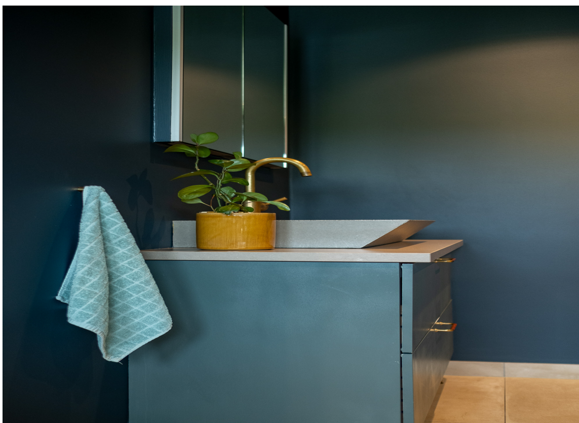
STØRRE ROM: Mange opplever at rommet virker større med en mørk veggfarge, fordi veggene er mer synlige og tilstede sammenlignet med lyse vegger