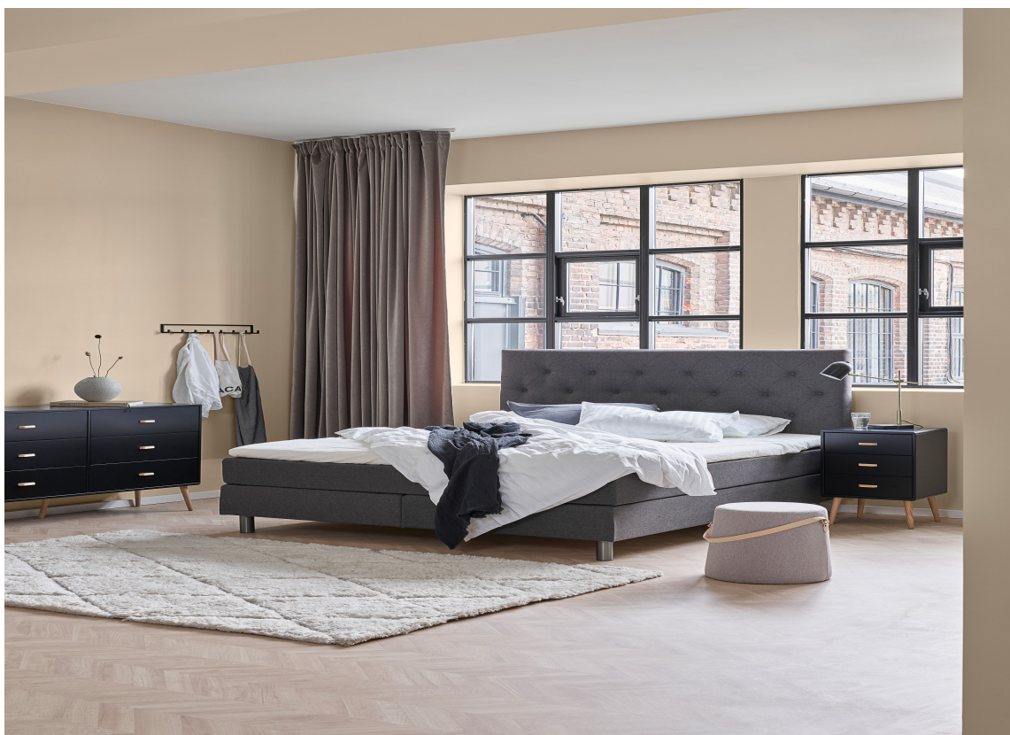
KLASSISK BRUNBEIGE: Denne fargen er skapt for å gi økt livskvalitet og ro i sjel og sinn.

– I denne forandringens tid har nettopp det å ta seg en tur ut i naturen for mange blitt en større og mer naturlig del av dagliglivet, som gir både økt livskvalitet og ro i sjel og sinn. Ta med deg denne følelsen hjem ved å fargesette veggene med KLASSISK BRUNBEIGE og NORDISK GRÅGRØNN, skriver de.