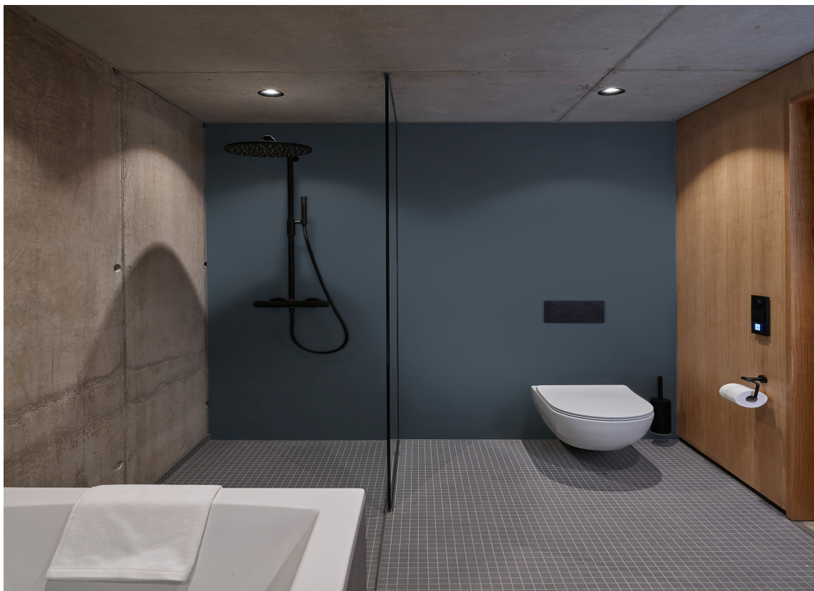
NORDISK MØRKEBLÅ: Dette er den perfekte mørke veggfargen for et spennende interiør med karakter.