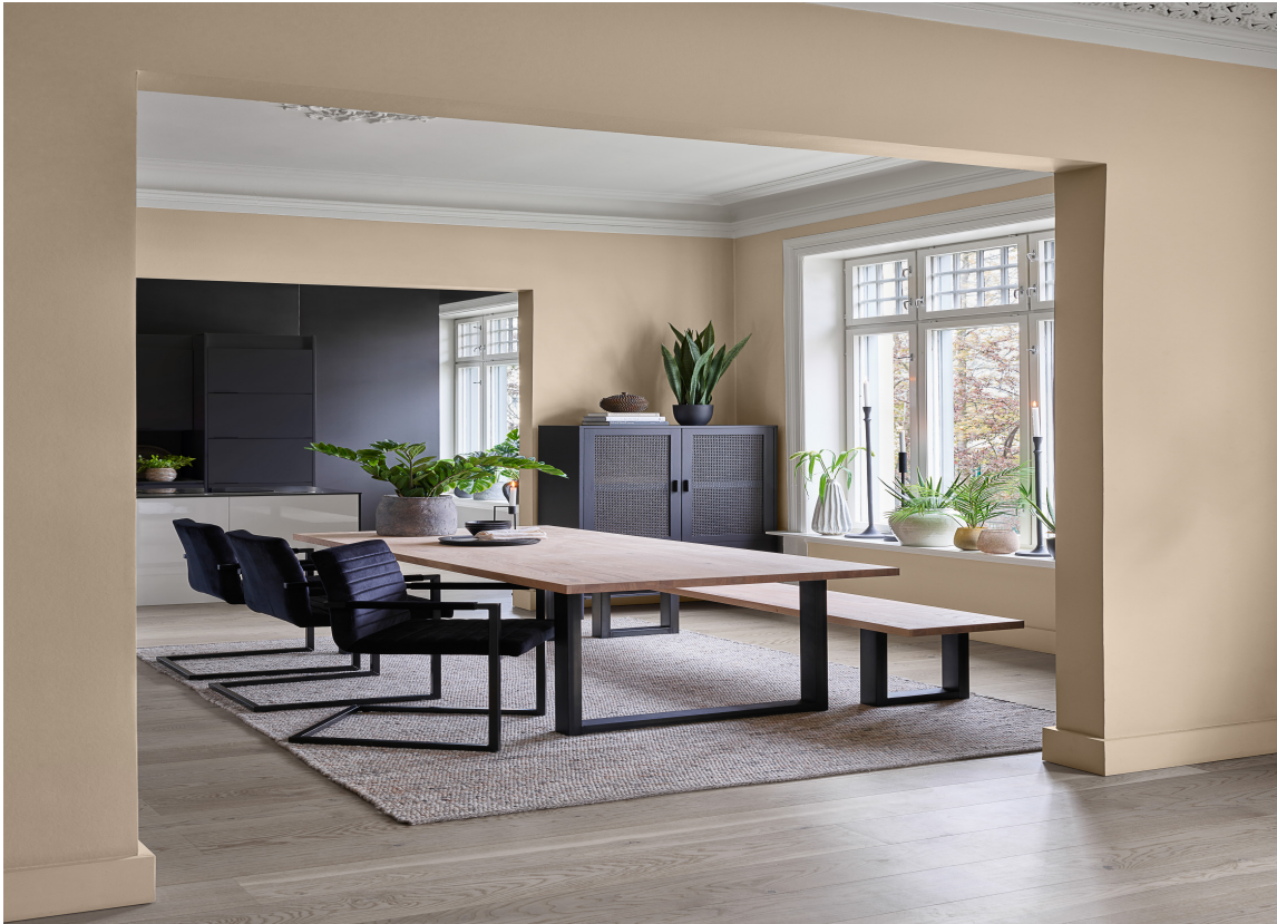
VEGGFARGE: KLASSISK BRUNBEIGE