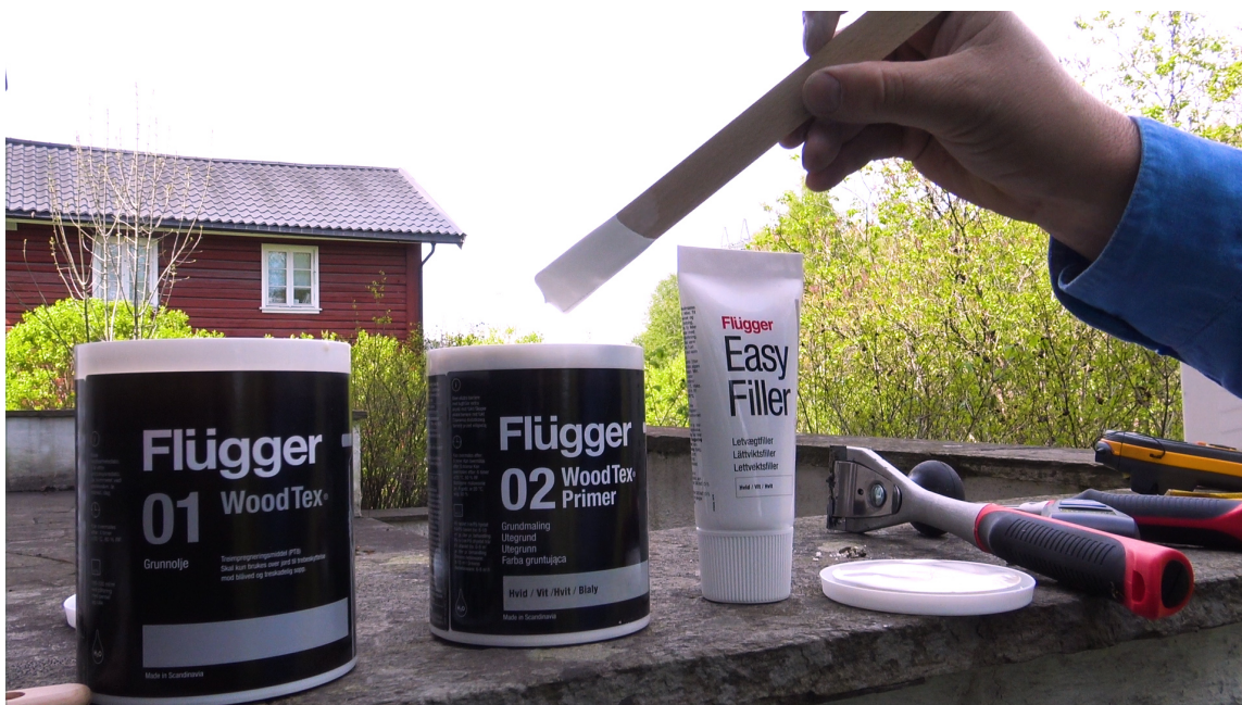
LENGRE HOLDBARHET: For lengre holdbarhet påfører du Flügger 02 Wood Tex Primer etter du har grunnet med 01 Wood Tex Grunnolje.