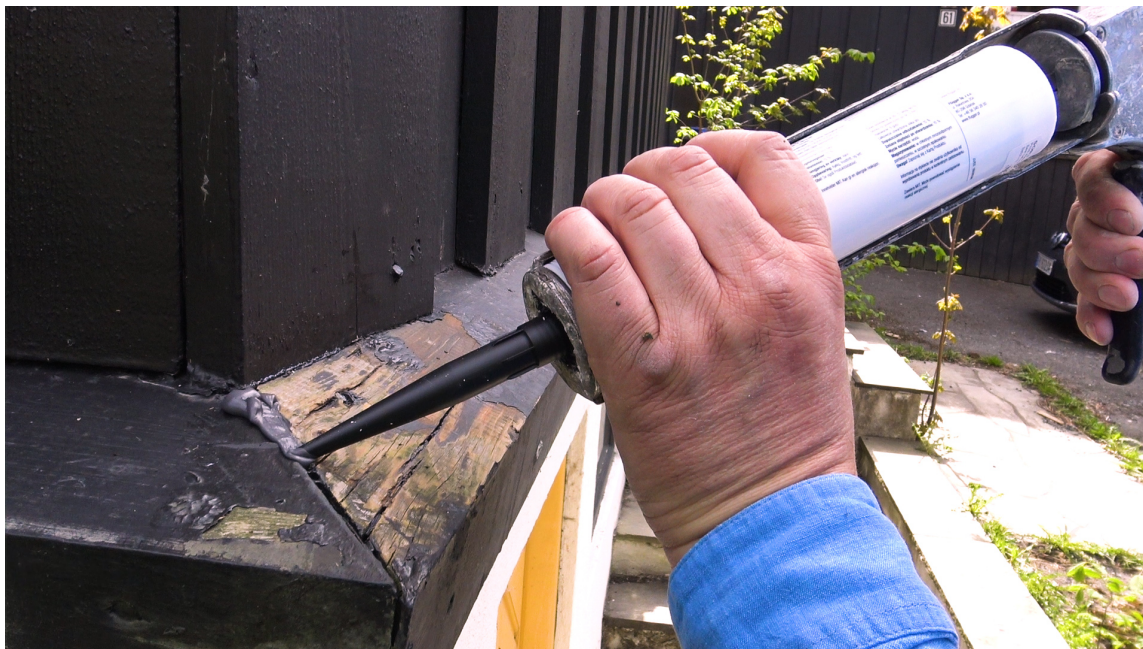
UTVENDIG AKRYL: På større sprekker bruker du en utvendig akryl, som Flügger Wood Seal.

– Denne gir bedre vannmotstand og sikrer enda bedre vedheft, som gir en fyldigere overflate. Da vil du få lengre holdbarhet på kledningen din, tipser Fridheim.