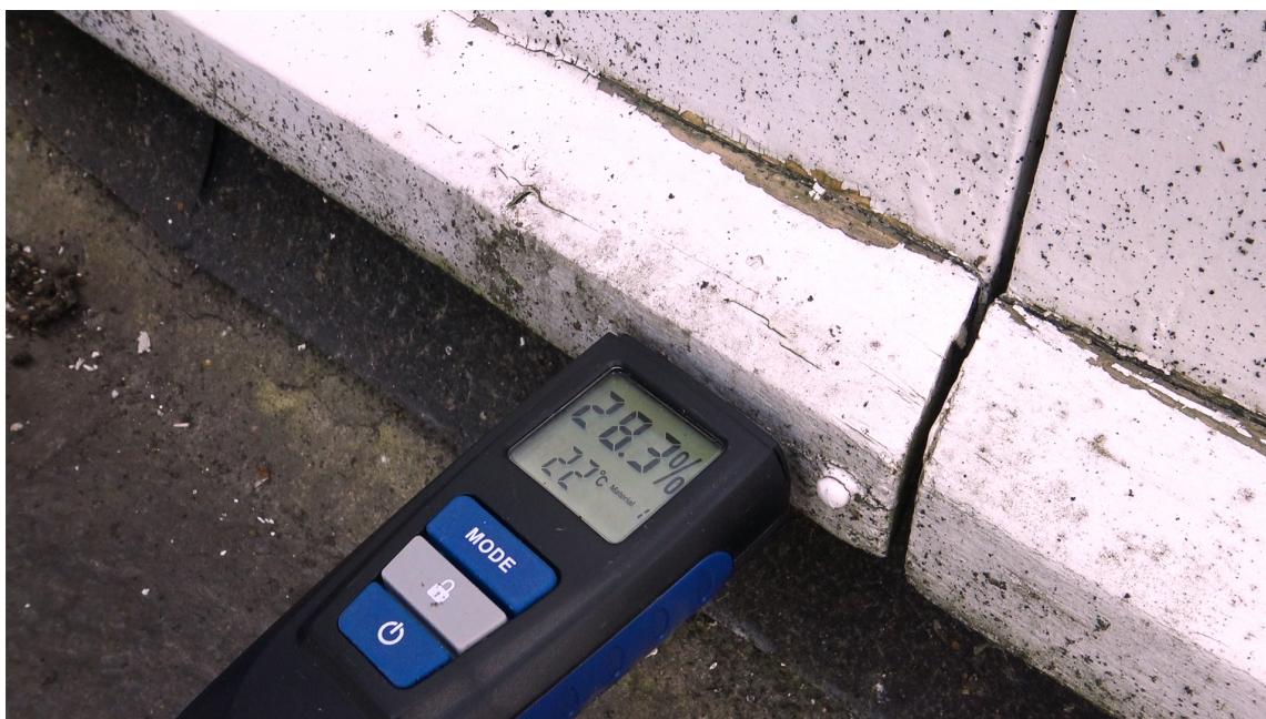
FUKTMÅLER: En fuktmåler koster 100-200 kr, og forteller deg om det er for mye fukt i et område.